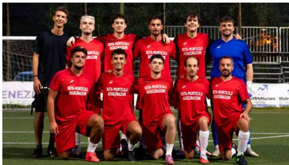
📷 Il Ruta/Monticolo Assicurazioni, qualificato per l'ultimo atto della Crese Summer

la prima fase superano per 4-1 il Costalunga in semifinale, mentre nell'altro incontro finisce 8-7 per Tushja e compagne in un appassionante incontro con le Ciocciottelle. Finale degli Under 19 tra Lupi de Borgo e Nevio(r) Give Up; i ragazzi di Borgo