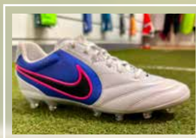
NIKE Tiempo Ligera Pro AG 55