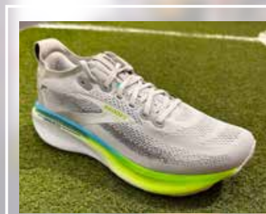
BROOKS Adrenaline GTS 25