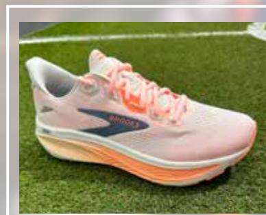
BROOKS Ghost 18