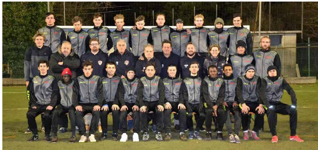
📷 Ripesccaggio in Seconda Categoria per il Pro-Secco Primorje

L e prime partite ufficiali della nuova stagione si giocheranno sabato 22 agosto, quando prenderanno il via le Coppe Italia di Eccellenza e Promozione. Una settimana dopo partirà anche la Coppa Regione di Prima Categoria, mentre domenica 6 settembre ci sarà il calcio d'inizio sia dei primi due campionati regionali dilettantistici che delle Coppe di Seconda e Terza. Il 13 settembre prima giornata del campionato di Prima, il 27 inizierà la Seconda Categoria, mentre per la Terza la data di inizio è ancora da determinare. Per quanto concerne i tornei giovanili, ci sono le date di inizio di quelli regionali, mentre per provinciali e Under 14 va ancora definito il momento di cominciare. Il principale torneo regionale Under 19 inizierà sabato 5 settembre, dopo sette giorni al via anche gli Under 18; domenica 13 settembre primi incontri per i due tornei Allievi e per gli Under 15. Lunedì prossimo si apriranno le iscrizioni, con termine perentorio per