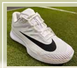
NIKE Zoom Vapor Pro 3 HC