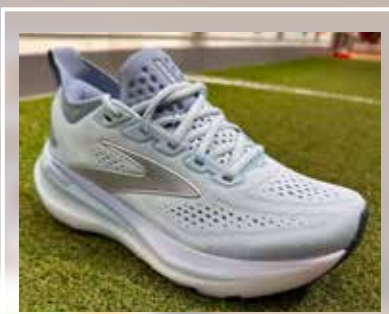
BROOKS Glycerin 23