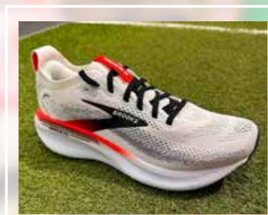
BROOKS Adrenaline GTS 25