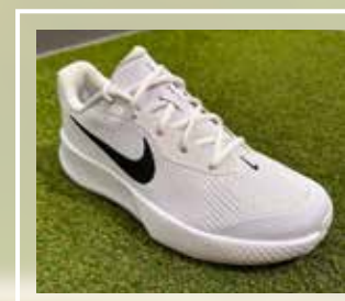
NIKE Vapor Lite 3 HC

AMPIO MERCHANDISING DELLE SQUADRE DI CLUB