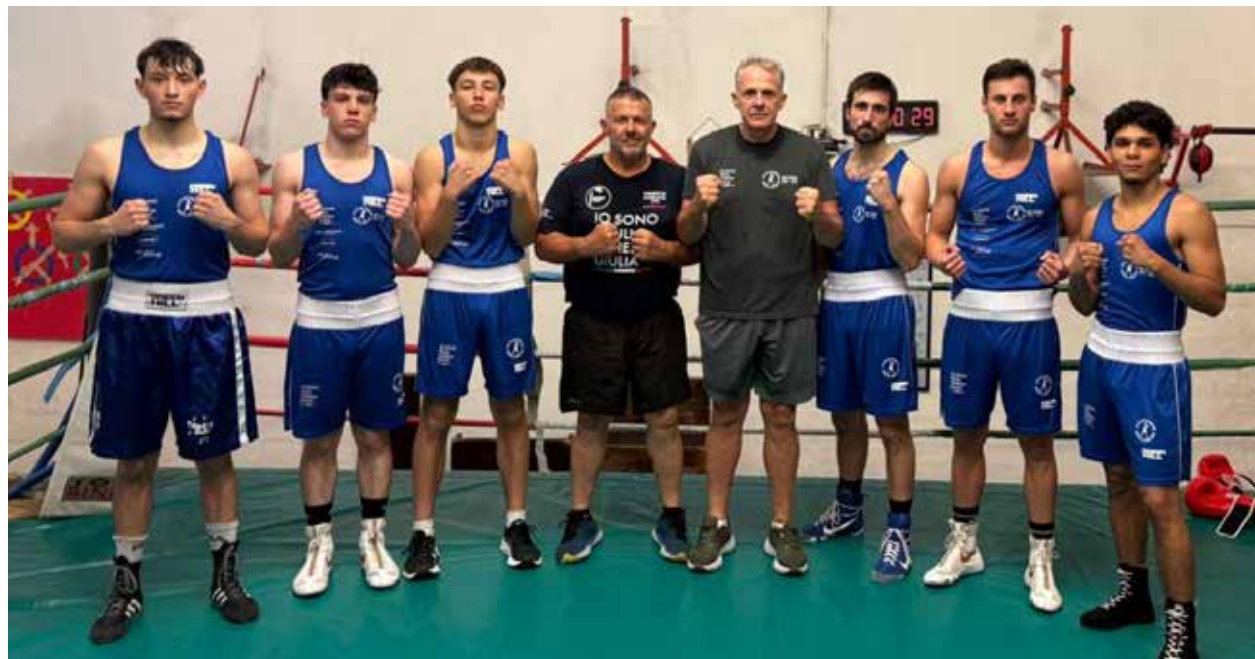
📷 Ottima figura, un mese fa, per la rappresentativa di boxe del Fvg nella trasferta veneta

Il prossimo fine settimana si replica al palasport di Aquilinia