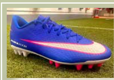
NIKE Zoom Vapor 16 Academy AG 56