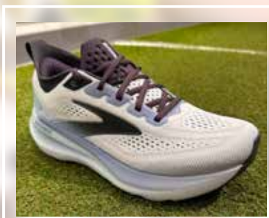
BROOKS Glycerin 23