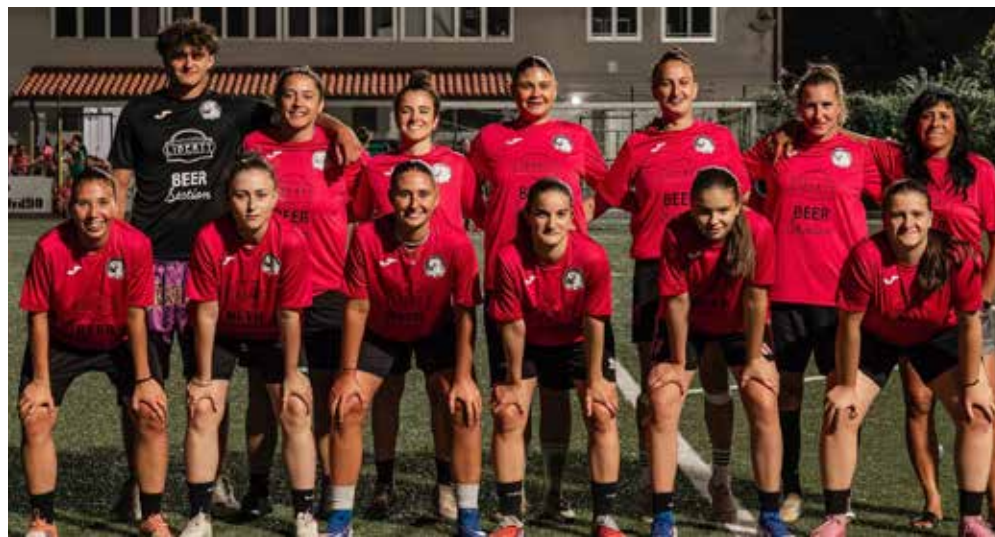
📷 Ai 2 Magnoni, finalista nel torneo femminile

La Summer è una questione tra Termodrim e Ruta/Monticolo Assicurazioni. In semifinale (gara secca in questo torneo) i primi hanno la meglio sulla Dinamo Leghissa/Ristorante Buca 19 per 5-3, mentre il Ruta/Monticolo piega 3-2 la Pizza Smile. La finale della Replay sarà