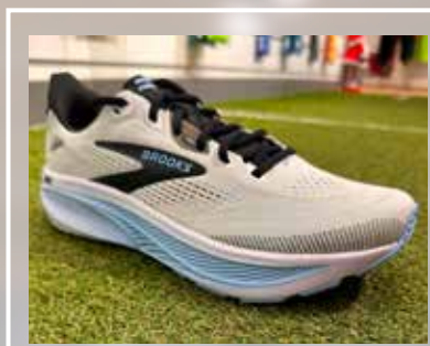
BROOKS Ghost 18