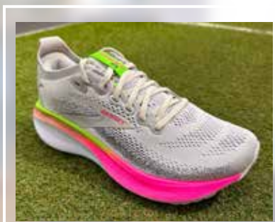
BROOKS Adrenaline GTS 25