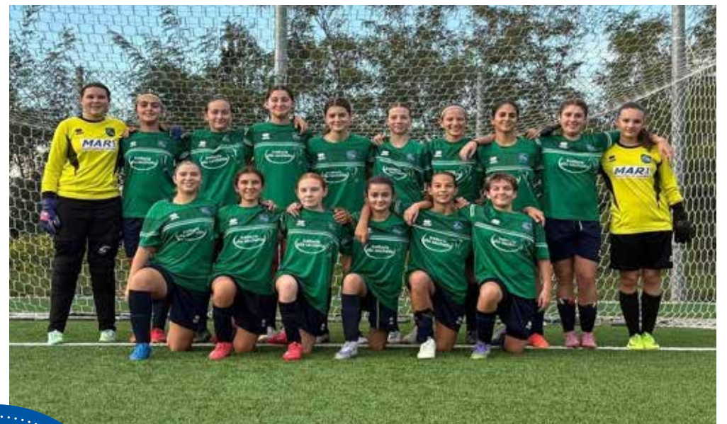
📷 La formazione femminile Under 15 del Club Altura

difende il vantaggio acquisito, perdendo 2-1 in un incontro gestito comunque con solidità. Qualche apprensione per l'immediato 1-0 dei padroni di casa, a segno su calcio di rigore, ma i giuliani non si fanno prendere dal timore di essere rimontati e gestiscono bene la situazione. A metà ripresa il gol della sicurezza lo realizza Porro, al termine di una bella azione corale, e la seconda rete della Pro Gorizia arriva nei minuti finali, troppo tardi per pensare di rimettere in discussione il discorso qualificazione. Mercoledì in campo l'Opicina per la partita di ritorno contro il Corno. La Polisportiva può contare sul successo in trasferta conquistato nella sfida di giovedì: un 5-1 frutto delle doppiette di Rebetz e