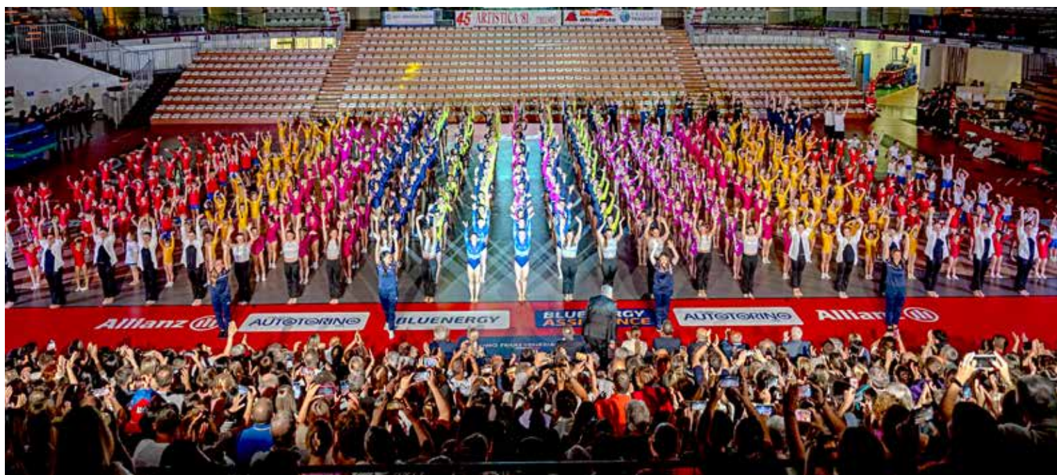
📷 Alcune immagini del saggio di venerdì scorso, al quale sono intervenute anche le autorità istituzionali con il sindaco Roberto Dipiazza e gli assessori regionale Pierpaolo Roberti e comunale Elisa Lodi

pegni e sacrifici nel corso degli anni, ma anche da soddisfazioni e gratificazioni così grandi che hanno portato lustro all'Artistica '81, alla città e alla regione". Particolarmente emozionante è risultato l'esercizio realizzato dal Gym Team, che raccoglie