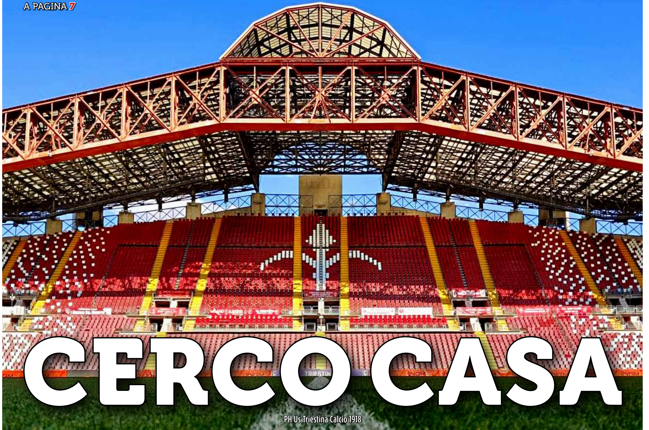
PH Us Triestina Calcio 1918