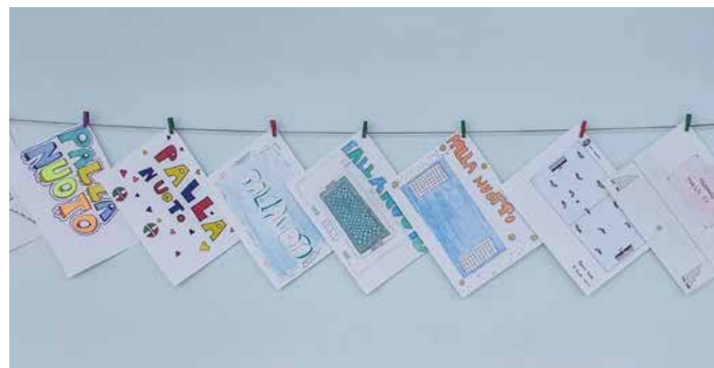
📷 Una parte dei 73 elaborati realizzati per il contest creativo

Dopo gli incontri con gli atleti delle squadre di serie A1 maschile e femminile e gli Open Day, l'esposizione rappresenta