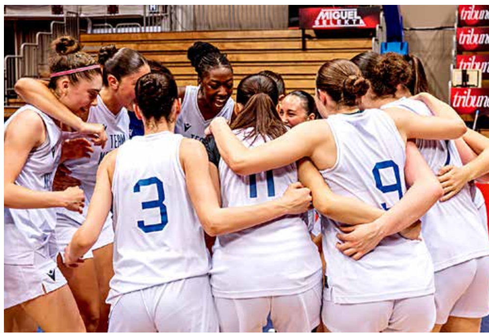
📷 Nel fotoservizio di Stefano Quarantotto, alcuni momenti della prima edizione del torneo Next Gen Under 19 femminile, in scena nei giorni scorsi al PalaTrieste

L e premesse per una tre giorni di grande basket giovanile c'erano tutte e non sono state affatto deluse. È stato un successo la prima edizione del torneo Next Gen Under 19 femminile , con le Final Eight che si sono tenute al PalaTrieste. A trionfare sono state le ragazze della Geas Basket Academy che hanno battuto in finale l'Umana Reyer Venezia. Grande soddisfazione anche per il Futurosa, impegnato nella doppia veste di organizzatore e di squadra partecipante. Percorso netto per la Geas, ma non privo di pathos. Alla vittoria abbastanza agevole contro Roma nella prima giornata, è seguito un match al cardiopalma contro la Selezione delle Squadre Nazionali della Fip, deciso ai supplementari. Tirata anche la finale contro l'Umana Reyer Venezia, col punteggio di 75 a 68: partita equilibrata, con un'ottima prestazione corale che ha permesso alle ragazze di Sesto San Giovanni di alzare il trofeo. Decisivi i 24 punti di Ostoni, che ha tirato con ottime percentuali sia dentro che fuori dall'arco. È iniziato fin da subito in salita il percorso del Futurosa. Le rosanero sono state infatti sconfitte all'esordio dalla Selezione della Fip, che raggruppava i migliori talenti delle squadre rimaste escluse dalle Final Eight e ha poi ottenuto