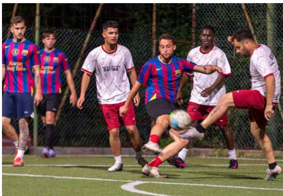
📷 Una fase di Panificio Dafina - Sorry Mama, match dell'ultimo turno del girone

Le prime partite a eliminazione diretta portano avanti facilmente il Barnobi (8-0 all'Allianz) e Panificio Dafina (8-2 allo Jadranka Izola), mentre il Bar G si impone per 4-1 sulla Dinamo Leghissa. Non deve nemmeno giocare il Nistri per accedere ai quarti di finale, vista la rinuncia del Sorry Mama e la conseguente vittoria a tavolino per i campioni