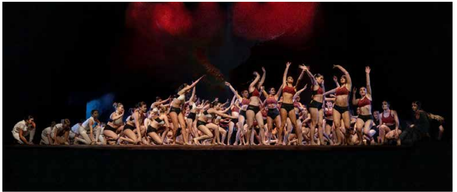
Alcune immagini di scena relative agli spettacoli degli anni scorsi di Progetto Danza Trieste

S port e arte si fondono in "Mediterraneo", lo spettacolo che andrà in scena mercoledì 10 giugno alle ore 20 al Politeama Rossetti. Un viaggio simbolico che unisce danza, ginnastica acrobatica e movimenti di pole dance, in un intreccio di forza, flessibilità e grazia. Sul palco si alterneranno oltre 100 performer, protagonisti di un racconto corale costruito attorno al tema del viaggio e della trasformazione. Lo spettacolo è organizzato e diretto dall'associazione Progetto Danza Trieste , che anche quest'anno ha coinvolto diverse realtà della regione.