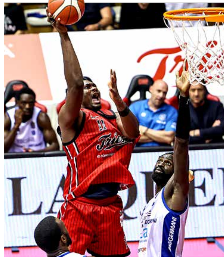
📷 Doppia-doppia sfiorata in gara-4 per Sissoko: 15 punti e 9 rimbalzi

FATTORE BANNAN L'australiano è ormai il protagonista assoluto di questa squadra e di questa serie: nel momento terribile della prima metà del match di sabato scorso, assieme a Ross è stato l'uomo della Provvidenza.