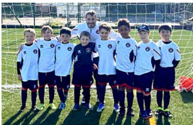
📷 I Primi Calci