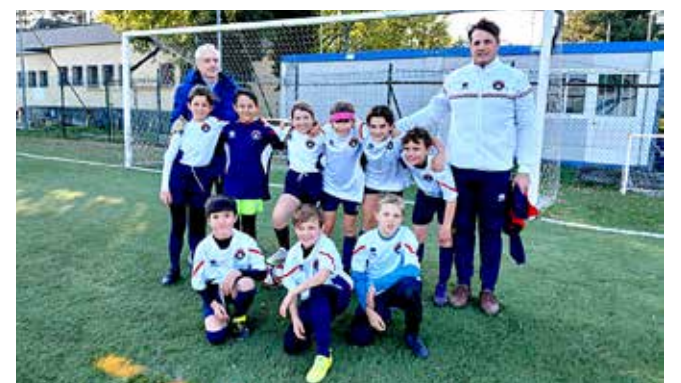
📷 I Pulcini