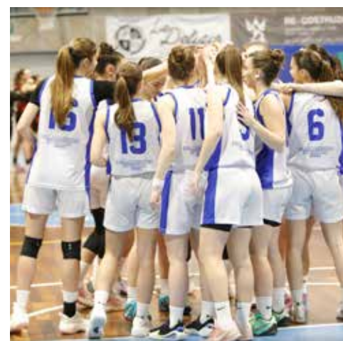
📷 L'Interclub Muggia saluta la serie B femminile

un ulteriore strappo per riaprire il match in extremis. "Non è bastato il cuore in campo non è bastato per portare a casa la vittoria" commenta Fuligno, "abbiamo confezionato attacchi sempre troppo affrettati contro una difesa aggressiva, riuscendo comunque a creare gioco e stare in partita. Il break del terzo periodo dove non riusciamo a segnare ha poi compromesso la partita. Mi dispiace tantissimo, il campo ha dato il suo verdetto e questo bisogna accettarlo, le ragazze sono giovani come sa-