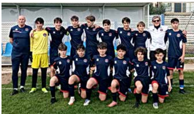
📷 Gli Under 15

Infine qualche previsione per il futuro: "Quando è nata l'idea di questo progetto ho posto fin da subito dei paletti senza i quali a parer mio non puoi nemmeno pensare di iniziare. Parlo di tecnici validi, campi da gioco e stabilità economica. Dal