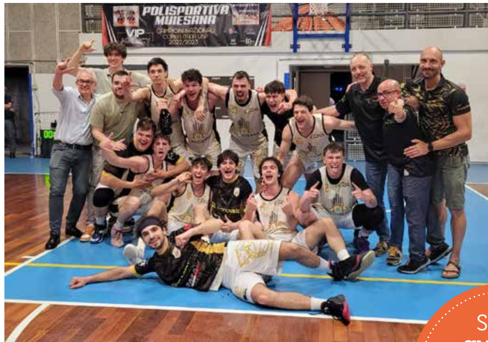
📷 La Tecnogiemme Venezia Giulia brinda alla vittoria in gara-3 e alla promozione in C