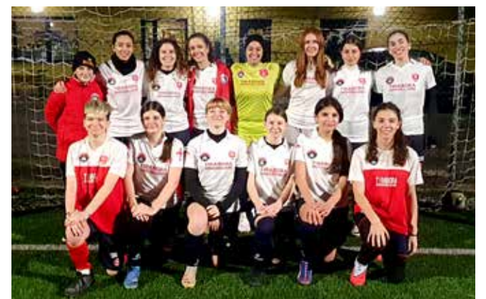
📷 La squadra femminile a 7

prossimo anno ci alleneremo anche nel terreno a sette di Costalunga, quindi organizzeremo vari open day nei mesi a venire. Ci tengo poi a sottolineare come tutti coloro che lavorano per questa realtà sono volontari al 100%, quindi va lodato l'impegno che ci mettono giorno per giorno. Inoltre