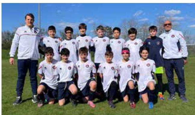
📷 Gli Esordienti