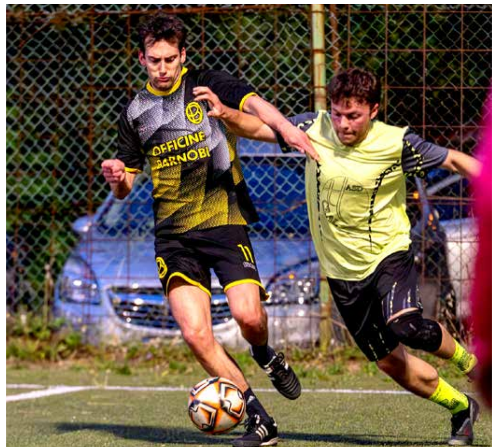
Una fase del match tra Officine Barnobi e Cral Trieste Trasporti

BARNOBI 3 TRASPORTI 1 GOL: Barnobi S., Comugnaro, Zollia; Meyer