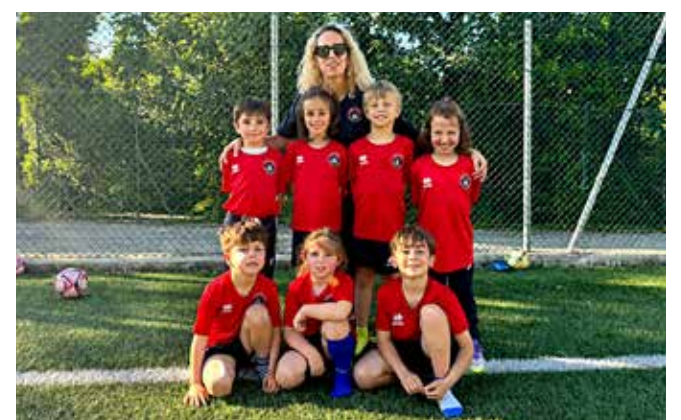
📷 L'altro gruppo dei Piccoli Amici