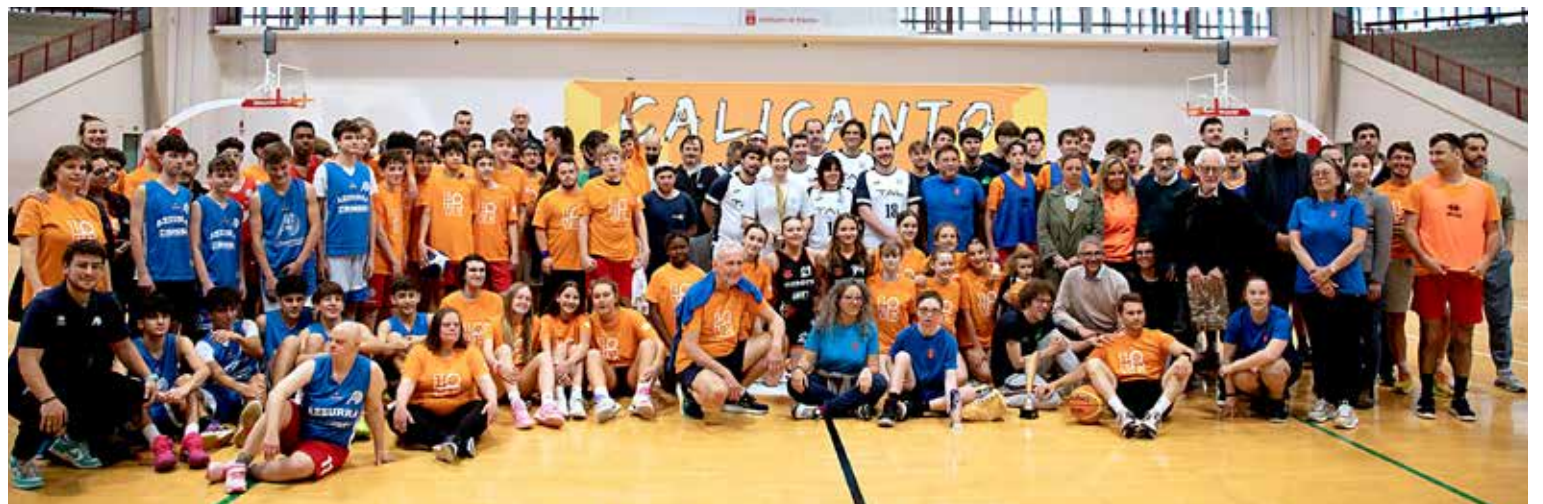
📷 Due immagini dell'ultima, riuscita edizione di Integralmente Sport a Chiarbola e una della presentazione degli eventi estivi di Calicanto, avvenuta una settimana fa al Trieste Campus