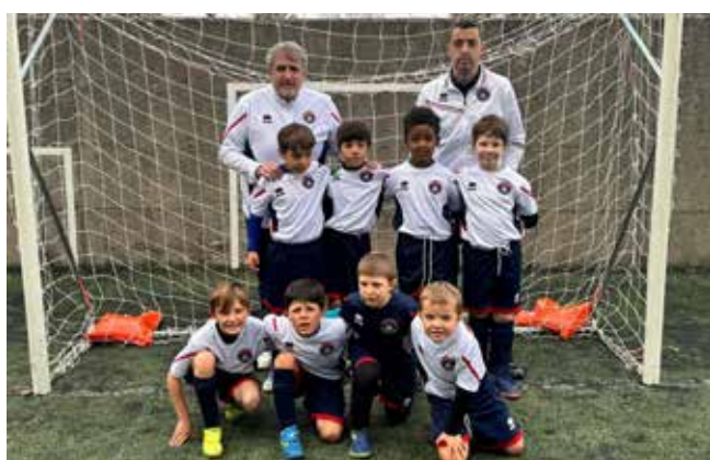
📷 I Piccoli Amici