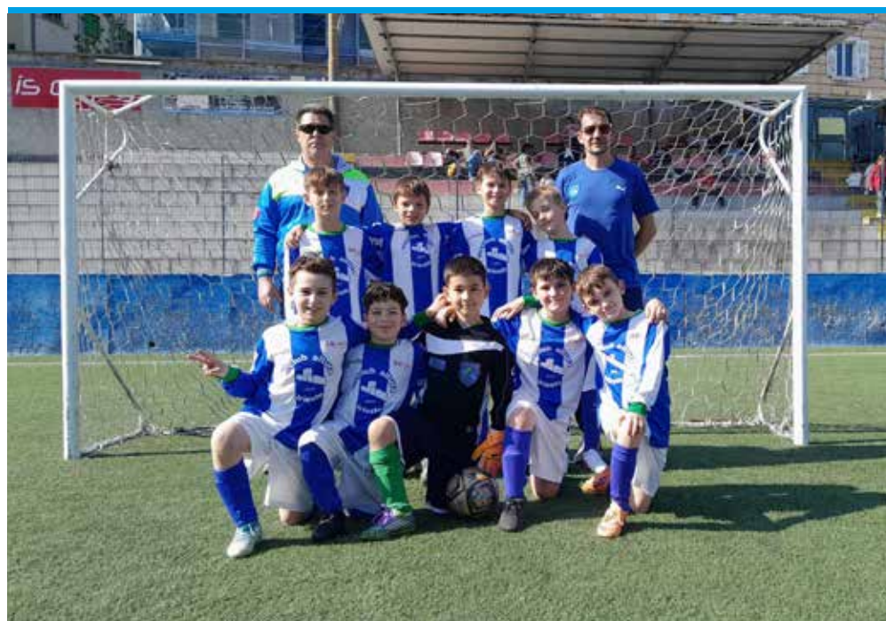
📷 Il Club Altura blu, sabato vittorioso con il San Giovanni B

Una sola partita anche nel gruppo B, con la Trieste Victory Academy B che ha la meglio sul San Giovanni A, espugnando il campo di viale Sanzio per 4-1. Giovedì la gara tra il team C di Borgo San Sergio e lo Zarja. I carsolini hanno recuperato l'incontro con il Cgs, vinto dagli studenti che portano a casa tutti e quattro i parziali: dopo un primo tempo dal divario ampio, gara più combattuta negli altri tre periodi di gioco. Incontri equilibrati quelli giocati nel girone C, con vittorie per 3-2 di Opicina B e Club Altura blu. La Po-