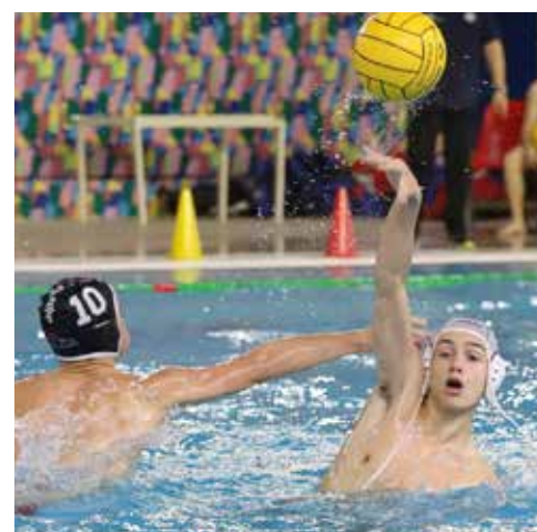
📷 Proseguono senza sosta gli impegni giovanili