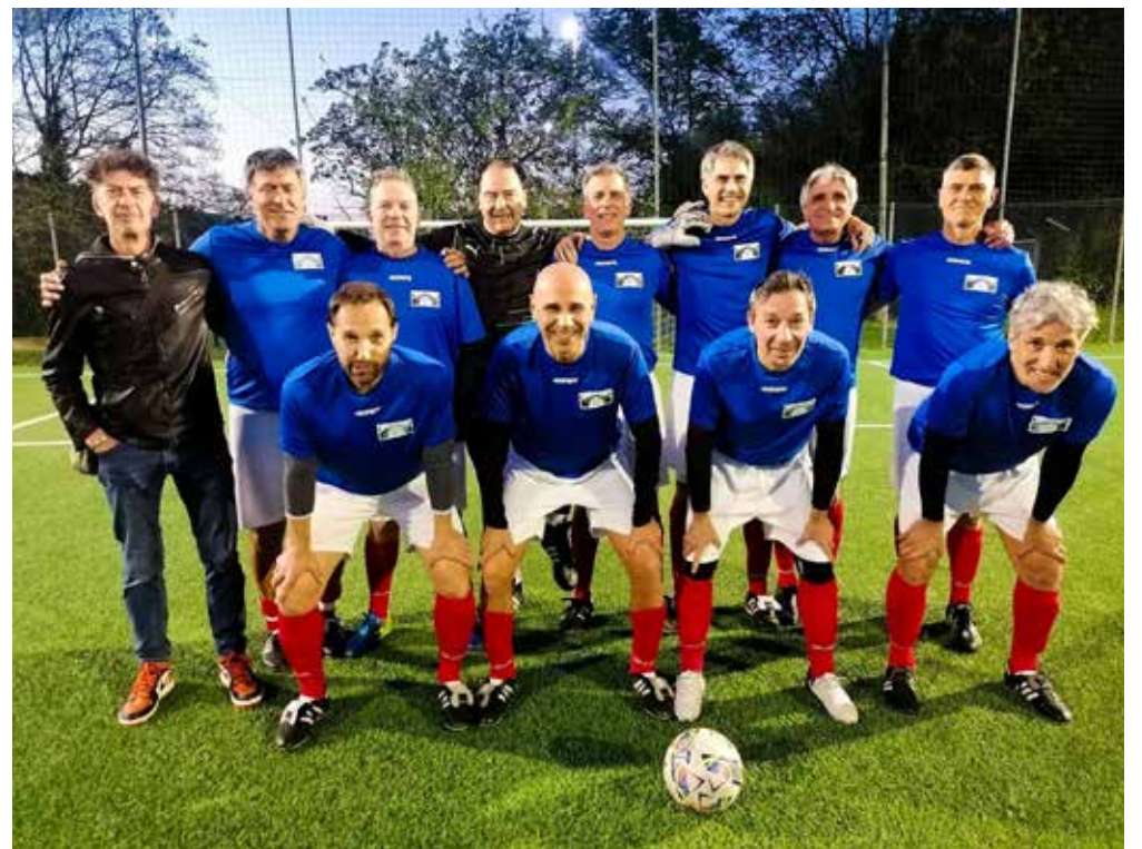
Il Buffet alla Palù, secondo nel torneo Veterani