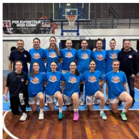
📷 Una formazione della Pallacanestro Interclub Muggia