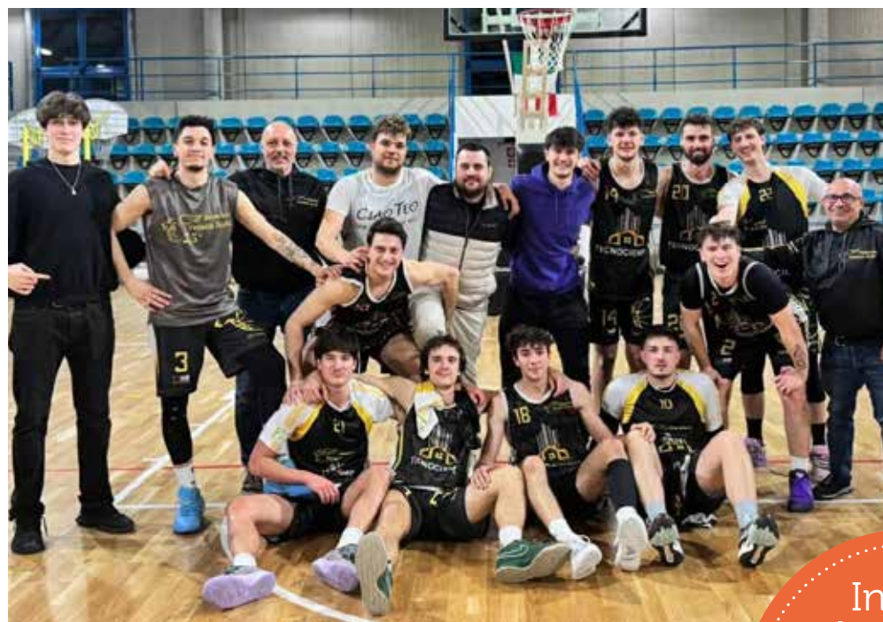
📷 La felicità del team della Tecnogiemme Venezia Giulia, corsara a Calvola sul San Vito