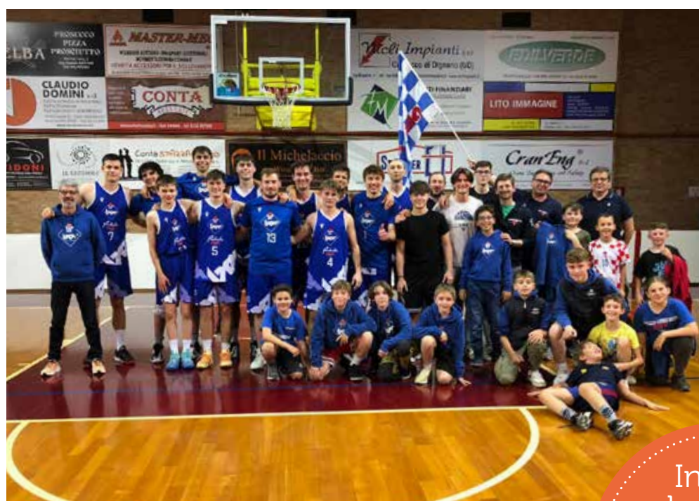
📷 Il Bor Radenska può festeggiare: sarà ancora serie C anche la prossima stagione PH Bor

In serie C, è salvezza per il Bor Radenska: il bis nella serie playout contro San Daniele vale la permanenza di categoria, dopo un campionato complicatissimo risolto con una seconda parte di stagione ad alti livelli, con il team di Krcalic a risalire dall'ultimo posto e a regalarsi poi la cavalcata vincente. Il netto 55-86 sul parquet