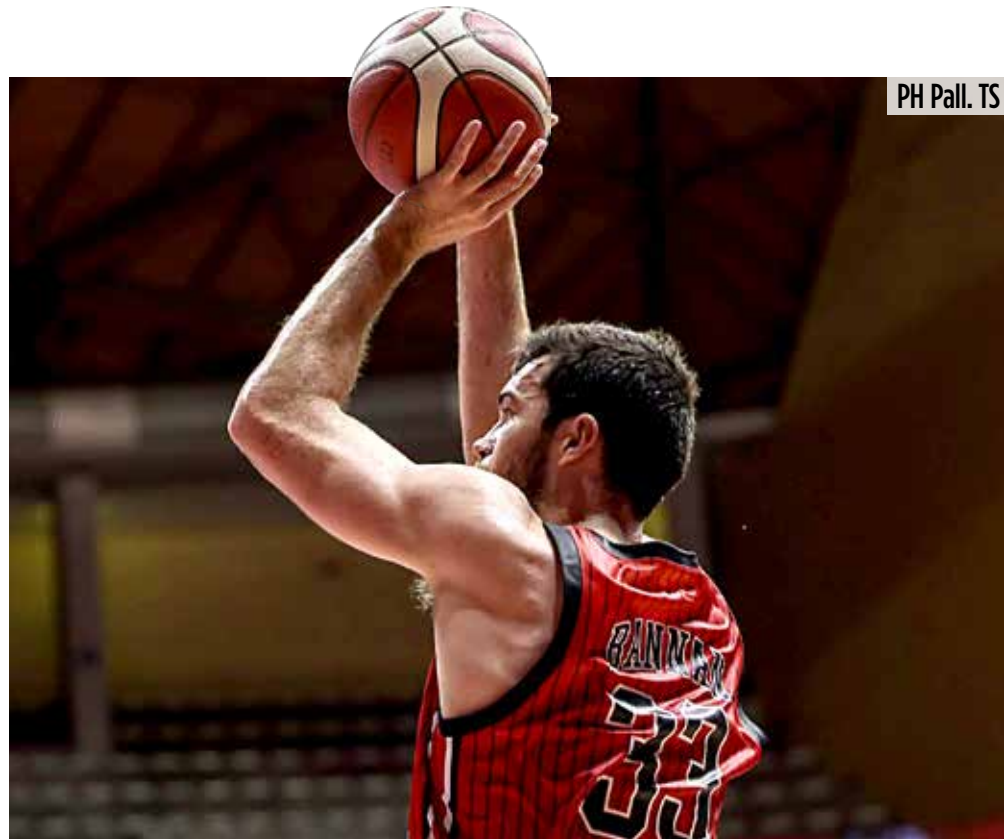
PH Pall. TS

Dalla Curva Nord un'indicazione chiara subito dopo l'inno: "Tutto questo non può finire!", con un clima già ben ovattato in un PalaTrieste che all'unanimità non le manda a dire al presidente federale Petrucci e alla FIP intera. Brescia parte meglio con il solito duo Bilan-Della Valle (2-8), Candussi pesca due triple dal cilindro per pareggiare i conti. L'acuto di Toscano-Anderson da tre regala il primo vantaggio intero (13-12 all'8') e i preziosi punti con tanti rimbalzi conquistati da Bannan. Finisce pari e patta il primo quarto (17-17). In un momento d'oro del duo Ramsey-"JTA" a confezionare il +5 al 14' (29-24) e con Brescia a rispondere con un Burnell tirato a lucido, c'è anche la bomba ignorante di Uthoff a spingere Trieste sino al 34-26 e più in generale una squadra che attacca e difende con gli occhi