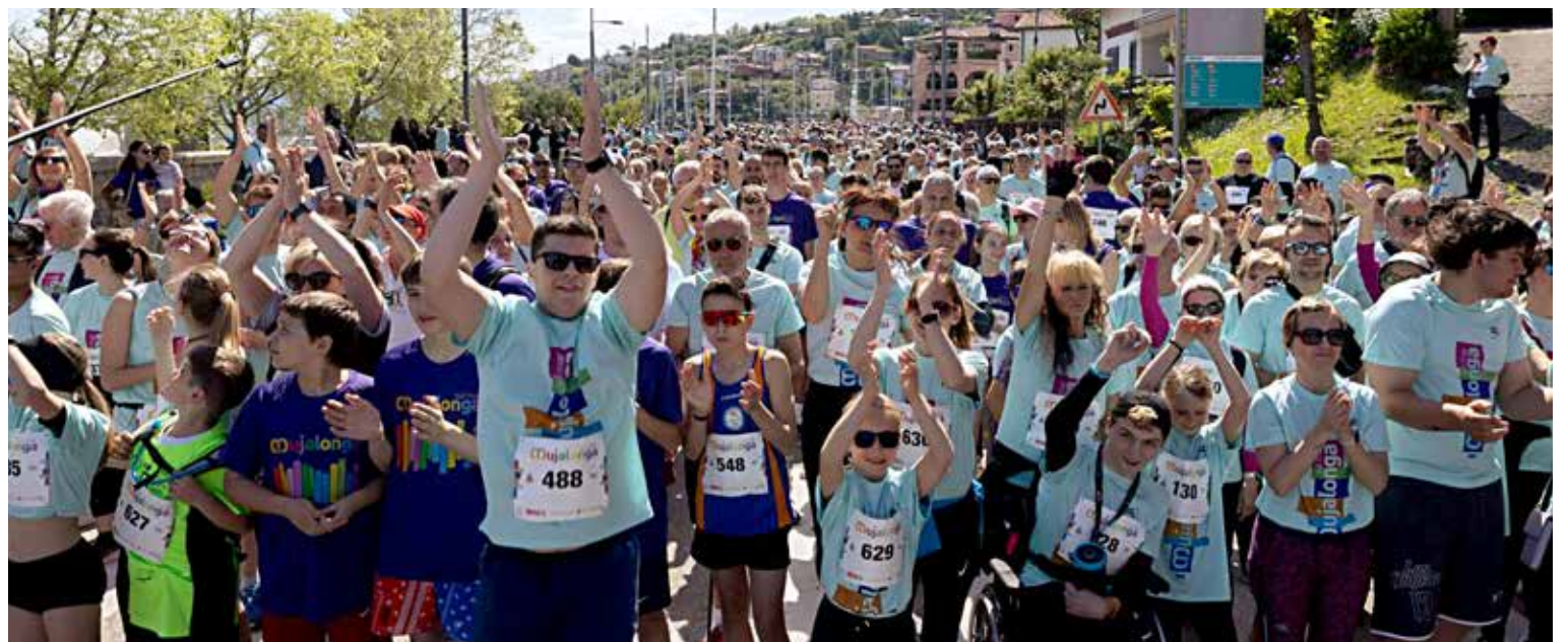
📷 Un'immagine dell'edizione 2025 della Mujalonga