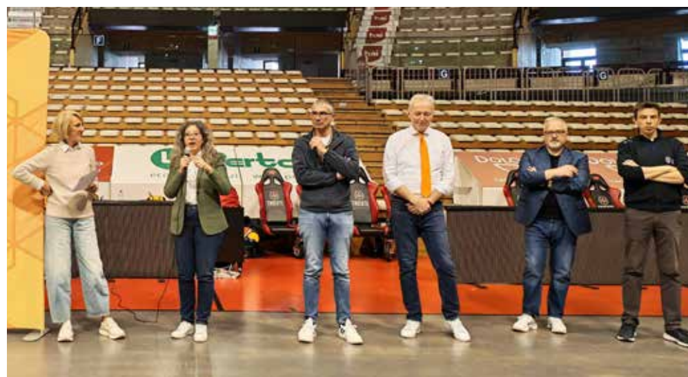
📷 Due momenti del secondo appuntamento di "Integralmente Sport", organizzato dall'Asd Calicanto Aps, svoltosi lunedì scorso al PalaTrieste

Un sasso nello stagno provoca onde concentriche; chissà se anche questo - citando Gianni Rodari - potrà indurre riflessioni e positive reazioni