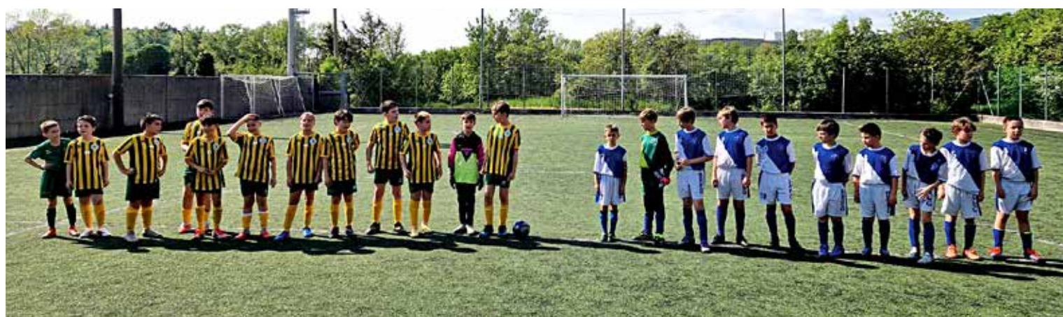
📷 Le squadre di Breg e Domio gialli sul campo di San Dorligo

Nel girone B, bella prestazione della Trieste Victory Academy C che si impone sui coetanei del San Luigi C per 1-4. I biancoverdi tengono botta nel primo parziale, riuscendo a strappare un buon pareggio, poi escono i lupetti. Bene anche la squadra B di Borgo San Sergio che la meglio sul Vesna. Nel match della domenica, i giallo