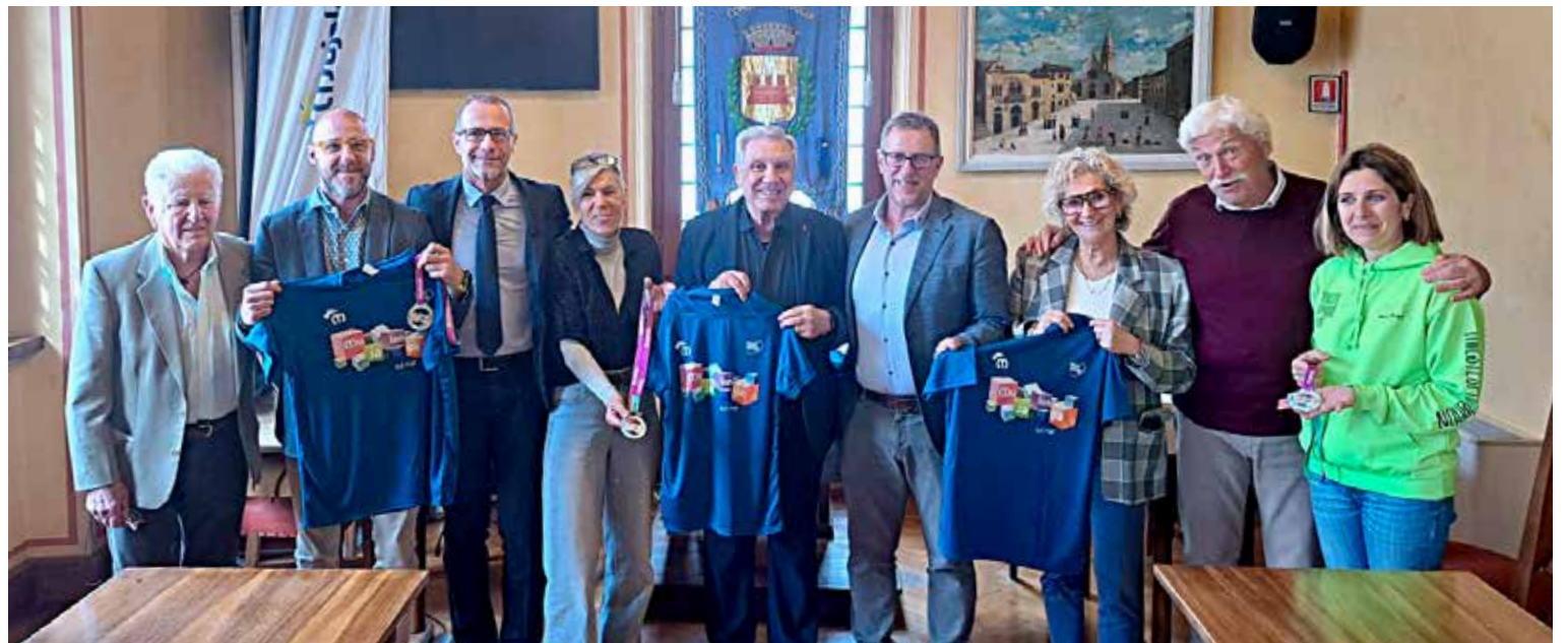
📷 Foto di gruppo lunedì scorso al termine della conferenza stampa nel Comune di Muggia

LA GARA DI MUGGIA Ma in questo 2026 da cifre tonde c'è un altro appuntamento da non perdere, organizzato dalle stesse realtà sopra menzionate, ed è quello con la Mujalonga sul Mar, la manifestazione podistica in programma domenica 26 aprile sul suolo rivierasco. Il conto alla rovescia per questo happening storico è ormai iniziato. Quella di quest'anno sarà la 23esima edizione di una kermesse che affascina sia per il proprio contenuto tecnico che per l'alta partecipazione e per gli scorci panoramici, essendo una delle poche corse su strada interamente affaccia-