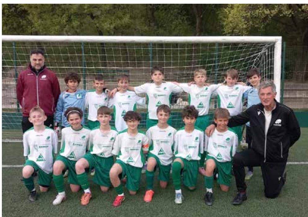
📷 La formazione del San Luigi C

Gruppo B che si apre con l'affermazione del Breg sul campo del Muggia: 3-2 finale che mette in evidenza la grande prestazione degli ospiti, riusciti a creare gran densità a centrocampo, così da bloccare in principio le offensive avversarie. Risultato pieno anche per l'Opicina C ai danni del San Giovanni A. I padroni di casa, pur andando sotto nel primo parziale, riescono a invertire la rotta della gara,