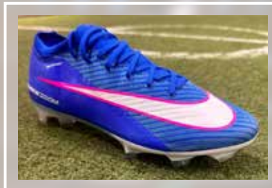
NIKE Zoom Vapor 16 Elite FG