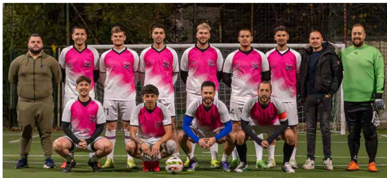
📷 Vittoria e salvezza per il Nuovo Bar Ispiro/Flamingosi

Da disputare Nistri - Charlie, decisiva per il titolo