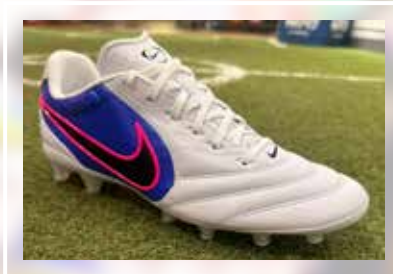
NIKE Tiempo Ligera Pro AG