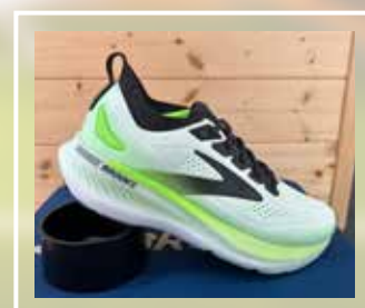
BROOKS Glycerin Gts 23 (asfalto, antipronazione)