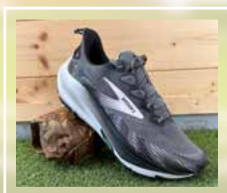
BROOKS Ghost Trail sterrato