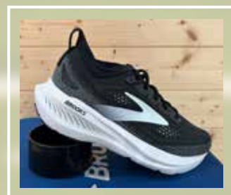
BROOKS Glycerin 23 (asfalto)

AMPIO MERCHANDISING DELLE SQUADRE DI CLUB OUTLET - SPECIALE PALLAVOLO ITALIA MASCHILE E FEMMINILE