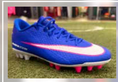
NIKE Zoom Vapor 16