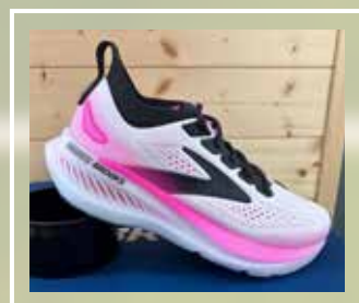
BROOKS Glycerin Gts (asfalto, antipronazione)