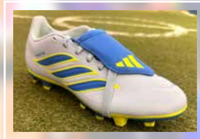
ADIDAS Predator Club FT FG/MG