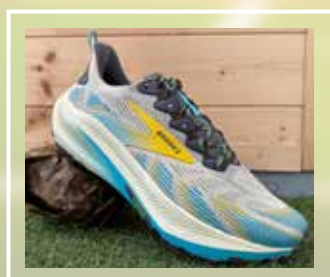
BROOKS Ghost Trail