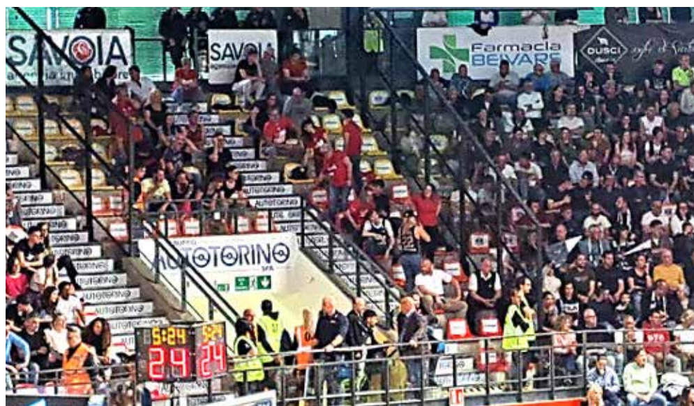
📷 I circa trentacinque tifosi triestini presenti ieri al Carnera per il derby

A lla fine contava una cosa sola: vincere. E questo sia per una questione di campanile che, soprattutto, per due punti fondamentali nella corsa ai play-off, considerando il calendario nelle prossime tre sfide con Brescia in casa, Bologna e Milano in trasferta. E il successo è arrivato, e ben più agevolmente del previsto, con tre quarti (dal secondo in poi) in cui i biancorossi hanno fatto ciò che volevano. Non è stato, però, e questo spiace, il solito derby della rivalità regionale. L'assenza del tifo organizzato triestino ha infatti depotenziato l'atmosfera del solito carico di energia. Dal capoluogo giuliano sono comunque arrivati una trentina abbondante di supporter ma la Curva Nord è