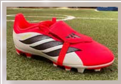
ADIDAS Predator Club FT FG/MG Junior