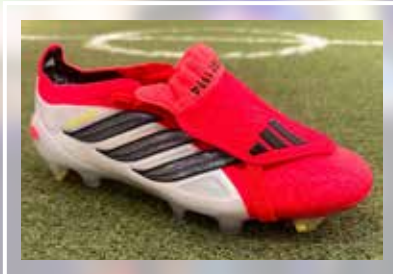
ADIDAS Predator Elite FT FG