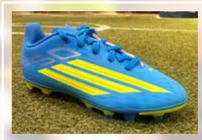
ADIDAS F50 Club FG/MG Junior