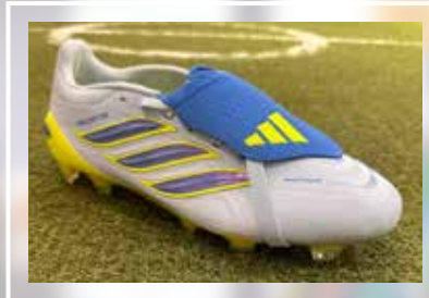
ADIDAS Predator Pro FT FG