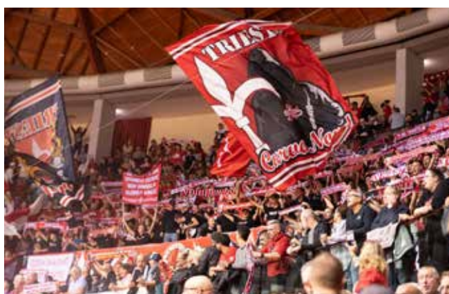
📷 Domani, a Torino, si prospetta un derby con Udine ma solo sugli spalti...

S i muove la Curva Nord, e non potrebbe essere altrimenti, considerando la vicinanza sempre più stretta che il gruppo del tifo più caldo sta dimostrando in questa stagione verso i propri beniamini. La prevendita per la sfida di domani contro Milano è partita a metà della scorsa settimana e pur non avendo i dati ufficiali, al momento di chiudere il nostro inserto, su quanti saranno i supporter alabardati in Piemonte, siamo sicuri che non faranno mancare il proprio calore. Certo, la distanza, l'orario e il giorno non aiutano: una trasferta in giornata significa ripartire da Torino alle 11 di sera e rientrare in città all'alba per poi andare a lavorare, per chi non avrà la possibilità di prendersi una giornata di ferie. Chi invece potrà, rimarrà sotto la Mole a godersi, forse, anche il resto delle Final Eight. Il supporto, come detto, in questa stagione è stato costante, in casa e in trasferta. Basti pensare ai grandi numeri fatti regi-