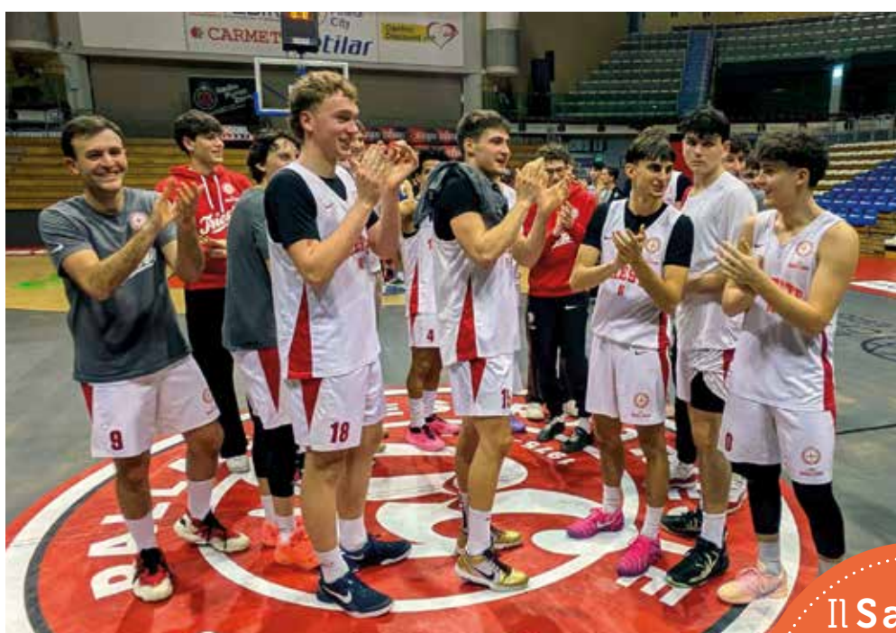
Il baskeTrieste festeggia il netto successo contro Fagagna