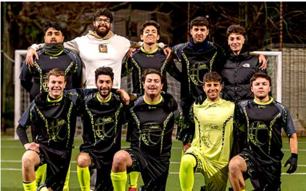
La squadra del Cral Trieste Trasporti, impegnata in Serie B