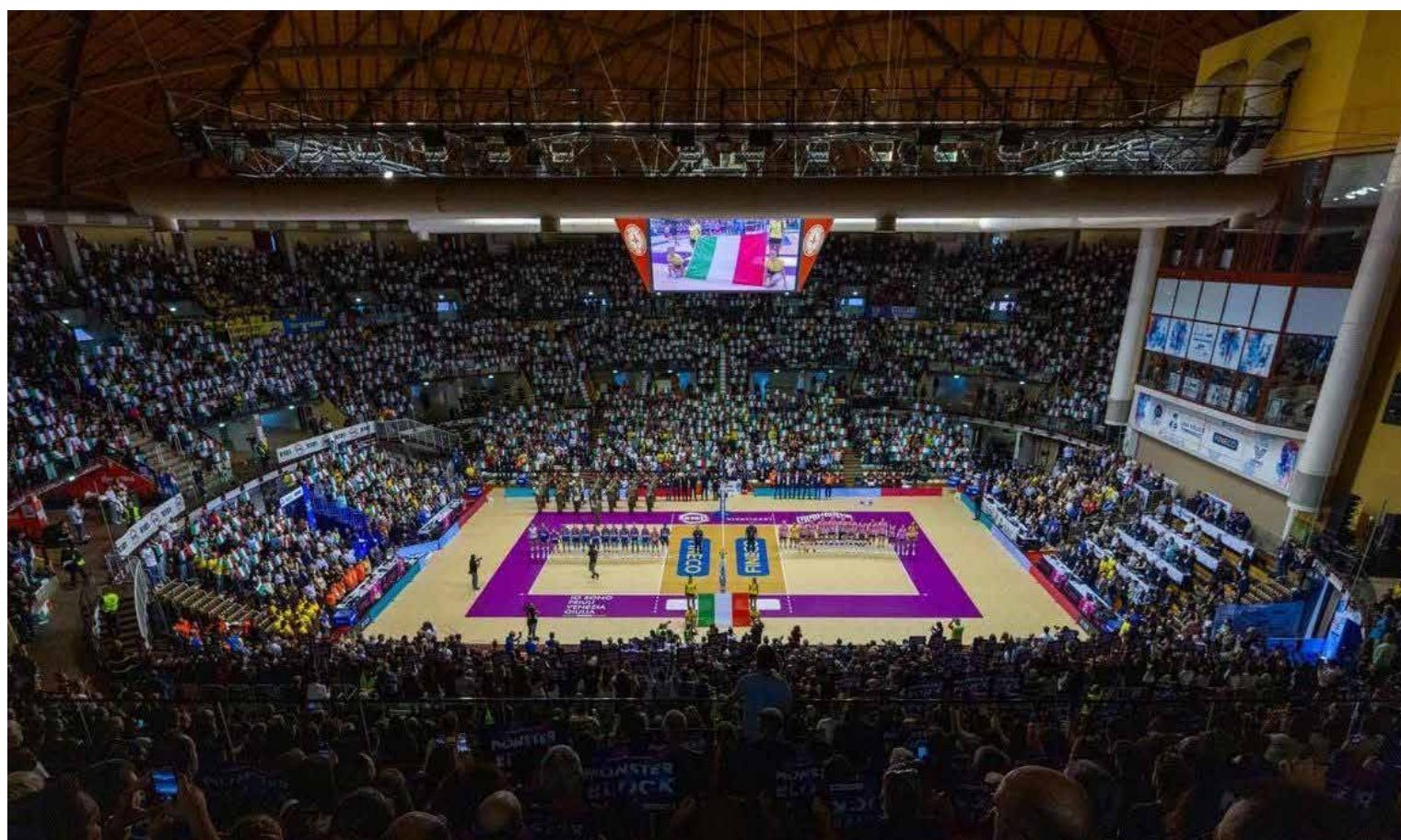
📷 Dopo la Supercoppa femminile di ottobre scorso, un altro grande appuntamento (stavolta al maschile) al PalaTrieste

Itas Trentino, Cucine Lube Civitanova, Sir Scusa Sai Perugia e Rana Verona saranno le protagoniste di uno spettacolo sportivo incorniciato all'interno di un evento ricco di entusiasmo, musica e sano coinvolgimento, dove si potrà godere del veder giocare tanti atleti tra i migliori del panorama internazionale, dal capitano azzurro Simone Giannelli all'Mvp degli ultimi Mondiali Alessandro Michielletto, insieme a molti altri. Per tre dei quattro team sarà anche una sorta di return match, dopo la Coppa Italia andata in scena a Bologna nell'ultimo fine settimana, e per Trieste sarà la terza occasione di ospitare una finale di Supercoppa italiana maschile, dopo le edizioni del 1999 e del 2007. L'entusiasmo degli appassionati è febbrile, e i motori sono già pronti e caldi nel lavorare per la migliore riuscita dell'evento e confermare l'efficacia della macchina