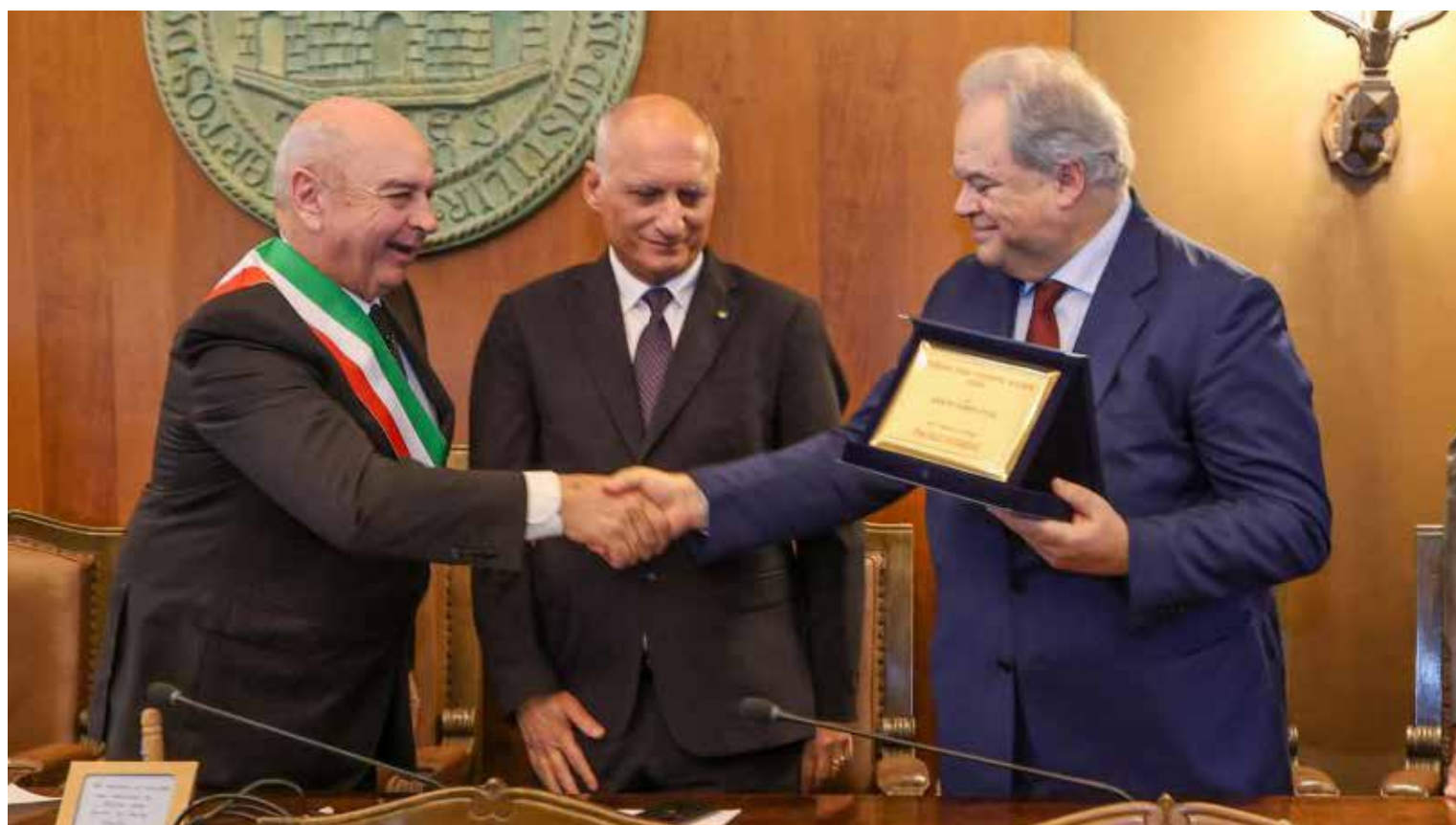
📷 Il giornalista triestino Paolo Condò è stato insignito della targa speciale del San Giusto d'Oro a dicembre scorso

«Noi a Trieste abbiamo numerose cose di altissimo livello che attirano evidentemente i capitali in maniera più semplice. Vivendo da sempre nel mondo del calcio, so benissimo che è un ambiente più pericoloso di altri e si pos-