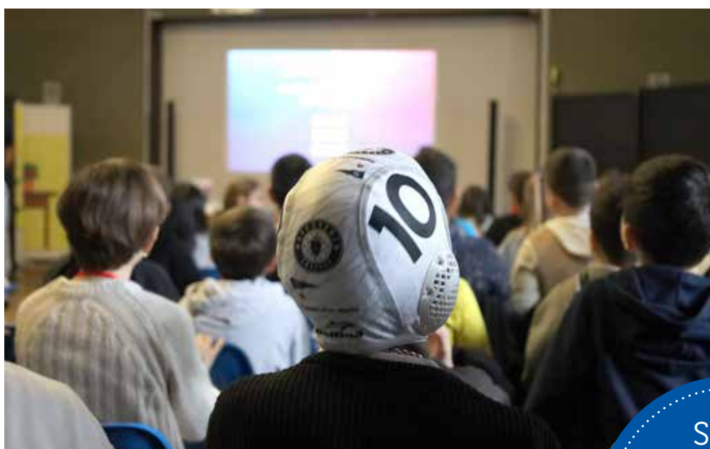
📷 "#OndaCheUnisce - La mia idea di squadra" sta riscuotendo un particolare successo negli istituti locali

Nel suo complesso, il progetto "#OndaCheUnisce - La mia idea di squadra" prevede tre fasi. In questo primo frangente gli atleti delle squadre di serie A1 maschile e serie A1 femminile hanno infatti condiviso la loro esperienza di sportivi professionisti con ben 375 giovani studenti di 6 diversi istituti: "De Amicis" e "Zamola" di Muggia, "Loretta" di Aquilinia, "Collegio Nobili Dimesse" di via Pendice Scoglietto, "Morpurgo" di Campi Elisi e "Duca D'Aosta" di San Giacomo. Una serie di confronti divertenti e appassionati, propedeutici per i bambini che poi assisteranno