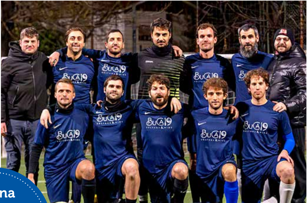
La squadra del Ristorante Buca 19, sconfitta di misura dalla capolista Pizza Smile