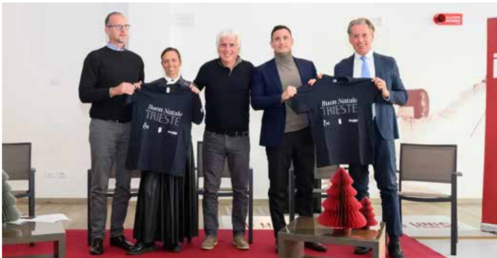
Un'istantanea della conferenza stampa della kermesse

È tutto pronto per la quarta edizione di "Buon Natale Trieste", manifestazione sportiva a scopo benefico che si svolgerà nella vasca tuffi della piscina "Bruno Bianchi" oggi pomeriggio con inizio ore 17.30 (ingresso gratuito), coinvolgendo sei società cittadine: Pallanuoto Trieste, Triestina Nuoto Samer & Co. Shipping, Futurosa, San Luigi Calcio, Venjulia Rugby Trieste e Fast and Furio Sailing Team - che formeranno tre squadre miste (maschile e femminile) che si sfideranno in bre-