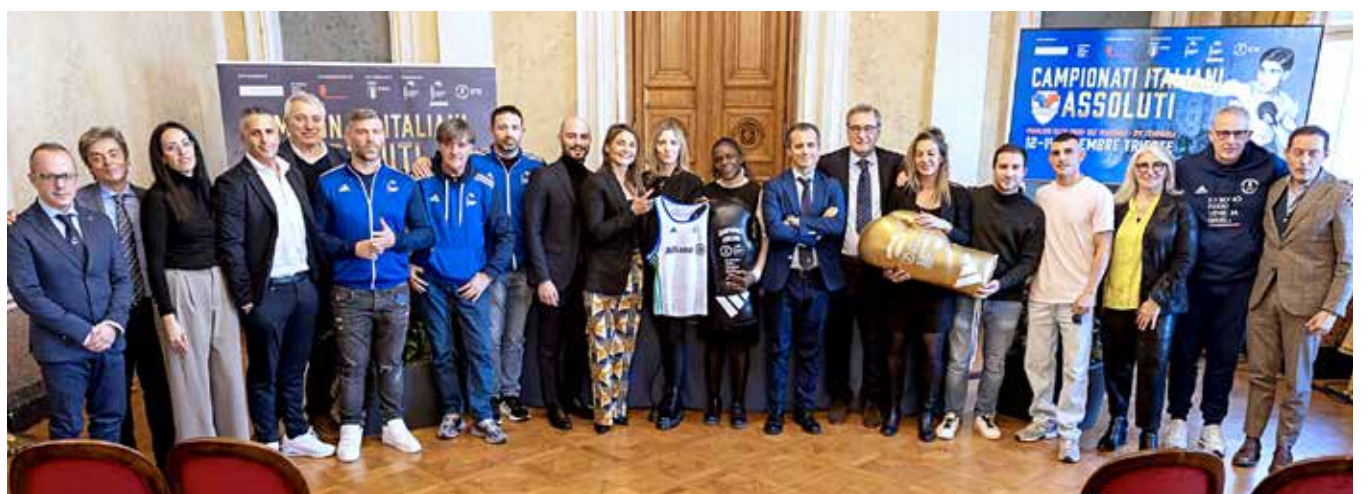
📷 La presentazione della rassegna che si è tenuta nel salone di rappresentanza della Regione FVG