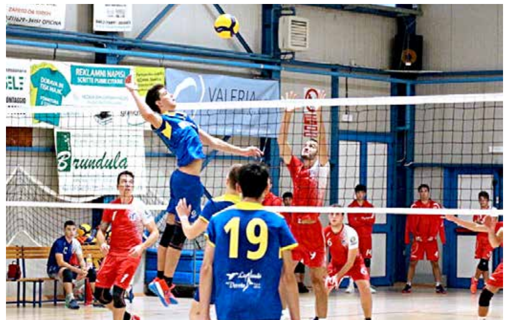
Il Soca in attacco, vittorioso nel match di sabato pomeriggio per 3-1 in quel di Monrupino contro i biancorossi dello Sloga Tabor

TRE MERLI - PORDENONE 3-1 (25-19; 19-25; 25-15; 25-23)