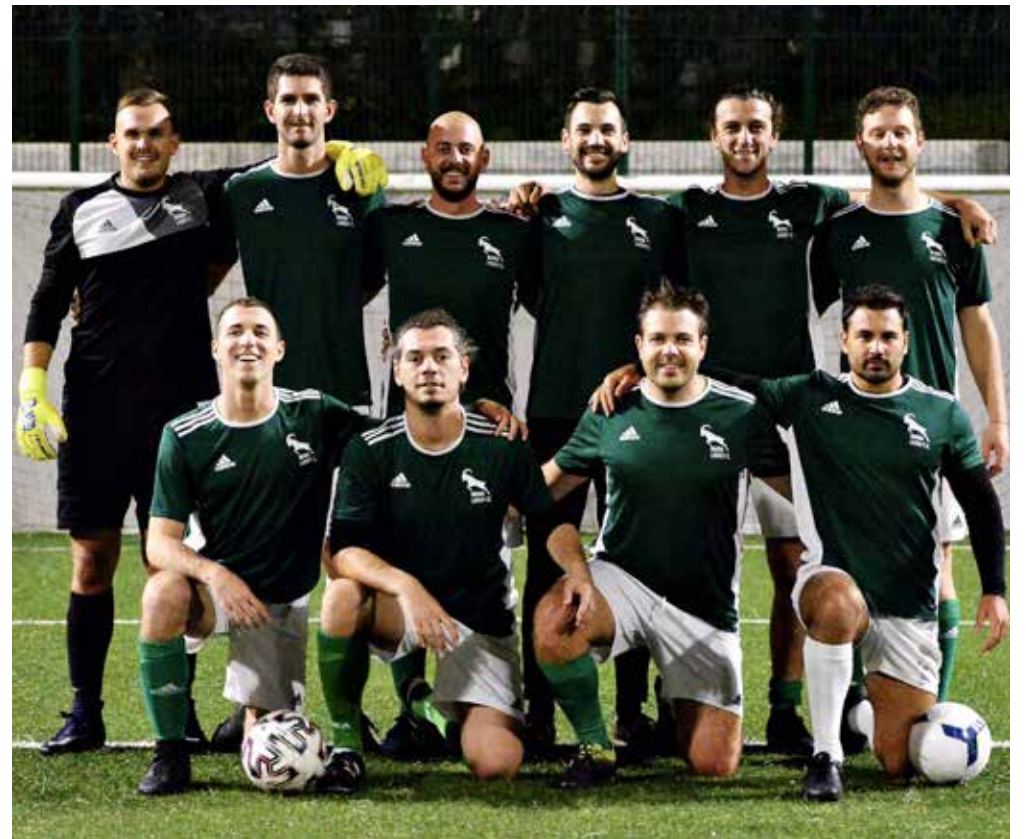
📷 La Banda Lasko, seconda in classifica in Serie A

L a Banda Lasko vince il big match con il Nistri (7-1) e risponde alla capolista Bar G (4-3 al Corte Cafè) e al Termodrim (10-2 al Beat), con cui condivide il secondo posto. Bene anche Samo Jako (4-3 al Charlie) e Terzo Tempo (5-3 all'Allianz). In Serie B, pari tra Bar Latteria Lol e Antica Barberia Napoletana (6-6), mentre l'Officine Barnobi batte 6-4 la Pizza Smile e si prende la seconda piazza. Tre punti per il Petes (5-2 al Tokai Selvadigo), 3-3 tra Minimo Sforzo e Astrea.