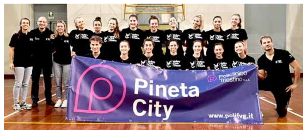
Le bianconere dell'Antica Sartoria di coach Stefini, costrette al ko al tie-break dal Buia per 15-17 dopo esser state sotto per 0-2

Classifica: Rojalkennedy e Pordenone 12, Zalet 10, Fagagna 9, Buia 8, Latisana 7, Martignacco 6, Porcia 5, Portogruaro 4, Tarcento, Spilimbergo e Stella 3, Antica Sartoria 2, Evs 0