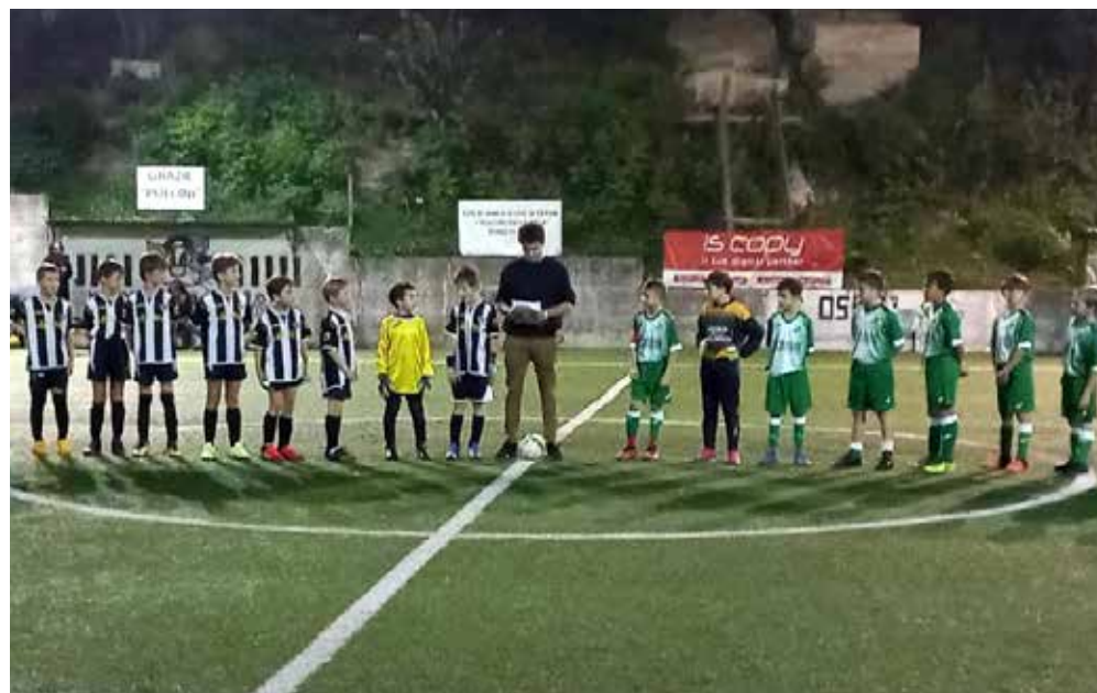
📷 Roianese D e San Luigi C schierati prima dell'incontro

Nel girone B finiscono in parità i tempi tra Roianese C e Zarja, ma i giochi tecnici fanno pendere la bilancia verso i bianconeri. I carsolini erano reduci dal successo per 3-1 sull'Academy B. Bella partita tra Altura A e Sant'Andrea B, vinta dalla squadra di via Suppan che si impone in due tempi, mentre la frazione centrale e i giochi tecnici terminano in parità. L'Opicina A si impone 3-1 sull'Academy B: gara equilibrata, con tre successi dei padroni di casa prima del riscatto ospite nell'ultima frazione. Il San Luigi B ha la meglio sul