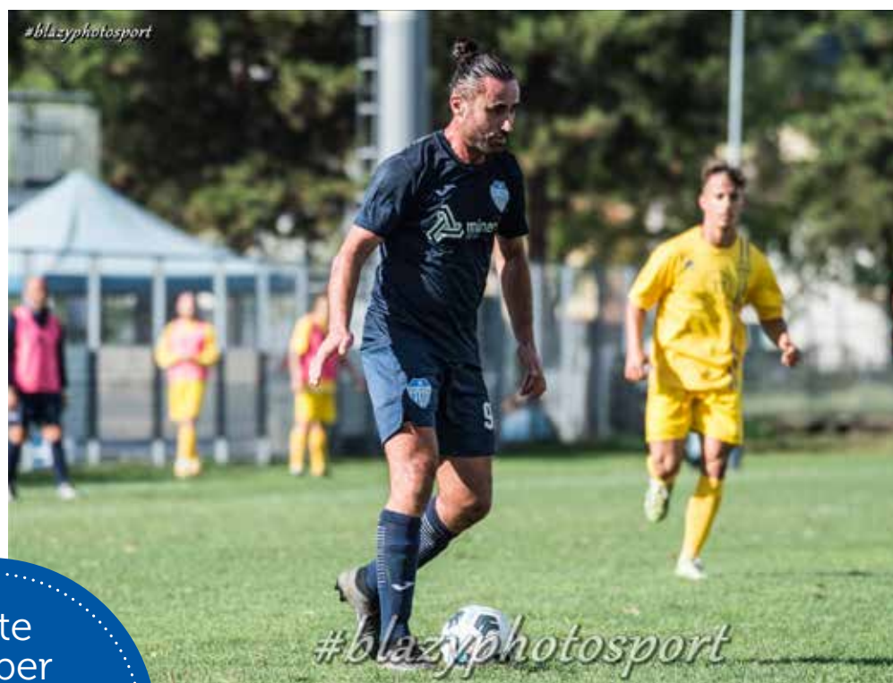
Una fase del match tra Pro Gorizia e Chiarbola

Sette reti per la Roianese Mdb, Vesna e Opicina di forza