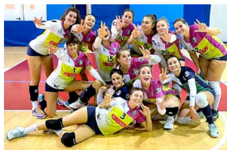
📷 Sopra, una istantanea del derby della Triestina Volley tra l'Excalibur e la Tre Merli. A lato, l'Is Copy felice dopo il successo di martedì sera sul campo del Sokol per 3-1

SOKOL - IS COPY 1-3 (25-21; 20-25; 22-25; 22-25)