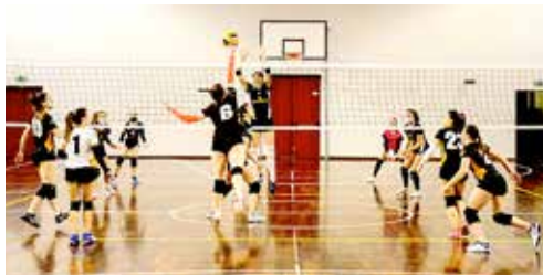
Un'istantanea della sfida tra le ragazze dell'Olympia Trieste (in nero/arancio davanti) e la Virtus Trieste

vittorie consecutive e ben zero set persi. Per le bianconere, ultimo trionfo il 3-0 rifilato all'Azzurra Mossa. Al secondo posto, a quota 11, sale il Sokol di coach Berlot. Terza piazza finale per l'Olympia Trieste che, grazie al successo sulla Virtus per 3-0, chiude il girone con tre vittorie in cinque sfide. A completare la graduatoria, la Virtus di Seppi a quota 5, l'Azzurra Mossa con soli due punti conquistati e Le Volpi, ferme a zero punti anche dopo l'ultima sfida disputata e persa per 3-0. (M.V.)