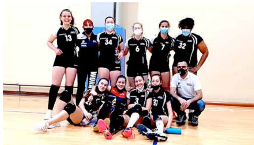
Il gruppo dello Staranzano che ha conquistato il pass per le finali con 9 vittorie in 10 partite

RONCHI - TURRIACO 3-0 (25-19; 25-23; 25-14) BCC STARANZANO - PIERIS 3-0 (25-12; 25-17; 25-17) BCC STARANZANO - TURRIACO 3-0 (25-6; 25-11; 25-10)