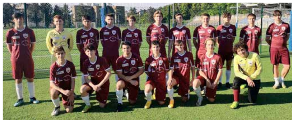
📷 Bella ma tardiva la reazione del Muglia contro la Victory