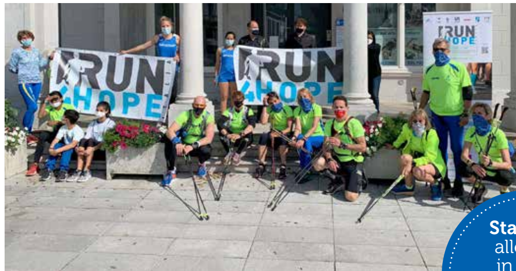
☑ Sopra, alcuni partecipanti all'iniziativa di Hope4Run, che ha coinvolto tutte le regioni italiane. Sotto, un'immagine della Corsa del Ricordo degli anni scorsi