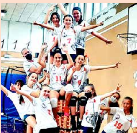
Lo Sloga Tabor, al secondo successo di fila in questa stagione

➔ Vittoria, primo posto in solitaria e vetta quasi in ghiaccio per il Ronchi di coach Marchesich che, con la vittoria di misura per 2-1 di domenica mattina sul parquet di Prosecco, stende il Kontovel e ipotizza la prima piazza del girone A. Dietro alle "arancio" isontine, a quota 13 punti sale proprio il Kontovel, a punti anche settimana col bel 3-0 maturato nel derby d'altipiano col Sokol. A chiudere il tris di sfide, la vittoria in rimonta delle bianconesse del Sokol, vincenti 2-1 sull'Azzurra. Battaglia e sostanziale equilibrio anche nel girone B, con una grande bagarre dalla terza posizione in giù. Dietro infatti alle due di testa Evs e Centro Coselli, entrambe vittoriose nei rispettivi