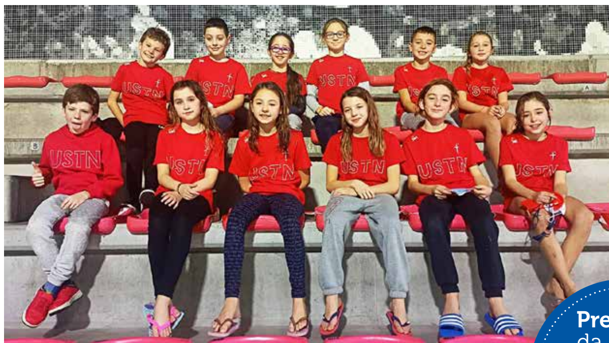
Foto di gruppo per i giovani atleti degli Esordienti B della Triestina Nuoto