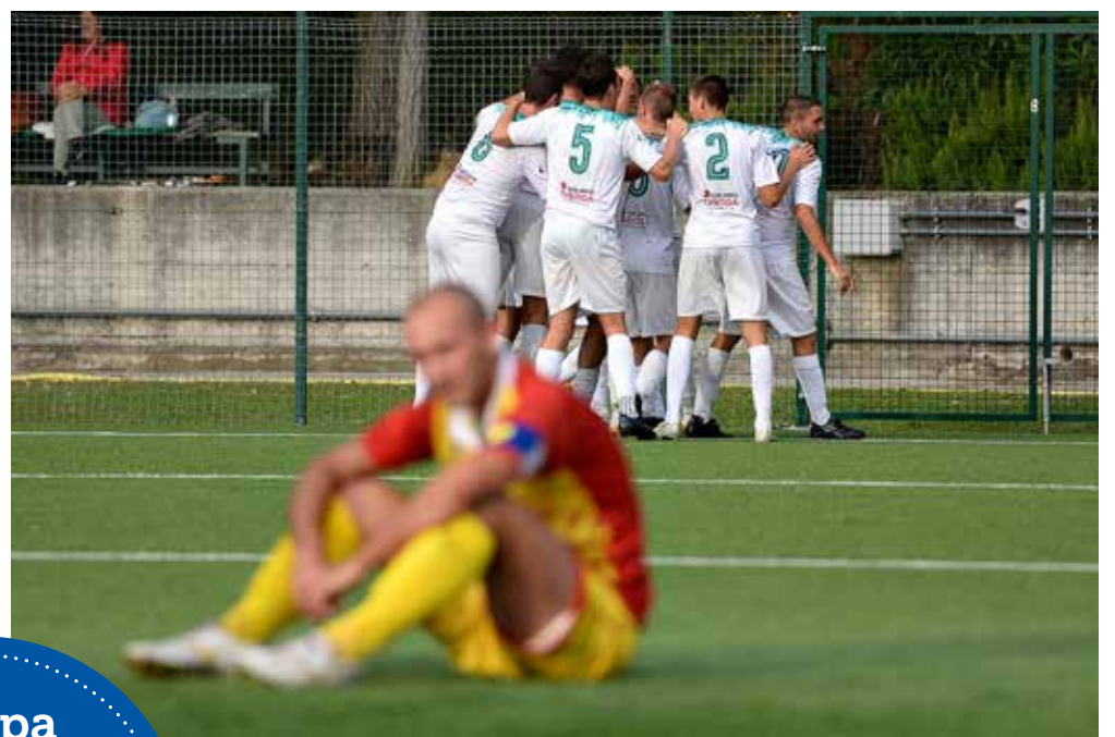
📷 Sabato Zaule e San Luigi si affronteranno nella prima giornata di ritorno

L' Eccellenza torna in campo nel prossimo fine settimana, per gli altri campionati bisognerà aspettare il 20 febbraio. La pausa invernale si è prolungata, ma stavolta quantomeno con una prospettiva di ripresa in tempi relativamente brevi e certi (sono ammessi gesti scaramantici...), come stabilito lunedì dal Comitato Lnd del Friuli Venezia Giulia. Il principale torneo regionale scalda già i motori, visto che domenica prossima si gioca, con l'antipasto al sabato del derby tra Zaule Rabuiese e San Luigi. La prima giornata di ritorno prevede anche un'altra sfida tutta triestina, quella tra Primorec e Sistiana, mentre Chiarbola Ponziana e Kras Repen se la vedranno tra le mura amiche rispettivamente con Ronchi e Torviscosa. Il rinnovato calendario non prevede turni infrasettimanali in Eccellenza: semplicemente le tre settimane di ritardo porteranno a chiudere i due gironi il 16 aprile e non il 27 marzo, come inizialmente previsto. Situazione sostanzialmente analoga anche dalla Promozione in giù, con i tornei che proseguiranno fino alla fine di maggio; per quanto riguarda i sedicesimi di finale della Coppa Regione di Seconda