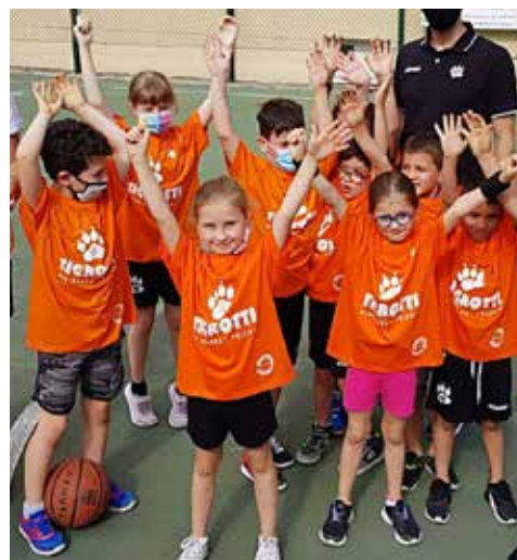
📷 Una squadra di minibasket dei Tigrotti

si prospettava nuovamente difficile. Ci siamo risentiti negli ultimi giorni e ad oggi, per la ripresa dei vari campionati, abbiamo circa 35 squadre che hanno risposto all'appello e che comprendono due fasce di Aquilotti, 2011 e 2012, nonché la categoria Esordienti. Partiremo a inizio marzo con le prime due, suddividendo l'annata 2011 in un girone unico a 9 squadre e quella 2012 con due gironi da 6: a breve avremo qualche novità anche sul fronte Esordienti, ad ogni