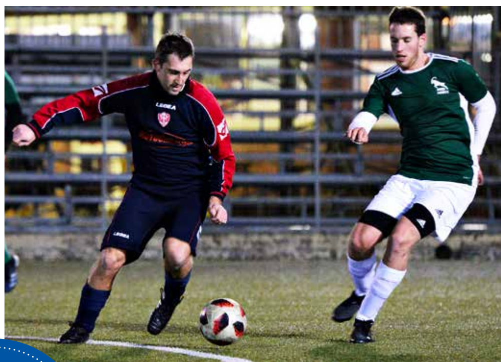
Un momento della gara tra Banda Lasko e Moto Charlie