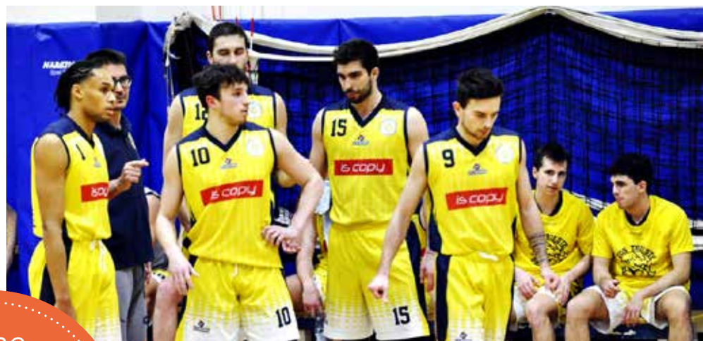
L'IS Copy Cus che si è imposto sabato scorso in casa contro il New Basket San Donà