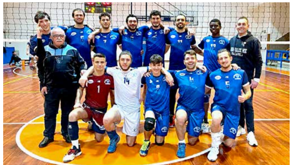
Prova di carattere per la Fincantieri, vittoriosa sabato sulla Tre Merli al tie-break

a quota 19. Si ferma invece a Pordenone l'Eurovolley, arresasi con la compagine di casa per 3-0.