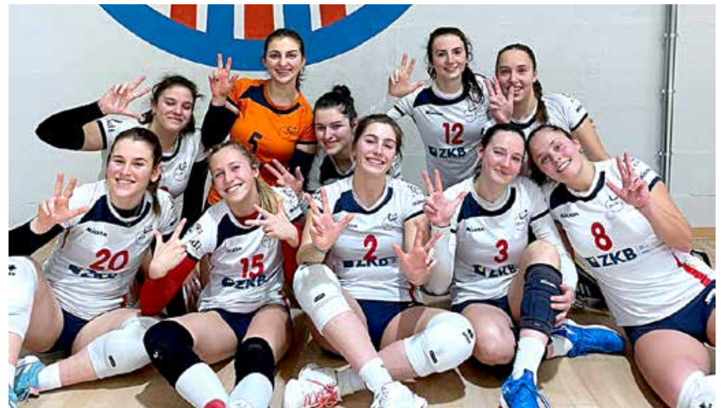
Lo Zalet, al primo successo in questo 2023, col bel 3-0 al Portogruaro