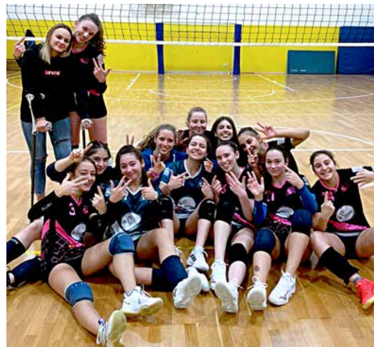
📷 Lo Swan Volley, sconfitto ieri pomeriggio per 3-1 dal Sokol, dopo l'illusorio vantaggio sul 25-2

T urno numero undici per il campionato di U18 femminile. Nel girone A, vittoria netta per la Virtus, passata agilmente per 3-0 sullo Staranzano. Tre punti anche per Dvigala e Ronchi, sempre vicine in classifica, a segno rispettivamente su Altura e Mossa per 3-0. Nel girone B, è allungo Farravolo, vincente 3-1 nel big match col Volley Club. Tre punti anche per Mavrica e Sokol su Pieris e Swan. In U16 invece, ben otto le gare finite col 3-0 su nove disputate. Nel tabellone A, poker di successi netti, con Evs, Soca, Torriana e Azzurra Terra, vincenti su Rdr, Ronchi, Poggi e Bor. Nel B, unico 3-1 della settimana, firmato dal Coselli, vincente a Turriaco. Tutto semplice per lo Dvigala, nel derby col Kontovel. Due le sfide infine valide per la classifica del girone C, con la Fincantieri vittoriosa sabato sul Grado, e con il Farravo-