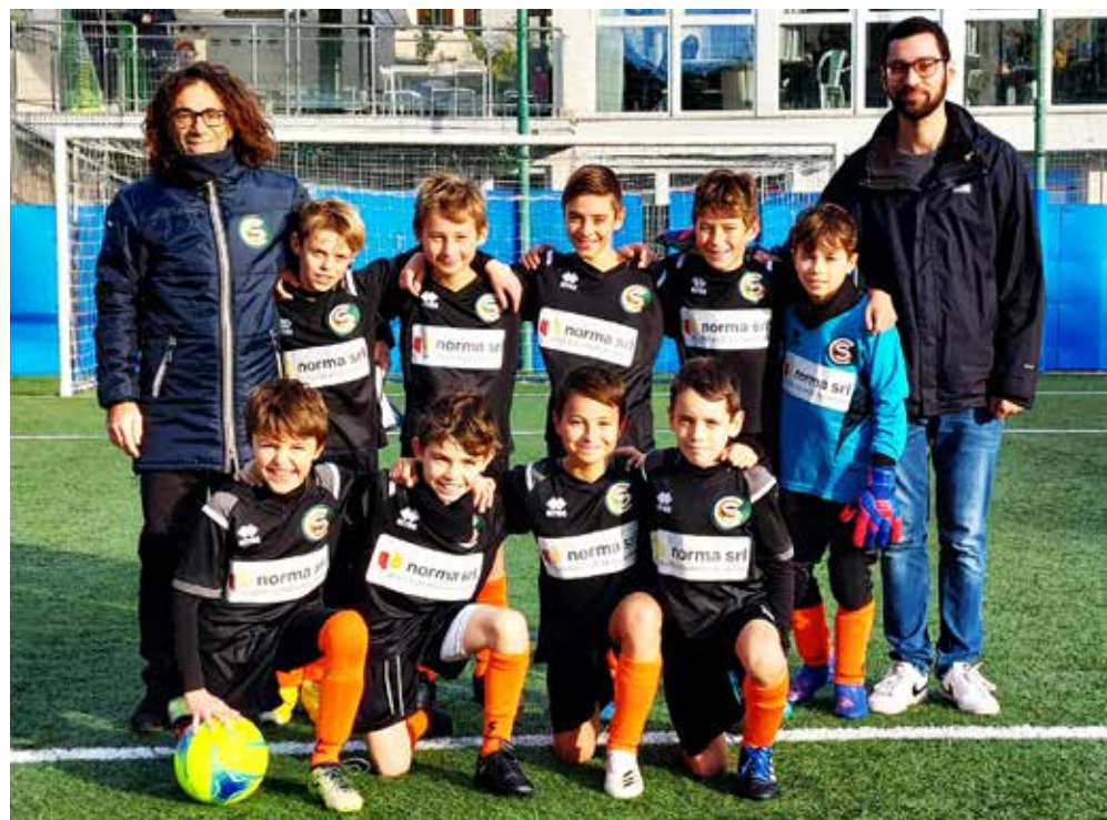
📷 La formazione del Cgs A

Nel girone B, "x" tra San Luigi B e Altura A, con gli ospiti che nel secondo tempo recuperano il passivo dei giochi tecnici; 1-1 nel primo e terzo periodo. I primi due tempi regalano al San Giovanni A la vittoria sull'Academy B, che si consola con il terzo parziale. Bella partita tra Kras e Opicina A, vinta dai biancorossi grazie ai successi nel primo e terzo tempo; pari giochi e seconda frazione, quarto pe-