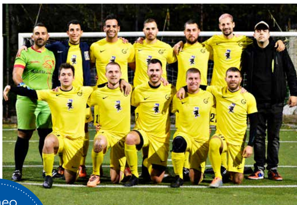
📷 Il Bar G, vittorioso con il Moto Charlie e primo in Serie A

B anda Lasko e Bar G rimangono insieme al comando. Tutt'altro che facile il testa-coda per la Banda, che si impone 4-3, mentre i baristi non hanno problemi a superare 9-1 il Moto Charlie. Il Bar Terzo Tempo porta a casa i tre punti, battendo 5-4 il Beat, e altrettanto fa il Circolo Allianz, che ha la meglio sul Corte Cafè per 6-1. In Serie B, pareggio 2-2 nel big match tra Antica Barberia Napoletana e Officine Barnobi, squadra seconda in classifica. Ne approfitta il Bar Latteria Lol, che ha la meglio su un combattivo Atletico Minimo Sforzo (7-4) e prende ulteriore margine in vetta alla graduatoria. Bene il Civico Sei, che sale al terzo posto grazie all'8-3 sulla Pizza Smile, e tre punti anche per l'Astrea che rifila un tennistico 6-0 al Petes.