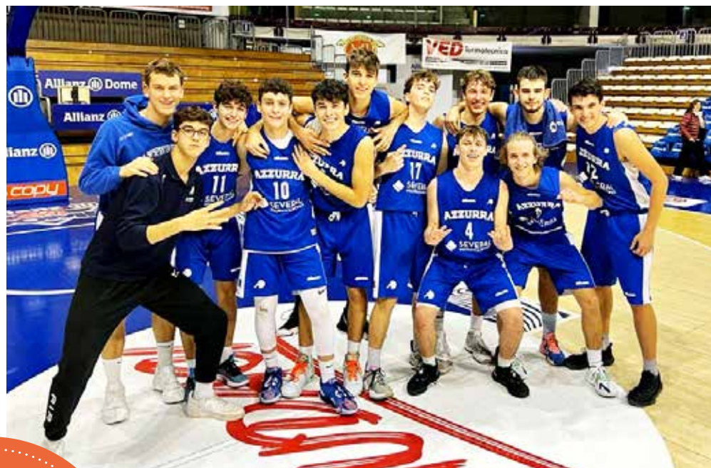
📷 La gioia dei ragazzi dell'Azzurra Several Insurance Broker, vittoriosa venerdì sera all'Allianz Dome contro il Dom Gorizia