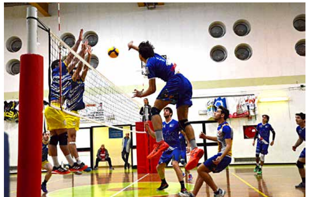
📷 Uno scatto di gioco del derby triestino fra Tre Merli e CUS Trieste