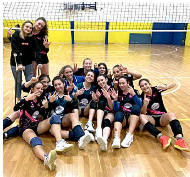
📷 La Tre Merli, vincente al "Galilei" in under 18 per 3-1 sul Pieris contro i biancorossi dello Sloga Tabor

Classifica U18 B: Farravolo e Volley Club 9, Mavrica e Sokol 6, Pieris 5, Swan 4,