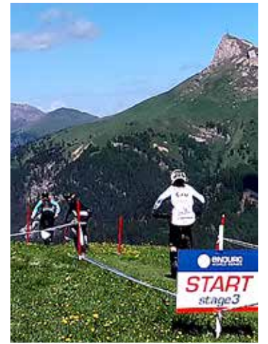
Un'immagine del circuito "Enduro World Series" svoltosi nella settimana appena trascorsa a Canazei, perla delle Dolomiti in Val di Fassa

internazionale i giovani rider triestini si sono trasferiti direttamente all'Abetone, nell'Appennino toscano (in provincia di Pistoia), per il Campionato Italiano di specialità. Un'altra prova impegnativa e di prestigio per una compagine giuliana che in questi anni ha continuato a crescere e che si sta imponendo come una realtà importante in questa disciplina dal forte appeal agonistico, adrenalinico e di grandissimo impatto spettacolare.