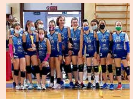
L'Eurovolleyschool classificata vice campione regionale dopo le "finals"

Classifica: Fox Volley 8, Sloga Tabor 3, Chei De Vilalte 0