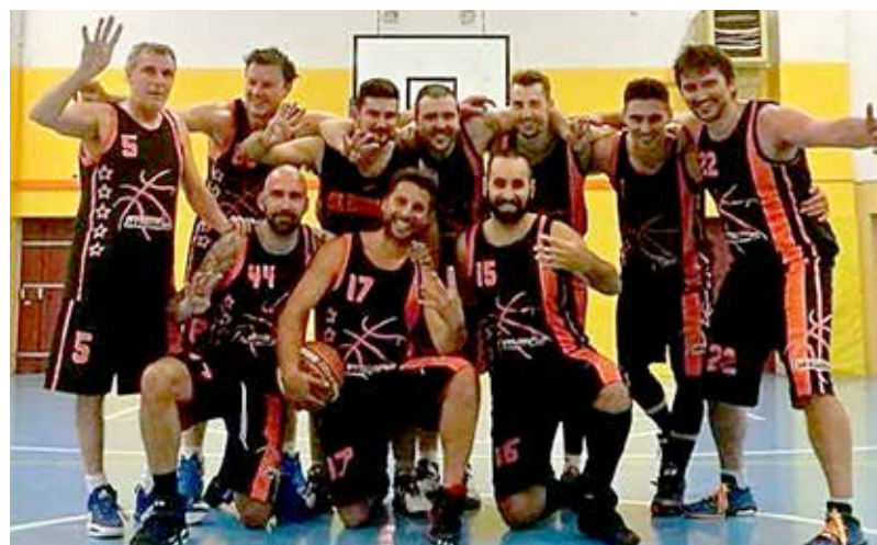
La squadra di pallacanestro targata Spazzidea

«Il periodo Covid è stato molto duro per tutti, inutile negarlo. Tuttavia, ad essere onesto, le nostre attività