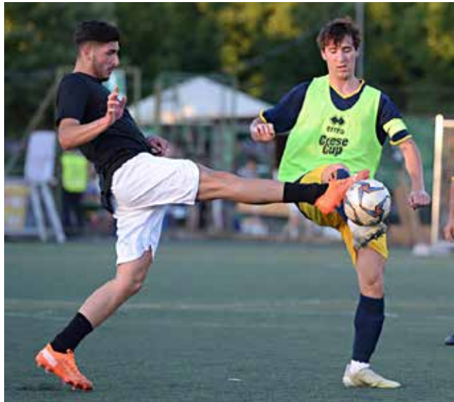
Home Saponi di Casa e Quadrifoglio Immobiliare hanno aperto la diciannovesima edizione della Crese Cup, quest'anno di scena al "Barut" di Domio