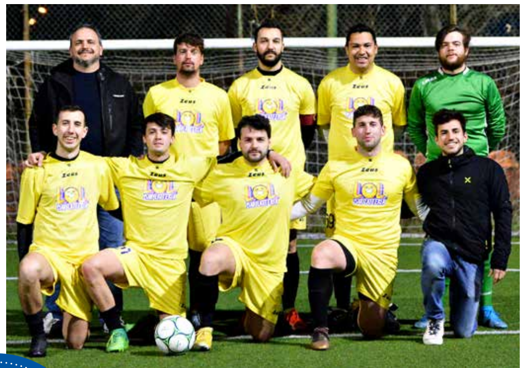
📷 Il Bar Latteria Lol, vittorioso all'esordio con il Barnobi

P rima giornata del campionato primaverile e conferma per i campioni in carica del Termodrim, che battono 6-2 la Banda Lasko. Tre punti anche per Lol e Abbigliamento Nistri, vittoriosi entrambi per 4-3 contro Barnobi e Moto Charlie; pareggio 6-6 fra Terzo Tempo e Circolo Allianz. In Serie B, tutto facile per la Pizza Smile con il Petes (19-1), vincono Civico Sei (4-1 al Vuk Karadzic) e Beat (4-2 all'Antica Barberia Napoletana). In C, esordi positivi per Edil Nico (8-2 al Fuori Moda), Brezzilegni (7-1 alla Stella del Sud) e Sorry Mama (5-4 al Milan Club).