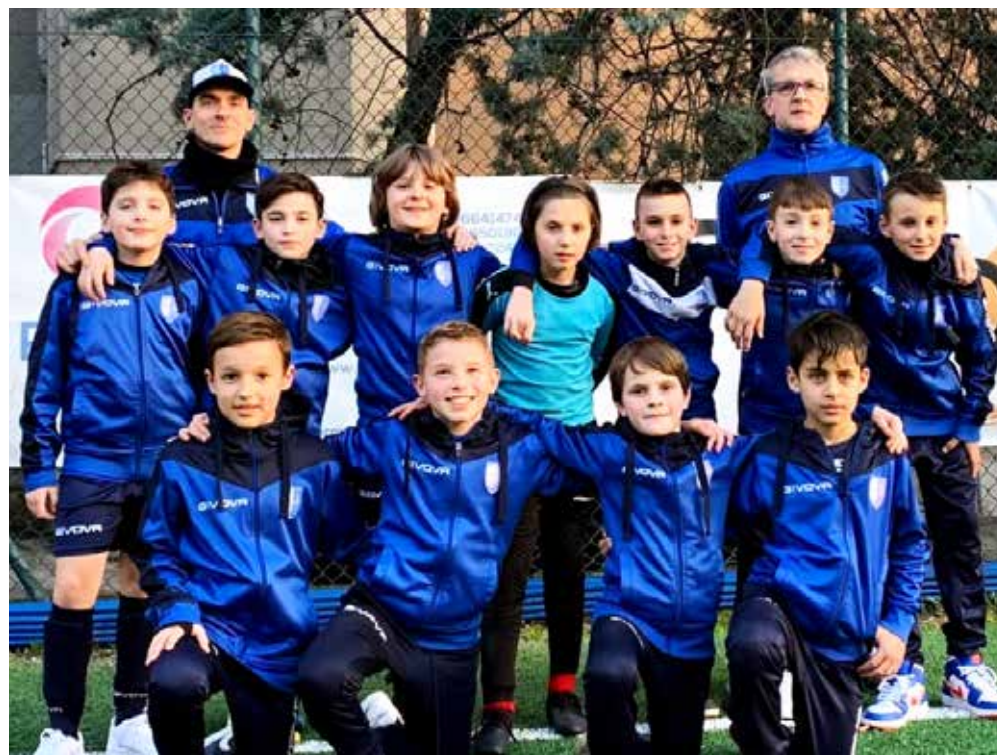
La formazione del Chiarbola Ponziana A

Nel gruppo B, il Kras vince 3-2 sull'Opicina A grazie al successo nel quarto tempo. Andamento analogo tra Chiarbola B e San Giovanni A, ma la volata premia i rossoneri. Tre pareggi su quattro tempi tra Roianese B e Zaule A: decisivo la seconda frazione per il successo bianconero. Il derby tra le due squadre del San Luigi va alla formazione B1, che si impone per 2-1. Tre tempi vinti dal Sant'Andrea C in casa dell'Academy B, con pareggio nel terzo periodo.