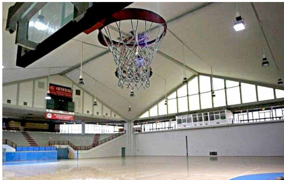
📷 Il palasport di Chiarbola riapre oggi dopo quasi un mese e mezzo di chiusura forzata