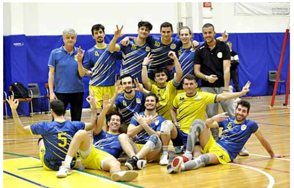
Tre punti e 3-0 per il Cus Trieste, vincente sullo Slovolley nel big-match