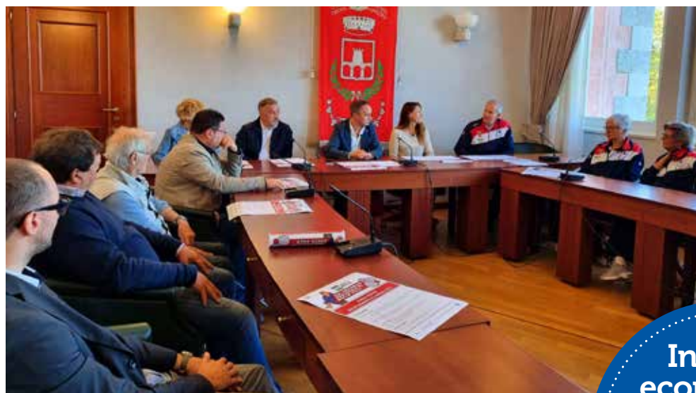
📷 La presentazione del Criterium di bocce volo, avvenuta venerdì al Comune di Duino Aurisina

In partenza giovedì 29 settembre, il torneo proseguirà per tutto il fine settimana con i turni eliminatori e anche (o soprattutto) con le annesse attività collaterali, come i vari pranzi o le cene che la Bocciofila ha tenuto a organizzare. Anche se ciò che conta naturalmente è centrare le finali, in programma per l'ultimo giorno, domenica 2 ottobre. Obiettivo principale dell'evento, a detta dell'organizzazione, è promuovere e diffon-