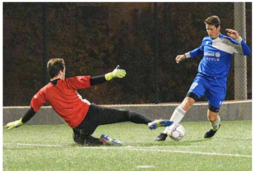
📷 Comoda vittoria per il Circolo Allianz: 17 gol al Tokai Selvadigo

Sono state intanto ufficializzate le date della Crese Cup estiva, che si terrà a Domio fra il 3 e il 29 giugno, con iscrizioni aperte dal 9 maggio.