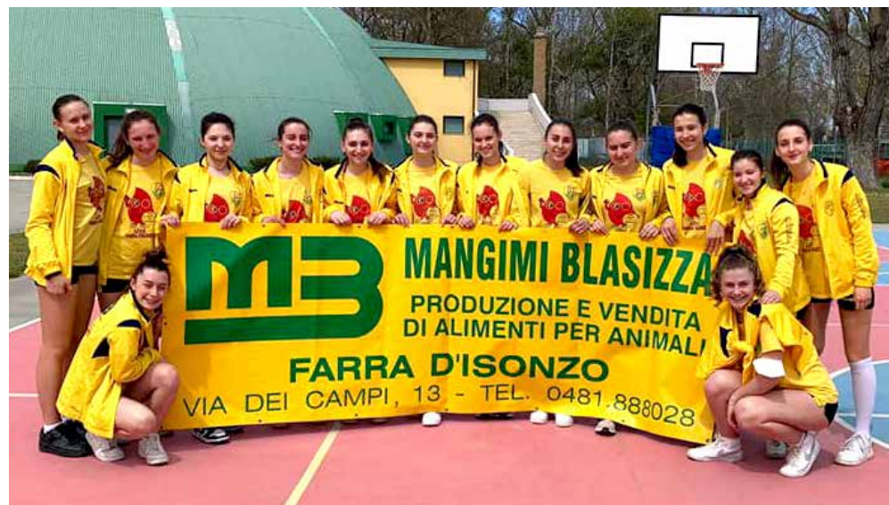
📷 Il Farravolo Under 16, primo in classifica dopo la vittoria sullo Staranzano

S arà Evs - Volley Club dunque la finale del campionato territoriale under 18. Questo l'esito uscito dalle gare di ritorno disputate ieri pomeriggio tra Ronchi e Trieste. Successo largo e dominato per l'Eurovolley, vincente in entrambi i match sul Farravolo. Sconfitta dolcissima invece per il V.Club, battuto 3-2 dal Ronchi ma comunque qualificato in virtù del successo di gara 1. Tre punti sudati invece per il Sokol, parlando del girone Venezia Giulia, 3-0 sull'Altura con soli 7 punti di scarto complessivi.