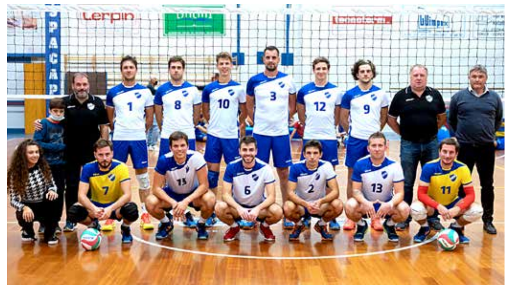
📷 L'Olympia Gorizia, in semifinale dopo il "ribaltone" in gara 2 sul Mortegliano

Quarto turno di post-season invece nel torneo femminile, con esiti decisamente infausti per le formazioni locali triestine e goriziane. Cade l'An-