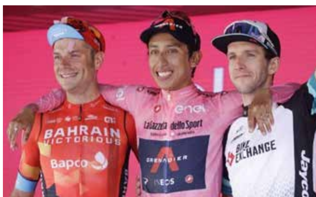
Il podio del 2021: al centro il vincitore Egan Bernal, che ha preceduto Damiano Caruso (a sinistra) e Simon Yates

P artirà venerdì 6 maggio dall'Ungheria il Giro d'Italia 2022 , edizione numero 105 della corsa rosa. Tre tappe in terra ungherese (la seconda una breve cronometro a Budapest), prima di un giorno di trasferimento per cominciare il percorso italiano dalla Sicilia martedì 10 maggio, quando si arriverà sull'Etna per avere qualche indicazione su chi potrà essere protagonista in classifica generale. Interessante anche la 7ª tappa (a Potenza il 13 maggio), ma soprattutto, due giorni dopo, la Isernia - Blockhaus con un arrivo in salita molto probante. La settimana successiva ci saranno due giornate intense, con il traguardo di Cogne del 20 maggio (15ª tappa) e quello dell'Aprica alla 16ª, quando ci sarà l'atteso Mortirolo. I giochi si faranno definitivamente alla penultima tappa (28 maggio) con la Belluno - Marmolada, e nell'ultima giornata, con la cronometro di Verona. In totale 21 tappe con 3.410 km. Gli appassionati del Fvg vedranno la carovana attraversare