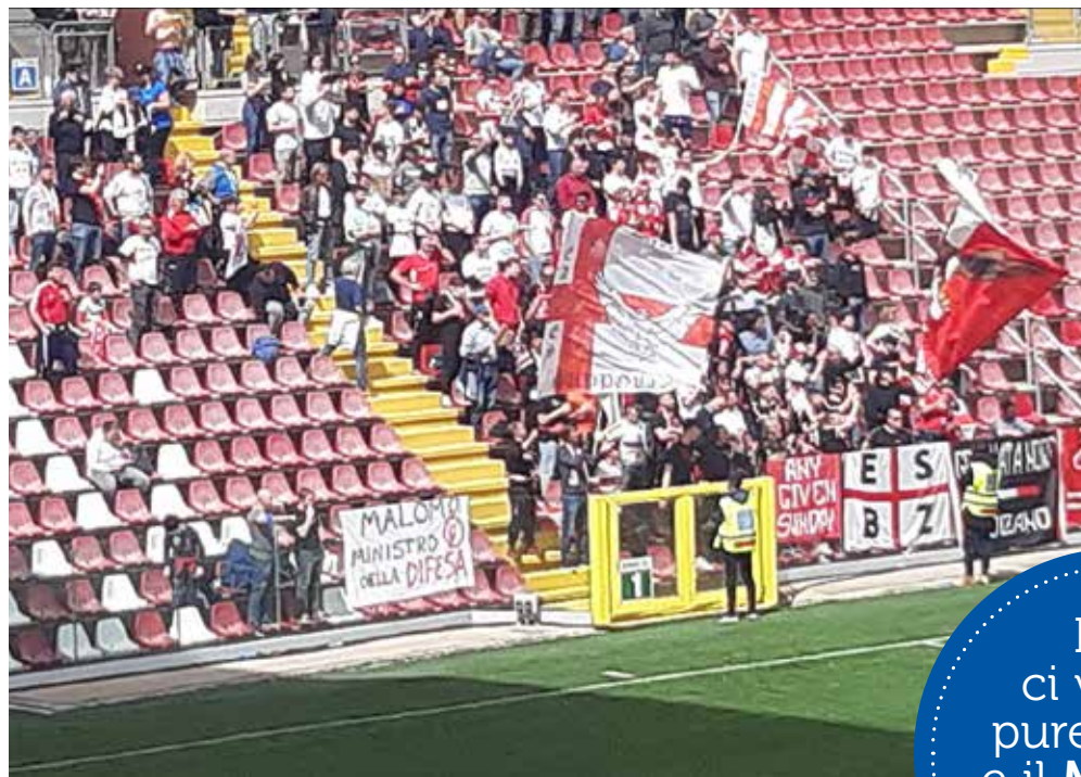
📷 Il settore ospiti del "Rocco" occupato dai tifosi del Sudtirolo. Ce n'erano altrettanti anche in tribuna "Pasinati"

La tifoseria alabardata si è confermata fredda nei confronti dell'Unione, anzi dalla "Colaussi" sono partiti alcuni cori con-