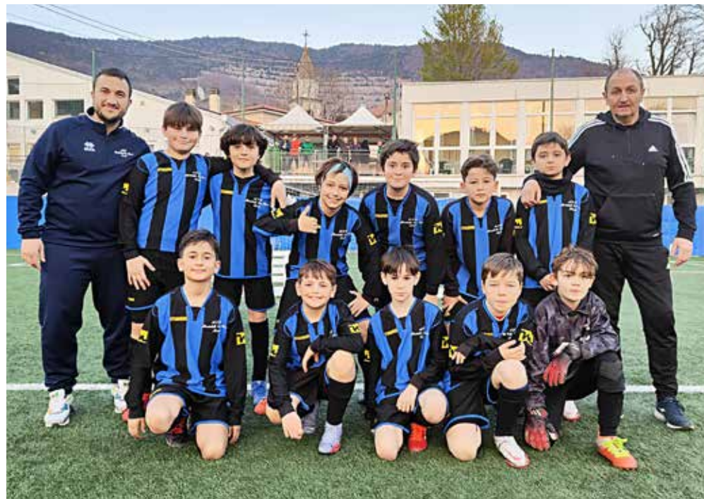
📷 La formazione del Montebello Don Bosco

Bel successo per il Chiarbola Ponziana B nel girone C. I biancoazzurri passano sul campo dello Zaule aggiudicandosi i primi due tempi; terza frazione per i viola. L'Opicina B ha la meglio sull'Altura A, portando a casa tre tempi dopo il pareggio nei giochi preparati e nel primo parziale. Il Sant'Andrea B ha la meglio sulla Triestina