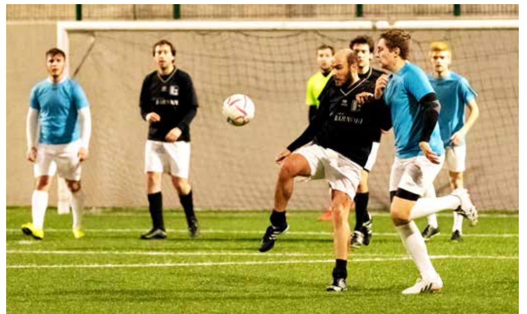
📷 Una fase del match tra Officine Barnobi e Atletico Gin Tonic

I l Termodrim/Trieste Costruzioni incamera sei punti (a tavolino con il Boomerang, 9-4 all'Allianz) ed è davanti alla Banda Lasko, che a sua volta fa bottino pieno con Beat (6-3) e Corte Cafè (7-1). Vittorie per Terzo Tempo (3-1 al Nistri) e Circolo Allianz (5-3 al Samo Jako). In Serie B, Bar Latteria Lol sempre davanti grazie al successo al tavolino sul Minimo Sforzo, ma l'Officine Barnobi risponde con un 11-3 all'Atletico Gin Tonic. Bene anche il Civico Sei, vittorioso 14-4 sull'Antica Barberia Napoletana, mentre il Petes piega per 3-1 il Tokai Selvadigo. Doppietta per la Pizza Smile, che si impone sull'Astrea (3-0) e sul Tokai (19-2).