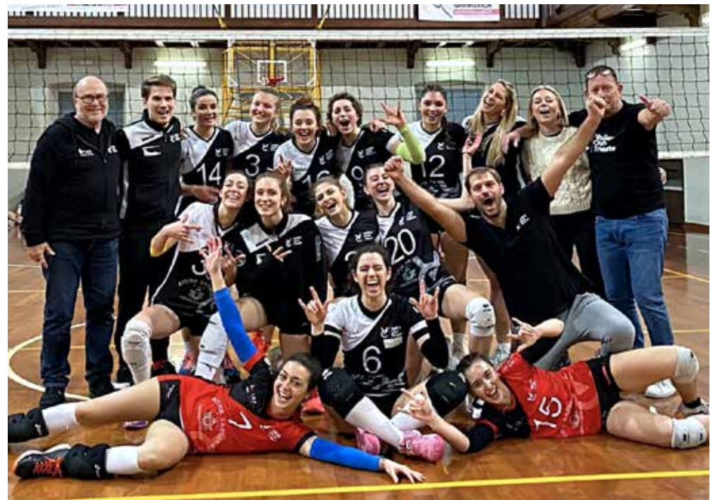
📷 L'Antica Sartoria di Stefini, vittoriosa per 3-2 nel derby con lo Zalet

Risultati a sorpresa anche in campo maschile dove la capolista Cus, cede il passo al quinto parziale al Pordenone. Per gli universitari, ko per 15-13 nel tie-break dopo esser stati costretti a rincorrere per due volte. Punto pesantissimo invece per il Tabor che, sul parquet di Mortegliano strappa un punto alla seconda forza del torneo, vincente solo 15-6. Tre a zero rotondo poi per lo Slovolley di Manià, uscito coi tre punti da Fiume Veneto e ora a soli due punti dal secondo gradino del podio. Festeggia il Soca che, dopo il colpo esterno di sabato sera a Monfalcone, crede più che mai nella rincorsa ai play-off, con il quinto posto ora distante due lunghezze. Serata amara invece per la Tre Merli di