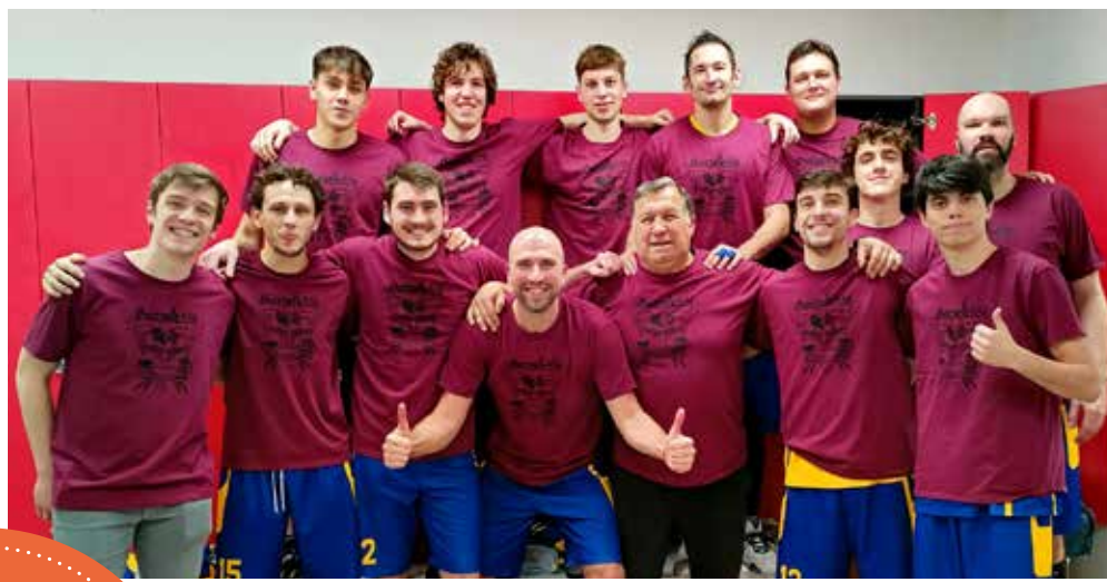
La formazione del San Vito Trieste, vittoriosa venerdì scorso all'Allianz Dome contro la Pallacanestro Trieste U19