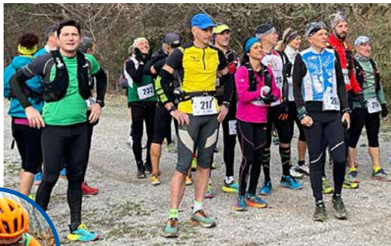
📷 Una carrellata di immagini della Lanaro Granfondo, svoltasi una settimana fa. Un successo fra runner e biker, che hanno dato vita a una bellissima manifestazione