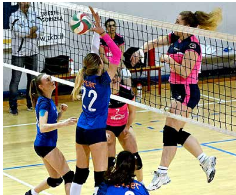
📷 Il Mavrica (in rosa), in una istantanea della sfida di mercoledì pomeriggio di U18 con il Sokol (in blu)

A chiudere, i due incontri programmati per il "C", con il Farravolo meritatamente secondo dopo la netta vittoria per