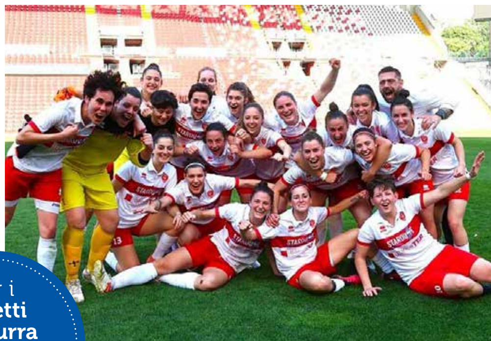
📷 Esultanza al "Rocco" per le alabardate