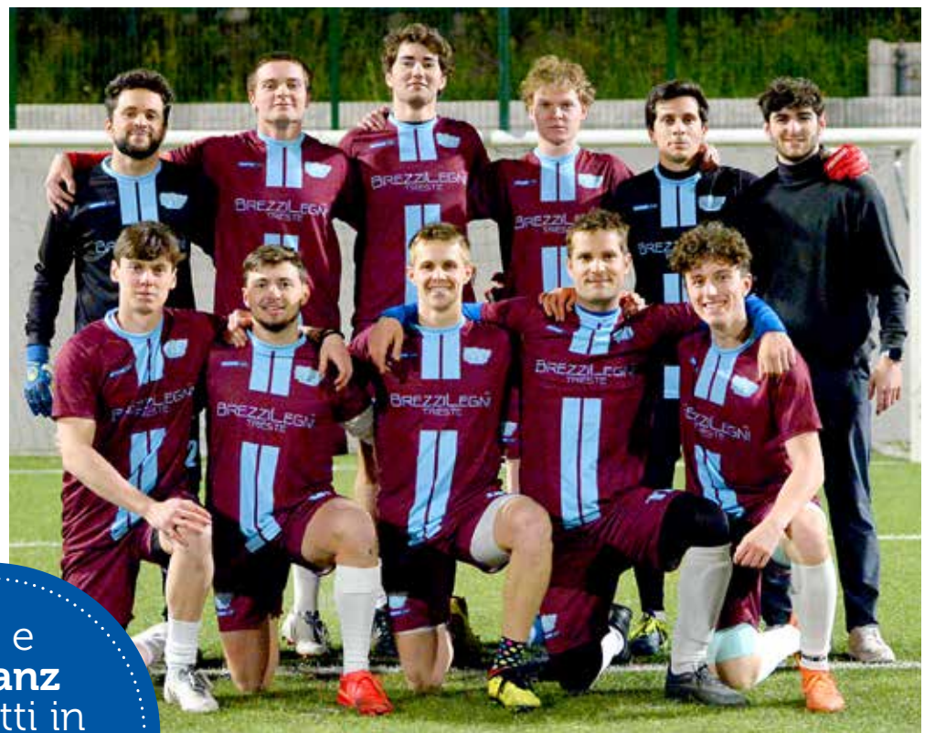
📷 Il Brezzilegni è promosso in Serie B