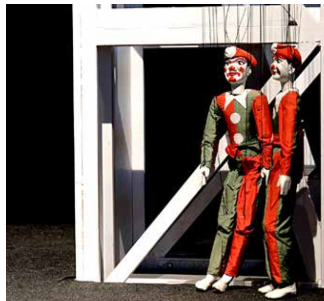
📷 Le marionette "Piccoli di Podrecca"

S i è tenuta venerdì mattina, nella storica sede della Ginnastica Triestina , la presentazione della nuova partnership realizzata dalla polisportiva cittadina e dal Teatro Rossetti . Una sinergia all'insegna del binomio fra sport e cultura, le due facce di una medaglia che sul nostro territorio, soprattutto in passato, sono andate a braccetto e la stessa Sgt, in tal senso, ne è un esempio più che lampante.