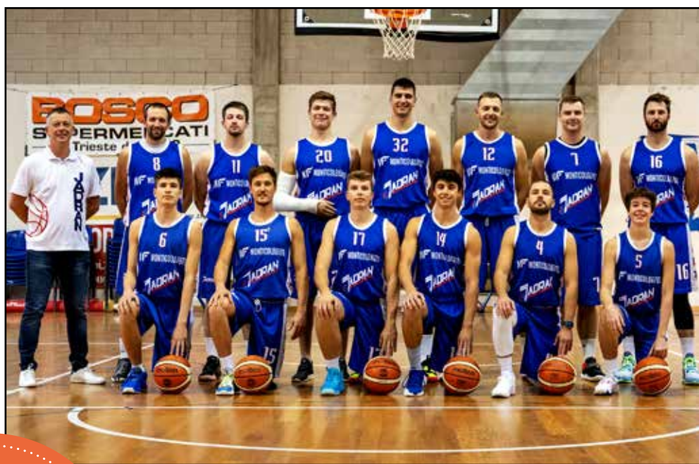
📷 Il roster dello Jadran Monticolo&Foti che sta disputando il campionato di C Gold: ottima sin qui la stagione della squadra di Opicina