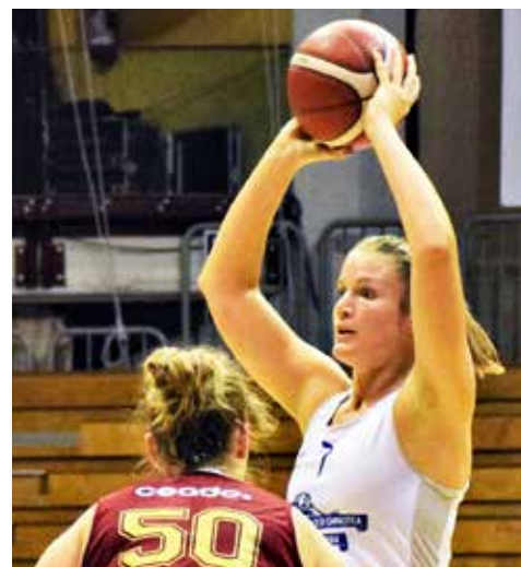
📷 Bric (Sgt), 6 punti contro l'Oma

sorrette da una monumentale Sammartini firmano il rientro, fino al -5 dell'intervallo. Nella ripresa Milano tenta più volte lo strappo, ma non riesce a scappare: le ottime Streri, Cumbat e Miccoli tengono il Futurosa in scia, con la difesa lombarda che prova a stringere le maglie, ma non tiene la velocità e il buon giro palla delle triestine. Si arriva sul -4 a due minuti dalla fine con la partita completamente aperta, ma