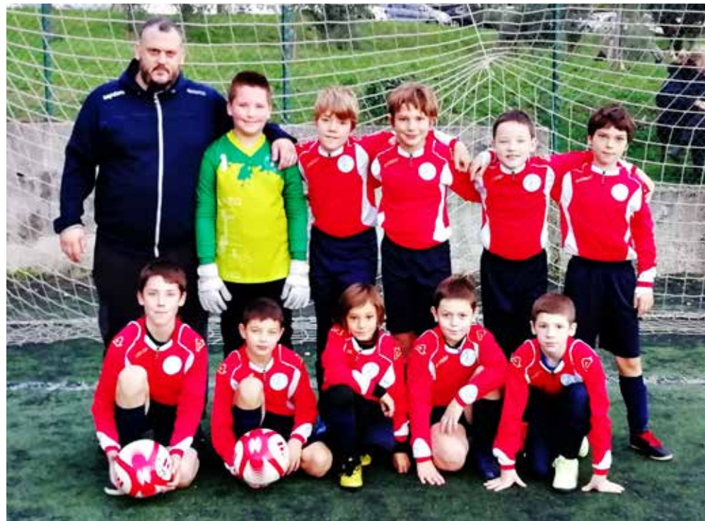
📷 La formazione dello Zarja Breg B

Nel girone C il San Luigi C si aggiudica la vittoria contro l'Opicina B: bottino pieno per