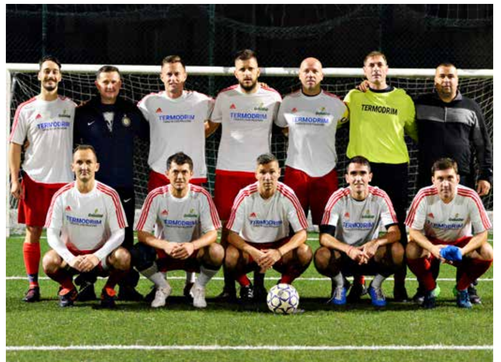
📷 Il Termodrim/Trieste Costruzioni, vittorioso 12-3 sul Samo Jako