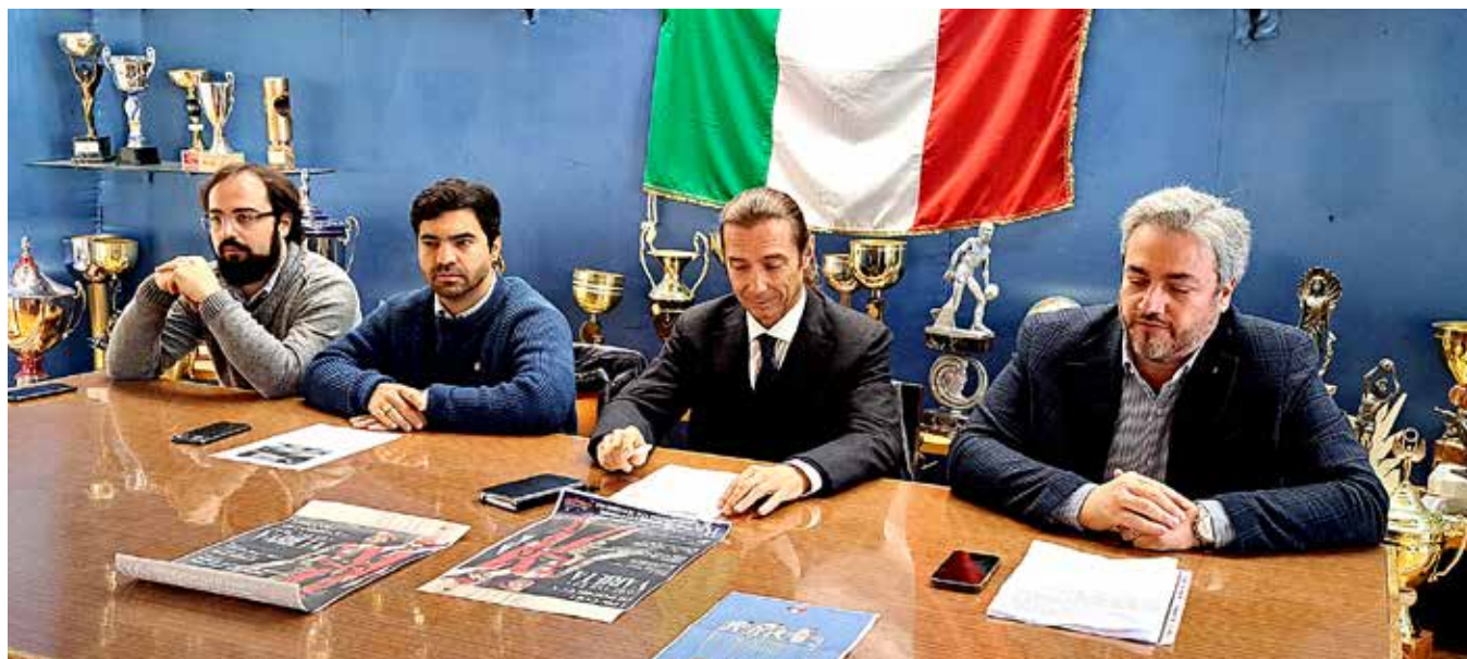
📷 La conferenza stampa di presentazione del progetto, tenutasi venerdì nella sede della Ginnastica