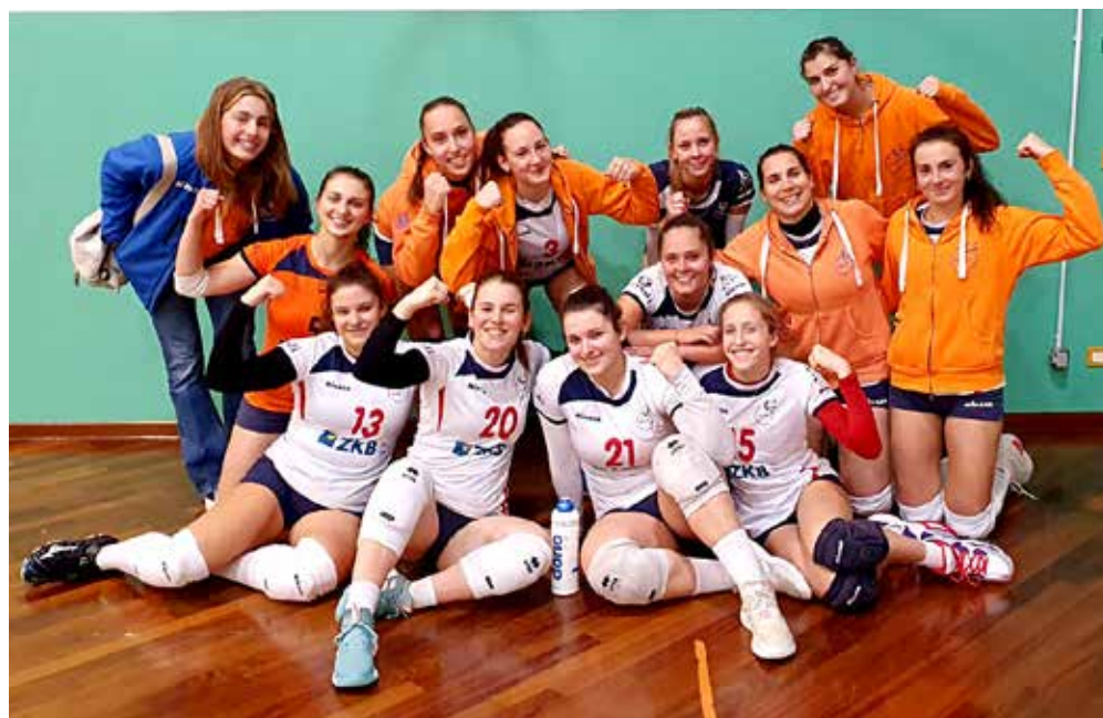
Lo Zalet, ancora imbattuto e 2° in classifica, a solo un punto dalla capolista

N on si vuole fermare, e capiamo chiaramente il perché, la corsa dello Zalet che, grazie al prepotente 1-3 centrato sul parquet di Buia, conquista la settimana affermazione stagionale, rimanendo a contatto della capolista Pordenone, distante solo un punto. Sabato sera da rivedere invece in casa Eurovolley ed Antica Sartoria, entrambe finite al tappeto nei rispettivi match per 3-0, contro Tarcento e Portogruaro. Per le bianconere, rimpianti per il terzo parziale, ceduto sul 27-25. In casa Evs, troppo ampio il divario accusato contro le venete, uscite coi tre punti dalla Don Milani. In campo maschile invece, sette su sette del Cus del nuovo coach Begic, a segno nuovamente per 3-0, questa volta sulla Fincantieri. Universitari in vetta, a +3 sul Mortegliano. Terzo gradino del podio invece per la Tre Merli, vincente per due volte in pochi giorni, prima per 3-2 sulla Fincantieri