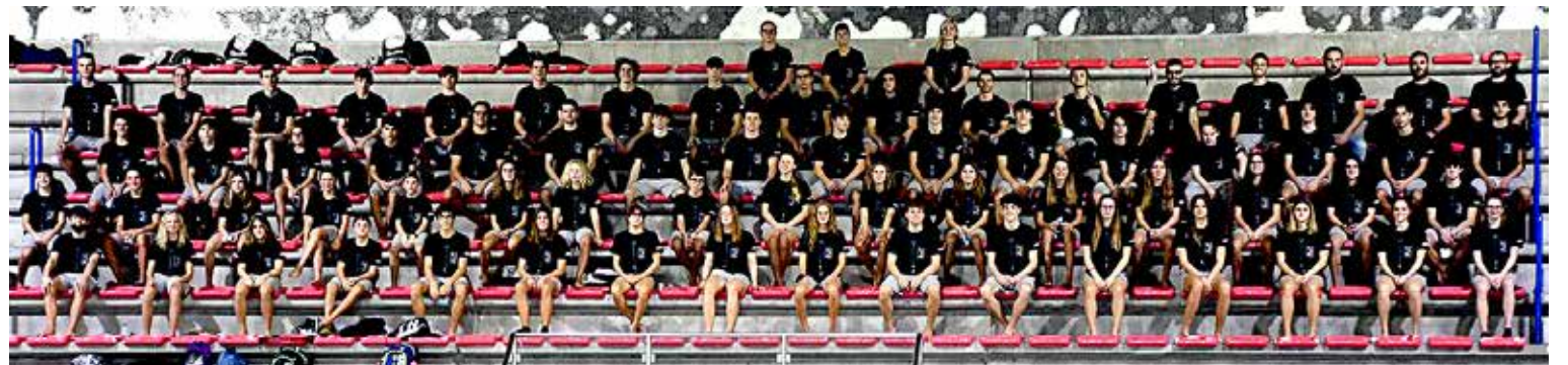
📷 Foto collettiva per il numeroso gruppo della Trieste Nuoto

Le prime finali regionali del nuovo sodalizio giuliano, che punta ad un ruolo da protagonista in Friuli Venezia Giulia e in futuro anche in ambito nazionale, han-