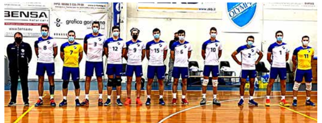
📷 L'Olympia Gorizia, giunto alla quarta vittoria consecutiva, questa volta sulla Fincantieri Monfalcone

Copertina di giornata tutta per l'Olympia Gorizia che, grazie ad un pesantissimo 0-3 rifilato nel derby isontino alla Fincantieri, continua la propria marcia indemoniata, giunta a quattro successi consecutivi. Per i biancoblu, ora terzo posto in solitaria a quota 28, a due sole lunghezze proprio dagli avversari monfalconesi. Quarto posto, a stretto giro, per lo Sloga Tabor, vittorioso sì con il Mortegliano, ma dopo rimpianto di troppo. Per i biancorossi, ottimo inizio di sfida e doppio vantaggio conquistato senza alcun patema, con parziali a 14 e 16. Black-out invece nella parte centrale della sfida per i triestini, rimontati e portati al