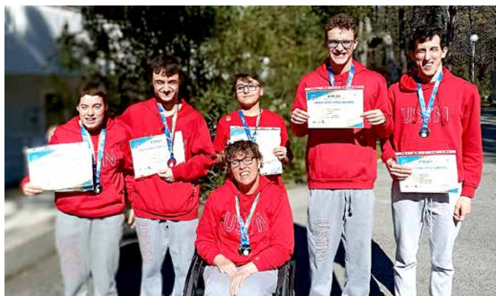
📷 Gli atleti paralimpici della Triestina Nuoto che si sono contraddistinti a Lignano

In contemporanea a Lignano si sono svolte anche le World Series, con 411 atleti da 42 nazioni;