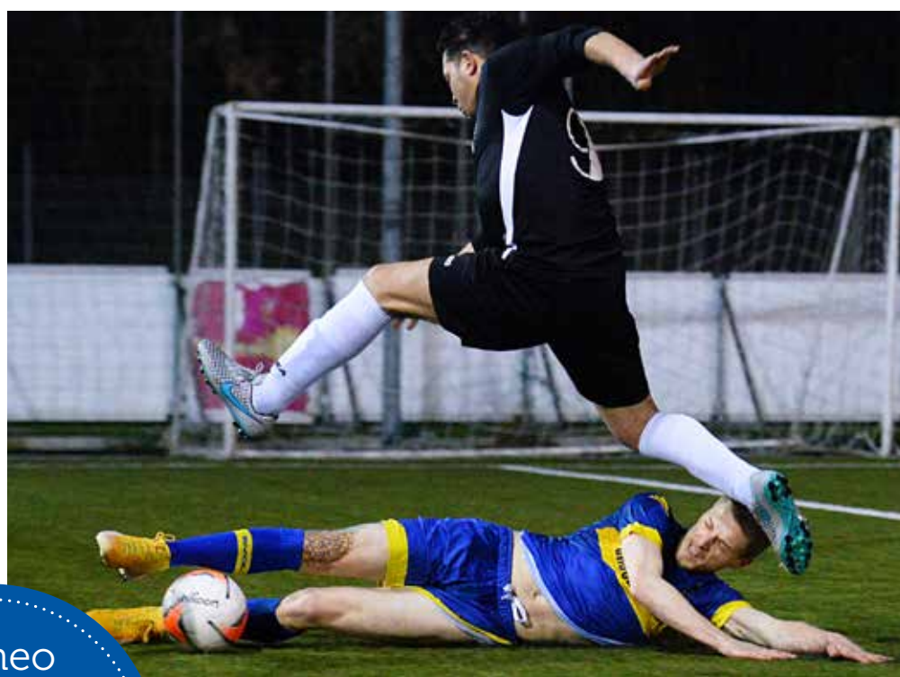
Un momento della finale di Champions tra Bar G e Istria