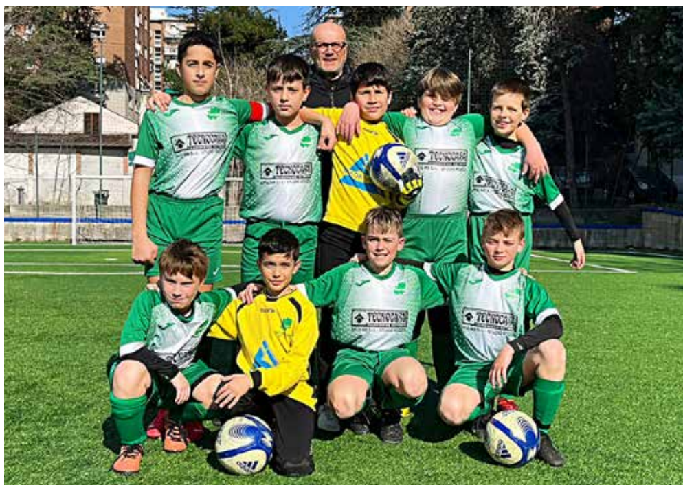
📷 La formazione del San Luigi D

In parità, nel girone C, anche la gara tra Chiarbola Ponziana B e San Luigi D, con i padroni di casa che riequilibrano nel secondo tempo il vantaggio preso dai biancoverdi nei giochi tecnici. L'Opicina B ha la meglio sul San Giovanni A al termine di una partita molto combattuta e indirizzata ver-