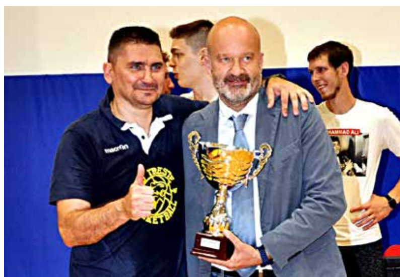
📷 Gianluca Pozzecco, premiato dal presidente FIP FVG Giovanni Adami

«Sicuramente un team dove abbiamo cercato di riconfermare tanti giocatori. Come Cus abbiamo la fortuna di avere parecchi giovani che, venendo a studiare a Trieste, ci contattano per proporsi alla nostra squadra: non