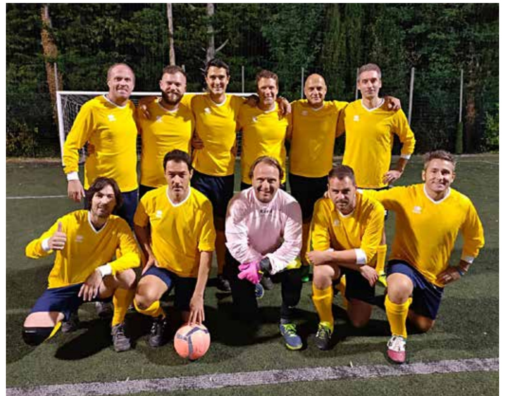
📷 Il 118 Rescue, impegnato in Serie C

GOL: Segulja, Craus A., Craus M., Nardelli; 2 Mo-