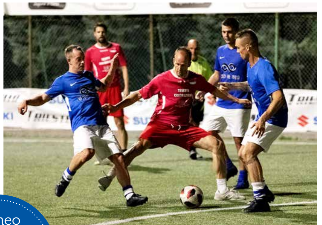
📷 Una fase del match di Crese Cup fra Costruzioni e Bro&Sis

Nella League, l'Home mette al sicuro il primo posto del girone A battendo 4-3 le Officine Barnobi e 10-4 l'Its; ok il Terzo Tempo, che piega 7-2 il Bar Naut dopo la sconfitta 6-4 con il Barnobi. Il gruppo B vede Zanutta e Tre Quarti superare 4-1 il Truglio e 4-3 il Trieste Costruzioni, poi vittorioso 5-2 sull'Agmen; la Pizzeria Tre Quarti concede il bis battendo 3-1 il Truglio. Nel gruppo C vincono Dolci di Fulvio (3-2 al Gin Please, che poi supera 5-4 il Cavana), Stigliani (10-1 al Cavana) ed Excalibur (8-5 al Dolci di Fulvio). Nel girone D il Mast batte 4-2 l'Istra,