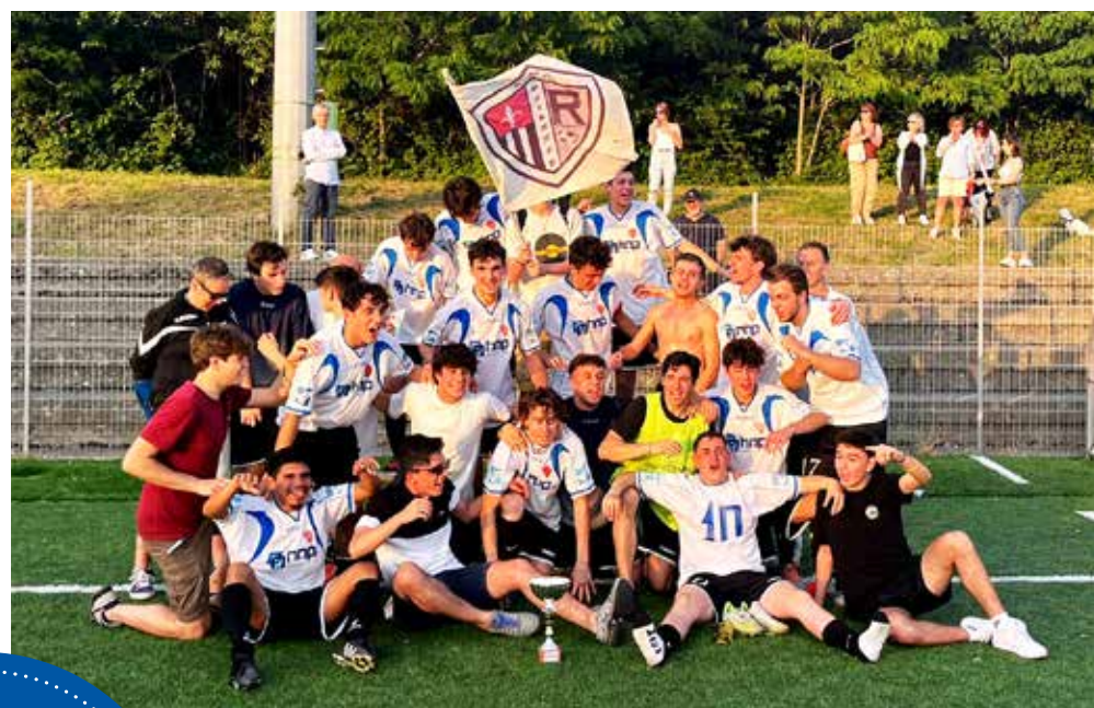
📷 Dopo il titolo provinciale, gli Juniores della Roianese vincono anche il Città di Trieste di San Giovanni

La Roianese vince il torneo Juniores: il 4-0 all'Opicina regala matematicamente il titolo ai bianconeri con un turno di anticipo, aggiungendo un trofeo alla bacheca di viale Miramare, già arricchita dal titolo provinciale conquistato in questa stagione. Il Sistiana supera il San Giovanni 3-1 e raggiunge i gialloblù al secondo posto; prima vittoria per il Muglia, che ha