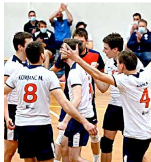
🔗 I ragazzi dell'Olympia festeggiano il successo nel derby con il Soca PH Cavdek SZ Olympia

zo, vincenti per 1-3 sul parquet di Via Carli. Per i triestini, un ko che brucia per la piccola differenza pagata nel corso di tutto il match, con gli ospiti a trionfare per soli 8 punti totali, quanto sufficiente per il punteggio finale. Serata totalmente da dimenticare infine per le altre due compagini del comitato Trieste-Gorizia. Tutto troppo difficile per i monfalconesi della Fincantieri, sconfitti per 3-0 senza mai essere in gara dalla capolista Futura, in un match davvero ostico, contro