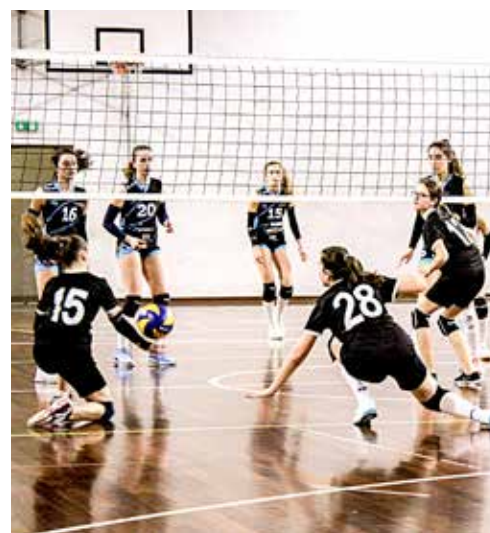
➔ Uno scambio della sfida disputata lunedì scorso tra Olympia Trieste ed Eurovolley: l'incontro si è concluso con il punteggio di 3-0 a favore del Midstream PH Asia Cima

Classifica: Bcc Staranzano 9, Pieris 7, Farravolo Gialla 5, Ronchi 3, Turriaco e Fincantieri 0