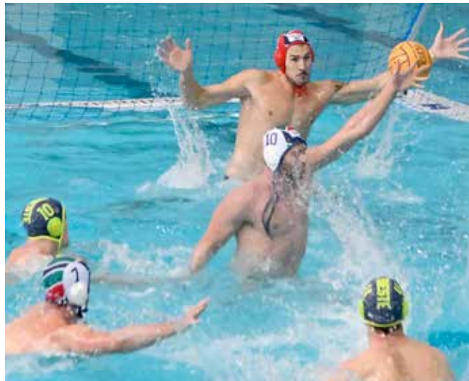
Un frangente del match di sabato tra Telimar Palermo e Pallanuoto Trieste

A d un passo dall'impresa. Il risultato finale del match tra Telimar Palermo e Pallanuoto Trieste, valido per il primo turno di ritorno del "preliminary round" scudetto (girone E) della serie A1 maschile, sorride alla compagine siciliana. Il 10-10 infatti permette ai ragazzi di "Gu" Baldinetti di ipotizzare (al 99%) il secondo posto e la qualificazione alla semifinale play-off. Per la squadra del main-sponsor Samer & Co. Shipping le speranze sono quasi al minimo, bisognerebbe battere il Posillipo in casa e andare a vincere sul campo della squadra più forte di tutte, la Pro Recco. E sperare che il Palermo non faccia più punti. Difficile, molto difficile, se non quasi impossibile. In ogni caso la prestazione offerta dal gruppo di Daniele Bettini alla Olimpica di Palermo è stata davvero positiva. È mancata un pizzico di fortuna, maggiore cinismo in certe