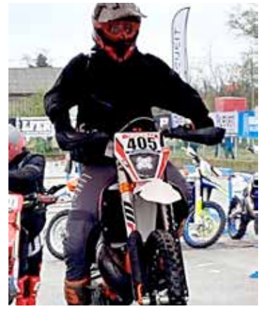
Il prossimo appuntamento con il tricolore Italiano Under 23/Senior è per il 2 maggio a Tolve (PZ) ospiti del Moto Club Alta Murgia.