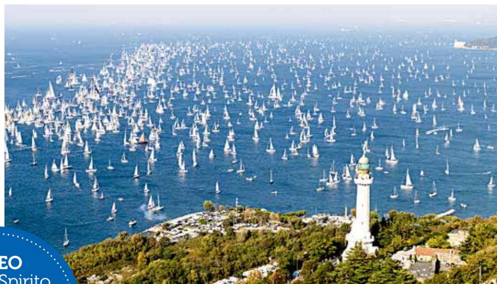
📷 La spettacolare panoramica di una passata edizione della Barcolana