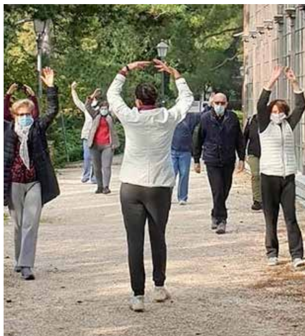
Foto di archivio delle ultime attività all'aria aperta allestite dall'Associazione Benessere in questi ultimi mesi