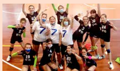
La Fincantieri Monfalcone, qualificata alla finale 5°-6° posto

roster limitatissimo. Ben più complessa invece l'affermazione dell'Us Azzurra, vincente sull'Azzurra Rdr, dopo un testa a testa di oltre due ore e conclusosi sul 10-15 del tie-break.