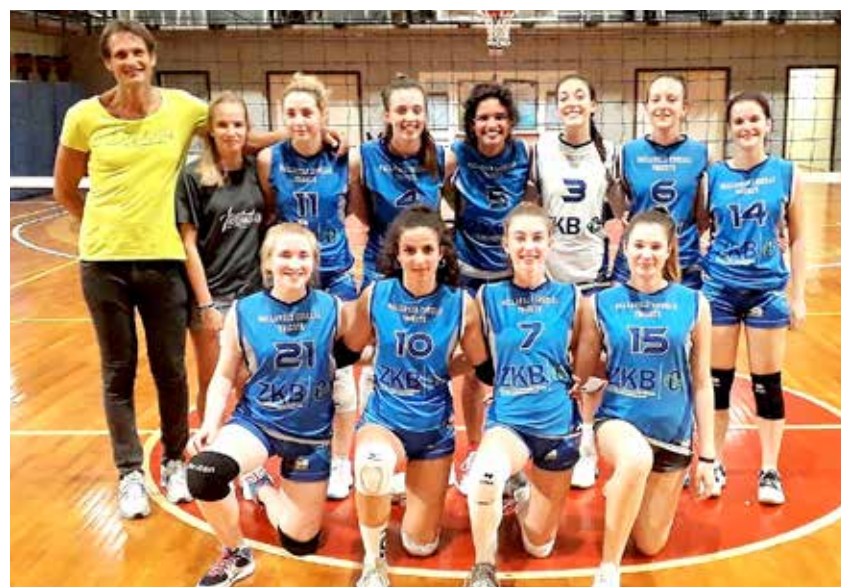
Il Centro Coselli Zkb, finalista dopo la doppia vittoria sull'Hair Trainer Volley