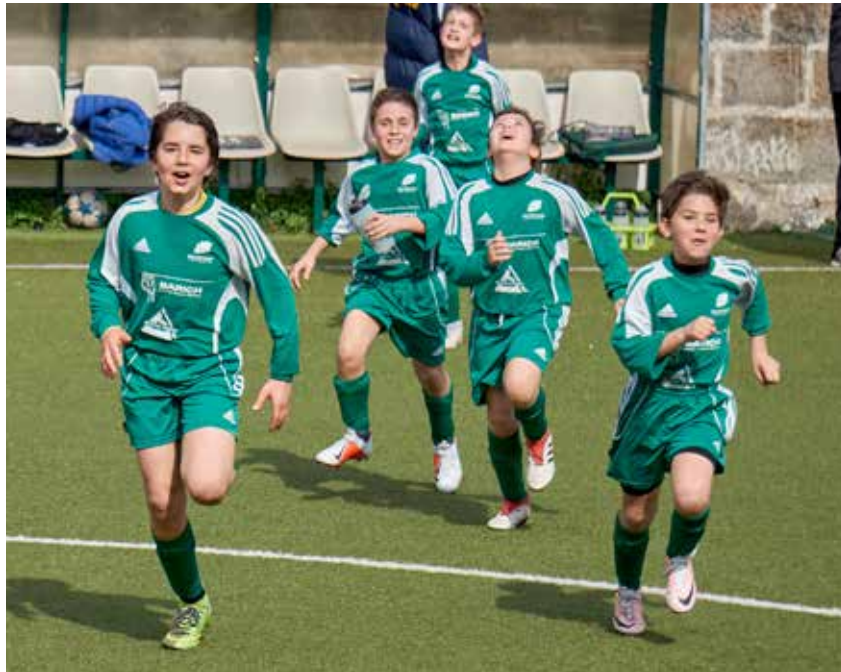
Un momento del camp organizzato dal San Luigi negli anni passati. Quest'anno la società biancoverde propone un Centro estivo ancora più ricco