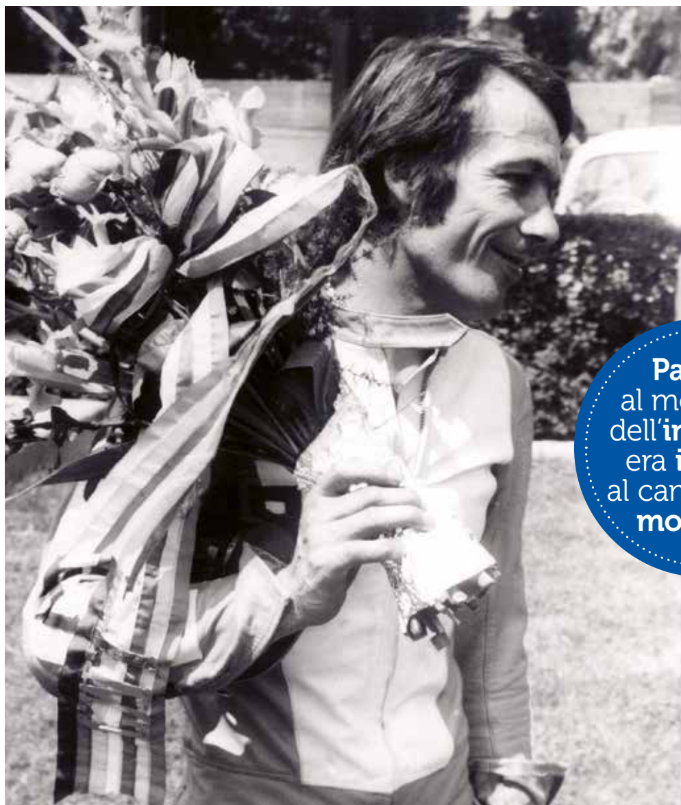
📷 Gilberto Parlotti in una foto d'epoca, quando era all'apice del successo motociclistico a livello mondiale

Pur non essendoci disponibilità di moto ufficiali, Parlotti, la cui generosità in gara fu riconosciuta dall'ambiente, fu chiamato in varie occasioni dalle Case per "dare una mano" sui circuiti più difficili e, al tempo, pericolosi. Avvenne con la Morini per vincere il Gran Premio di Jugoslavia ad Abbazia nel '65, poi per l'esordio vincente della Ducati 500 bicilindrica, con la Derbi 50 per fare "da secondo" al campione mondiale Angel Nieto, e soprattutto con la Benelli 250 4 cilindri per consentire al team pesarese ed al suo pilota Karruthers di vincere il mondiale. In quella occasione, sempre ad Abbazia, Gil-