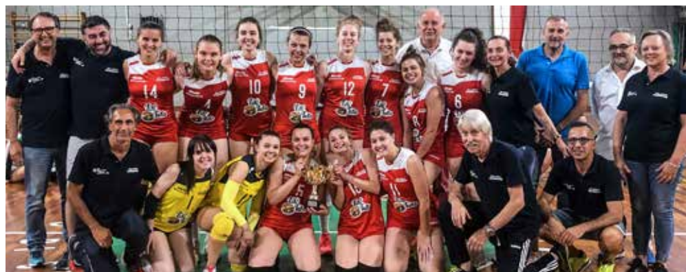
📷 Il Tiki Taka Staranzano, neopromosso in Serie D dopo la vittoria sul Volley Club