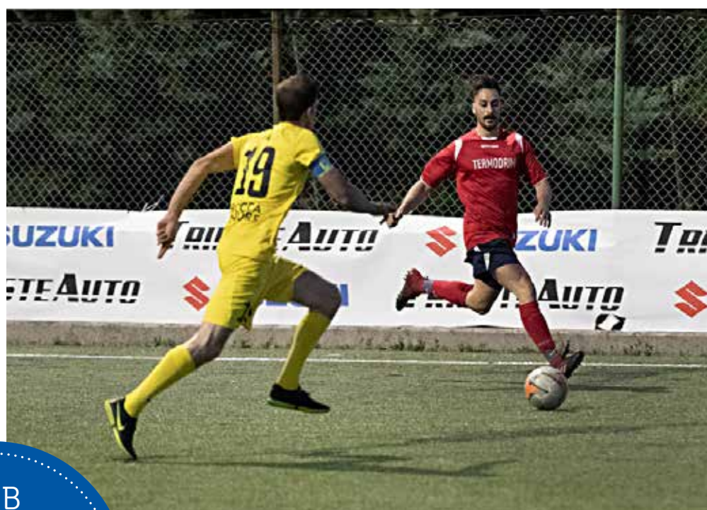
📷 Una fase della semifinale tra Bar G e Trieste Costruzioni

Nella Crese Cup, tutto facile nel girone A per il Trieste Futsal sul Cral Trieste Trasporti (19-1, poker di Russo e Istrice) e vittoria per l'Edil New Sam sul San Bartolomeo per 5-3; il gruppo B vede i Restauri Edili Maliqaj battere 5-2 l'Arrogante. Nel girone C, vittoria Gomme Marcello sul Trieste Costruzioni (4-2), bisata dal 14-1 con Quadrato Immoabilire (8 gol di Muiesan); bene anche il Bro & Sis che passa 3-2 sull'Amazon grazie a Stipancich. Nel gruppo D, ok Istra (12-1 all'Opicina con sei gol di Veseli) e Rekanzi (5-2 sul Termotek. Nella League, bene nel girone A Home (5-3 al Terzo Tempo) e Bar Naut (4-2 all'Its Ecologia); nel gruppo B vincono Pizzeria Tre Quarti (7-5 all'Agmen), Trieste Costruzioni (4-1 al Zanutta) e Banda Lasko (4-3 all'Agmen); nel girone C, bene il Cavana che supera 4-3 i Dolci di Fulvio e tre punti per lo Stigliani sul Gin Please per 6-3 Il gruppo D vede il