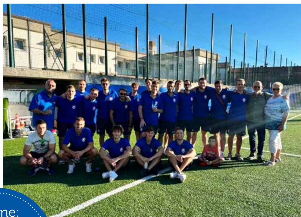
📷 Qualificazione al turno successivo di Coppa per il Vesna