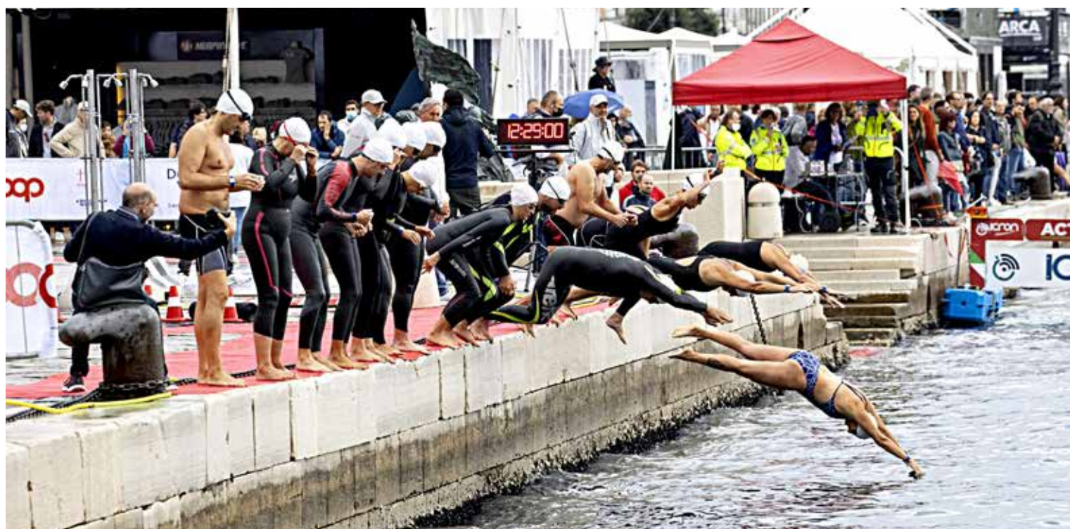
📷 Due istantanee della scorsa edizione della Barcolana Nuota, gara in acque libere in collaborazione con l'Ustn