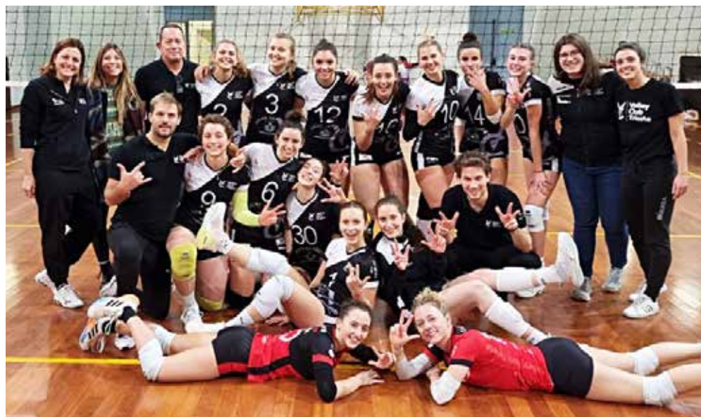
📷 Colpo dell'Antica Sartoria, vincente sabato pomeriggio con un rotondo 3-0 sul Pordenone terzo in classifica

T ra classifiche stravolte, zampate dal sapore playoff, e prime volte, quello appena concluso è stato un weekend decisamente movimentato per la serie C. Partendo dai parquet rosa, copertina dedicata all'Antica Sartoria di Stefani, capace di stendere alla Cobolli il Pordenone, terzo in classifica e fino a sabato sconfitto solo dalla capolista Zalet. Per le bianconere, 3-0 e punti granitici in ottica corsa salvezza. Sempre in vetta, e ancor di più dopo l'ultimo 3-0 consegnato al Fagagna quarto in classifica, lo Zalet di Privileggi, autentica rivelazione del torneo, e unica imbattuta, con un 10 su 10 da applausi. Sconfitta in rimonta invece per l'Eurovolley, partita bene sul campo del Latisana e battuta poi 3-1 dalle padrone di casa, ora al settimo posto. Botti però anche nel torneo maschile, grazie allo Slovolley, capace di interrompere la striscia di vittorie del Cus