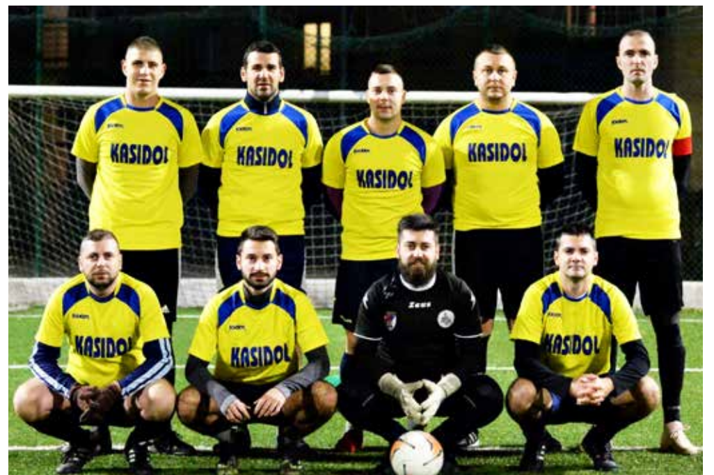
📷 Il Boomerang ha centrato il primo successo stagionale