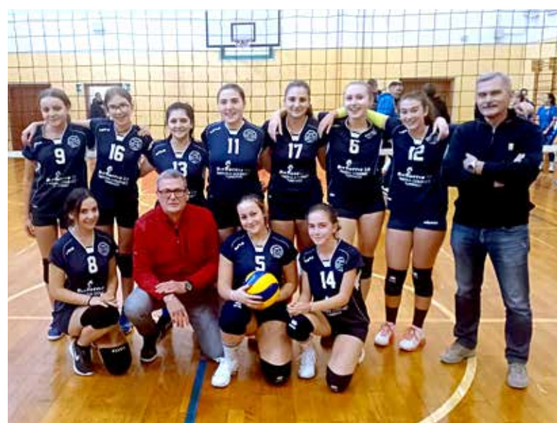
📷 Il Bisboccia Turriaco, vincente per 3-0 mercoledì sera contro lo Swan Volley nel girone B dell'Under 16

Classifica U18 A: Evs Midstream 18, Ronchi 15, Dvigala 11, Virtus 9, Staranzano 7, Mossa 3, Altura 0