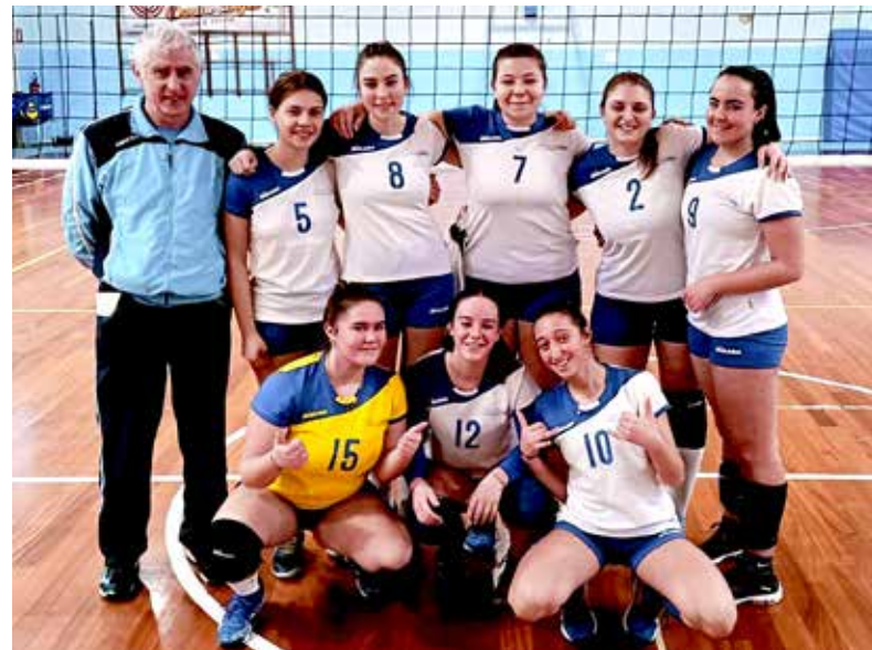
📷 Il Mossa U18, alla prima vittoria stagionale, 3-0 sulla Pallavolo Altura