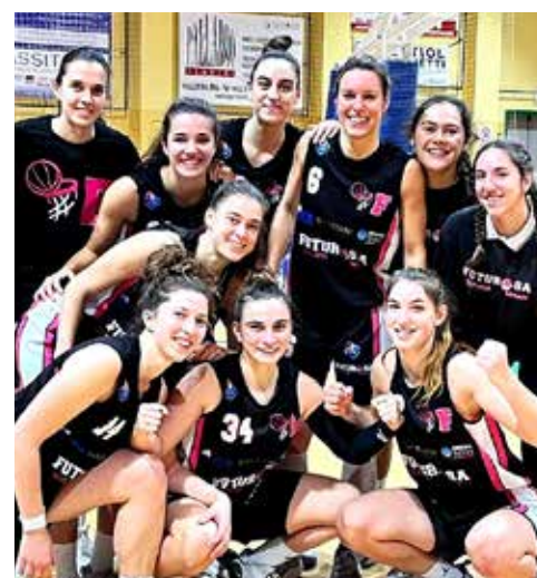
📷 La gioia del Futurosa a Ponzano

In serie B cade in casa la Sgt al cospetto del Giants Mar-