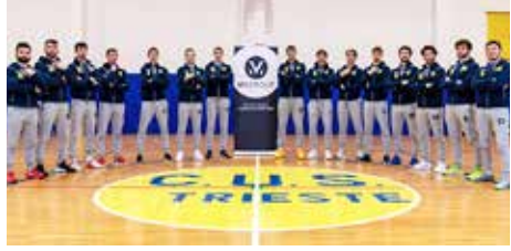
📷 La rosa del Cus Trieste schierata sul parquet di casa. Per gli universitari questo fine settimana niente da fare contro i più forti avversari del Monselice