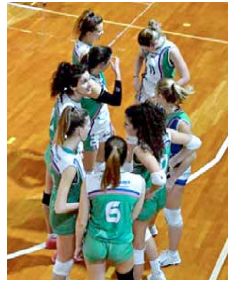
Le coselline, in testa al girone C, durante un time-out

Classifica: Soca 18, Prata 15, Futura 12, Volley Club 9, Pasion di Prato 6, Il Pozzo 3, Aurora Udine 0