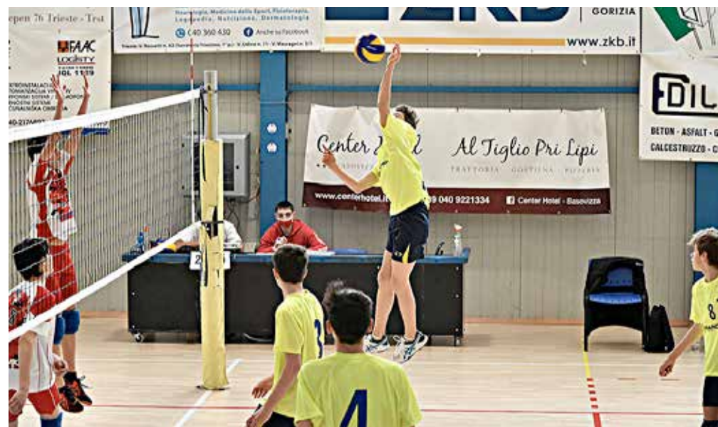
Il Soca ZKB in azione (foto d'archivio). Ieri i ragazzi di coach Matej Juren hanno dovuto cedere il passo al Volley Club PH Slosport.org

Primi punti e prima vittoria, prima dell'annunciato ritiro, per l'Olympia Trieste che, nel derby triestino con il Kontovel, vince per 3-0 nella sfida di bassa classifica nonostante una situazione emergenziale sia di atlete che di staff. Successo e leadership incontrastata invece per l'Evs di Spello, a segno anche nella super sfida di testa con il Sokol, stesa alla Don Milani per 3-0. Muove la classifica anche lo Zalet Dvigala, anadato a segno ad Opicina sabato pomeriggio contro l'Altura B per 3-0, con una prestazione lineare e costante per tutta la gara. A completare il pacchetto di sfide femminili, i