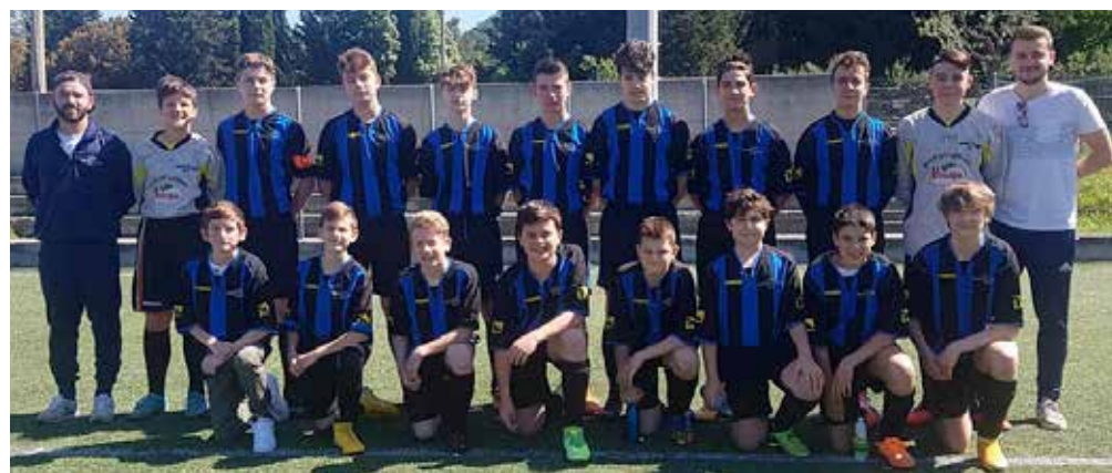
La formazione del Montebello Don Bosco