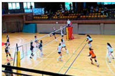
📷 Eurovolley e Zalet durante la finale 1°- 2° posto

in quel di Monrupino, una vittoria difficile da dimenticare.