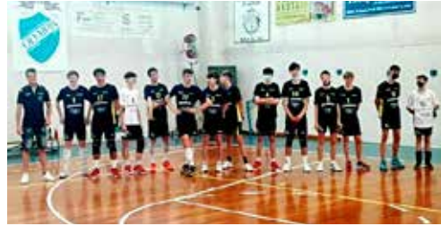
Il Soca Zkb, laureatosi campione regionale con la vittoria per 3-0 sul Futura Cordenons

maschile, con gli atti conclusivi per il campionato regionale. Nel derby di comitato tra Volley Club e Soca, pass conquistato per la finalissima dal team isontino, andato a segno con un doppio 3-0 sui giovani bianconeri triestini. Show anche in finale per il Soca che grazie un altro gran 3-0, questa volta sul Futura Cordenons, si laurea campione regionale, accedendo di fatto alle finali nazionali. (M.V.)