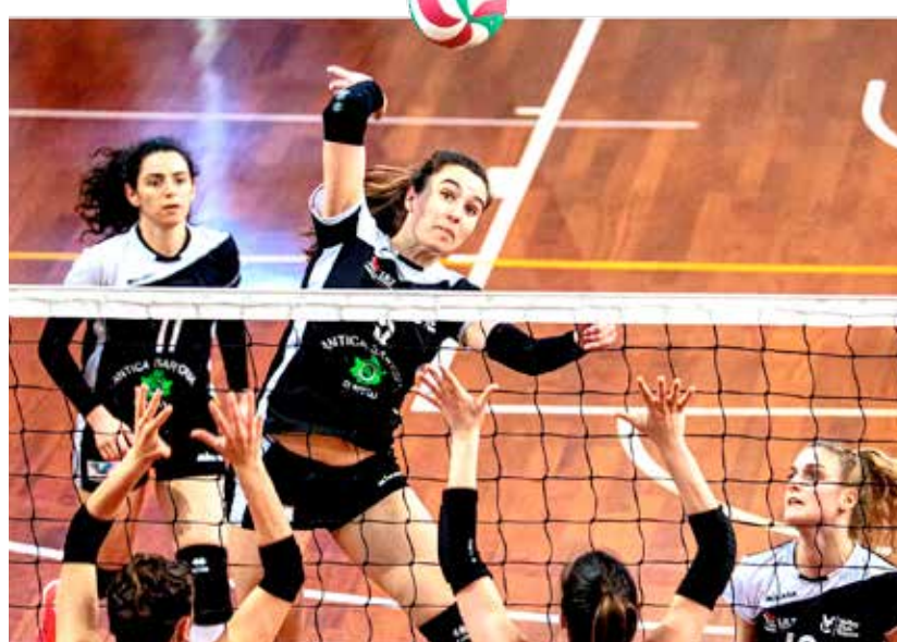
📷 L'Antica Sartoria in attacco durante la gara giocata nello scorso fine settimana