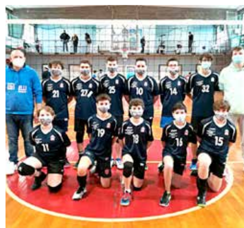
Vittoria agile per i ragazzi del Coselli, a segno nel derby tutto triestino sullo Sloga Tabor, regolato a domicilio per 3-0 in un incontro combattuto

Quindici incontri per cinque gironi: questa la preview degli incontri disputati negli ultimi giorni, sfide valide per il torneo di under 15. Nel girone A, prosegue la fuga dello Staranzano, a segno sul Farravolo per 3-0. Punteggio medesimo anche per il Ronchi, a segno per ben due volte sulla Fincantieri, ed ora al secondo posto a quota 12. Nel girone B, strada spianata per il Mavrica, leader incontrastato senza set persi anche dopo il doppio successo sul Mossa. Salgono in graduatoria anche il Farravolo, vincente sull'Azzurra, e il Soca, festante a Gradisca. Causa doppio rinvio, solo tre le gare disputate nel terzo girone, con l'Evs a dettare legge con un doppio successo sul Kontovel, inseguito a stretto contatto dal Sokol, secondo a quota 17 dopo i tre punti maturati sull'Altura B. Testa a testa infine in vetta del girone D, con Coselli e Virtus a dividersi il primo posto dopo le rispettive affermazioni sul Bor. Passando invece al torneo maschile, due le gare disputate, con la capolista Volley Club sempre più dominatrice del campionato, dopo la sesta perla consecutiva conquistata, questa volta sulla Fincantieri per 3-0. Vittoria agile anche per il Coselli, a segno nel derby tutto triestino sui pari età dello Sloga Tabor, regolati a domicilio in un match combattuto. Mattia Valles