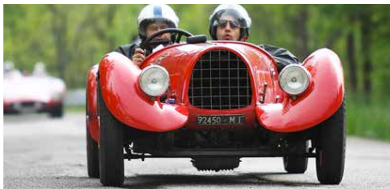
Due foto d'archivio tratte dalle scorse edizioni della kermesse automobilistica