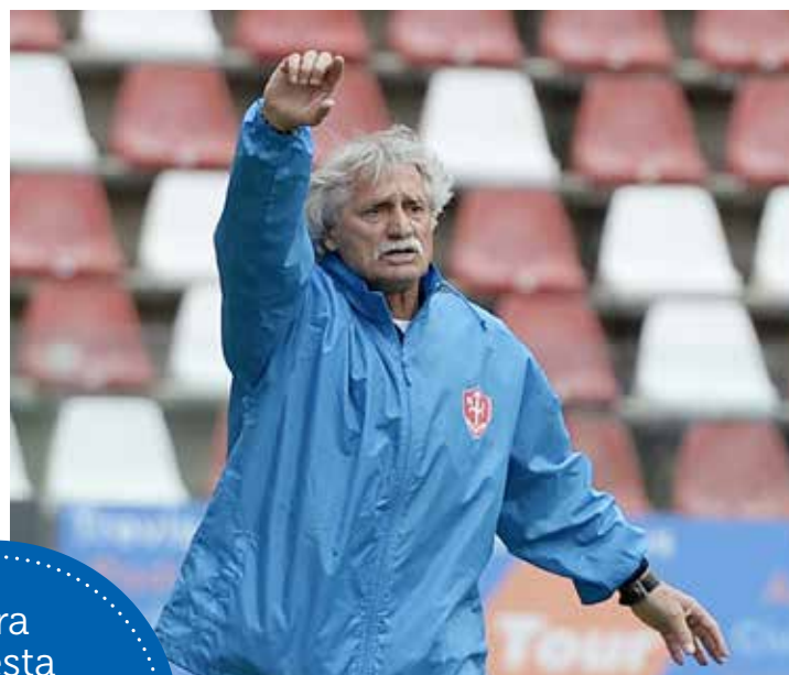
📷 L'allenatore della Triestina, Bepi Pillon, di certo non è soddisfatto per il risultato e l'approccio alla gara di ieri. Ma il tecnico guarda avanti e pensa a recuperare energie e giocatori in vista dei play-off che partono la prossima domenica

N on era il risultato che voleva Bepi Pillon , ma l'allenatore della Triestina prova a fare buon viso a cattivo gioco, resettando la mente e pensando già alla partita di domenica prossima contro la Virtus Verona. "Volevamo vincere e raggiungere il quinto posto, ma non ci siamo riusciti - afferma il mister - anche perché abbiamo disputato un primo tempo bruttino. Poi abbiamo reagito, cambiando sistema di gioco e cercando in tutti i modi di ribaltare la situazione. Purtroppo non è andata bene". La partita, in particolare l'approccio, non è piaciuta al tecnico dell'Unione: "Abbiamo commesso tanti errori, nei primi dieci minuti non riesco a spiegarmi cosa sia successo. Valuteremo con attenzione cosa si può correggere in previsione delle prossime partite. I tempi del pressing erano completamente sbagliati e ci siamo fatti trovare scoperti in molte occasioni; dobbiamo essere più attenti". Il quinto posto e l'opportunità di saltare un turno di play-off sono sfumati, ma Pillon non vuole perdersi il sonno: "Colpa nostra ma dobbiamo guardare il bicchiere mezzo pieno. Abbiamo di fronte la prospettiva di due partite in casa con due risultati su tre a disposizione. Non voglio cercare scuse o piangermi addosso, non sono abituato a farlo. Quanto accaduto con il Mantova deve essere un monito per il futuro, ma pensiamo alle prossime gare e guardiamo avanti con fiducia, senza pensare più di tanto a quello che è stato".