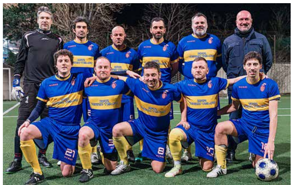
📷 La squadra del Bar Terzo Tempo

N essun problema per il Ristorante Buca 19 che si impone 8-2 sull'Idro Impianti e aggancia, seppure momentaneamente, al primo posto il Termodrim. Bene l'Officine Barnobi che porta a casa i tre punti dalla complicata gara con l'Abbigliamento Nistri. Primi punti per il Bar G grazie al 3-2 sul Terzo Tempo; 4-4 tra Lasko e C Solutions. In B, il Pegasus batte 4-2 il Brezzilegni, risponde l'Allianz con un 6-5 all'Ortofrutta Alessandro. Ok anche per New Team (7-6 alla Pizza Smile) e Studio Dentistico A+A (4-2 al Beat). In Serie C, scappa il Petes grazie al 5-4 sull'Istria e al pareggio dei South Boys con lo Sport Car (3-3). Il Bass Company (4-3 al Dobroleg) aggancia Gelsi e soci al secondo posto.