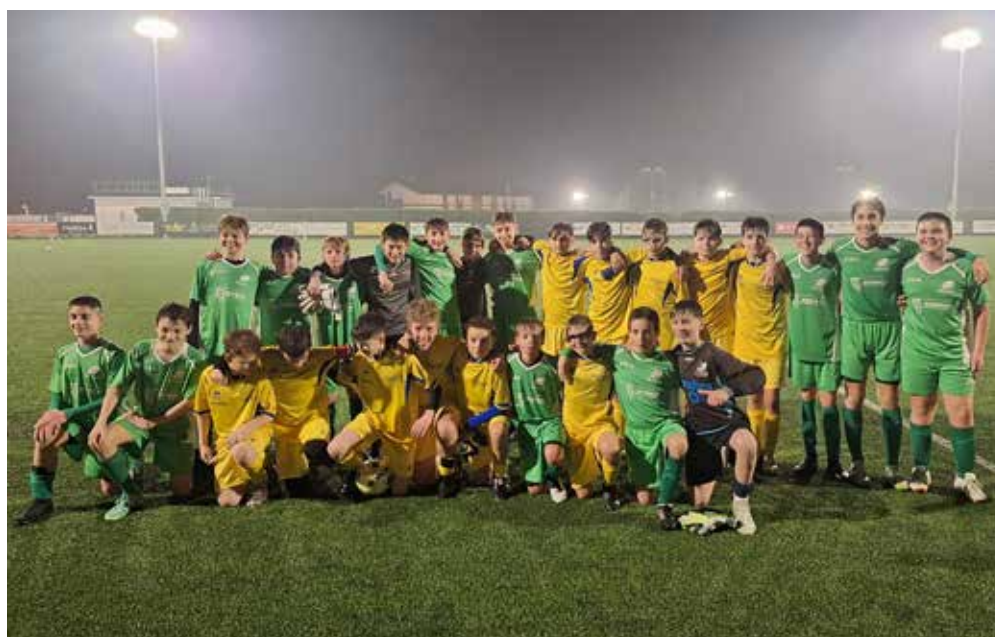
Foto di gruppo per San Luigi B e Opicina A