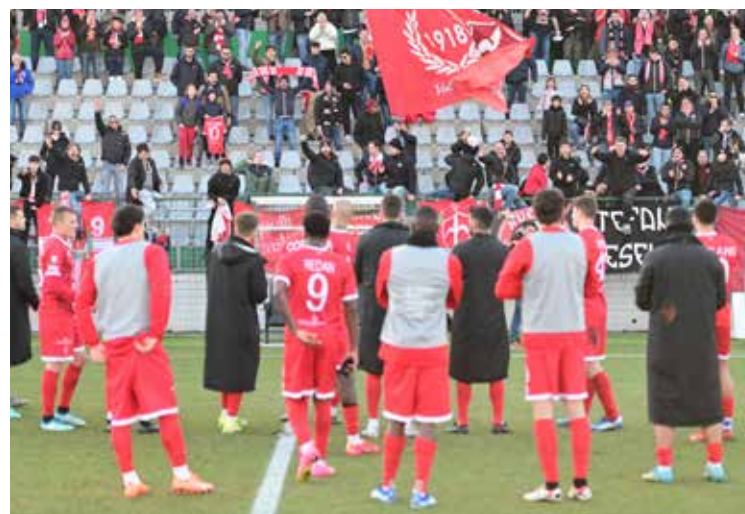
📷 Tifosi al "Tognon": l'Unione non vince in casa dal 9 dicembre

È quasi superfluo dire che la Triestina, dopo avere ritrovato il passo fuori casa, ha bisogno di ricostruire il feeling con il "Tognon" per poter lottare con il Vicenza per la terza piazza. E sarà fondamentale uscire al meglio dal piccolo tour de force che attende gli alabardati: dopo l'Alessandria, ci sarà la trasferta di Arzignano sabato, il recupero con l'Atalanta Under 23 il 3 aprile e la Virtus Verona