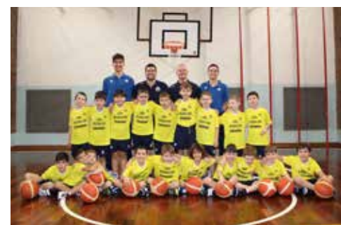
📷 I Pulcini Arcobaleno