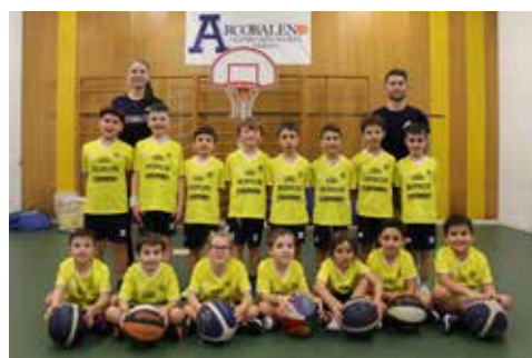
📷 Arcobaleno scuola Laghi