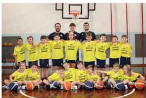
📷 Gli Scoiattoli Arcobaleno