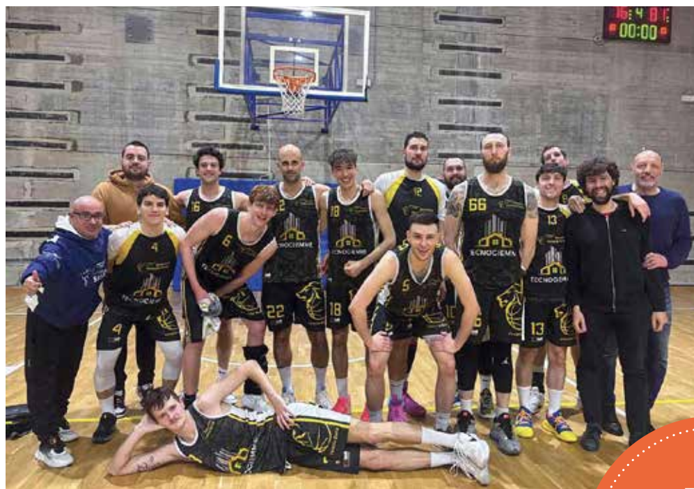
📷 La capolista di DR1 Tecnogiemme Venezia Giulia festeggia la vittoria a Cervignano

In serie C, disco rosso per il baskeTrieste sul parquet di Corno di Rosazzo: il 69-40 finale delinea a chiare tinte la difficile serata al tiro della squadra di Piersante, mai in partita al cospetto di una Calligaris attenta