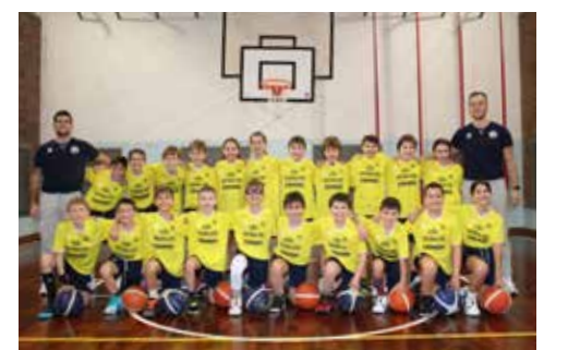
📷 Gli altri Aquilotti Arcobaleno