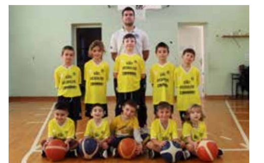
📷 La scuola Rodari Arcobaleno