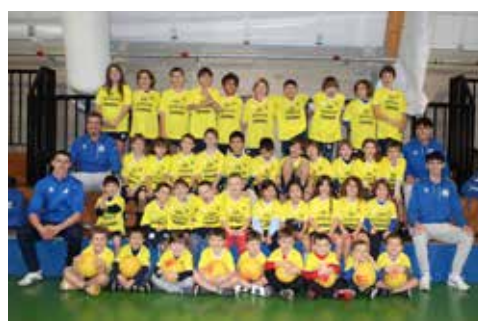
📷 L'Arcobaleno di Opicina