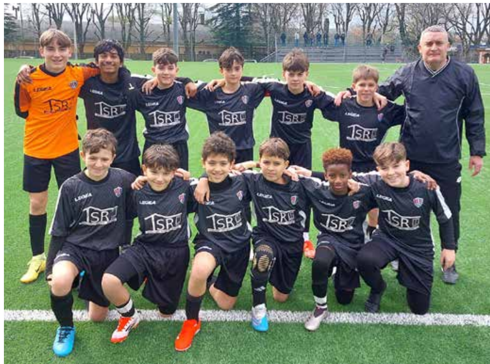
📷 La squadra della Roianese A, sabato impegnata con l'Opicina B

Nel girone B, vittoria di misura del San Giovanni nero ai danni del Fani Olimpia A. Partita ben interpretata dai rossoneri, contro una squa-