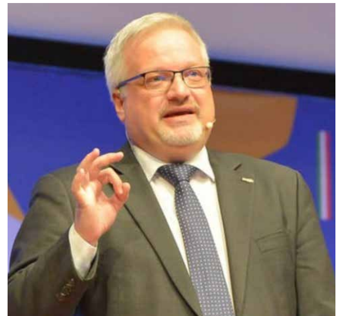
📷 Andrea Marcon è l'ex presidente nazionale della Federazione di baseball e softball

È iniziata l'ultima settimana in cui potersi candidare a rappresentare il Coni regionale, che vede il rinnovo di vari organi tra cui comitato, consiglio e giunta. Noi puntiamo il teleobiettivo alla corsa al vertice, che vedrà una nuova persona nel ruolo di presidente. Dopo 12 anni, infatti, Giorgio Brandolin non sarà più il numero uno dello sport Fvg in quanto la nuova legislatura vigente prevede la possibilità di rimanere in carica per un massimo di tre mandati. Venerdì 28 è l'ultimo giorno utile per la presentazione delle candidature, e al momento i rumors parlano di un probabile duello per la presidenza.