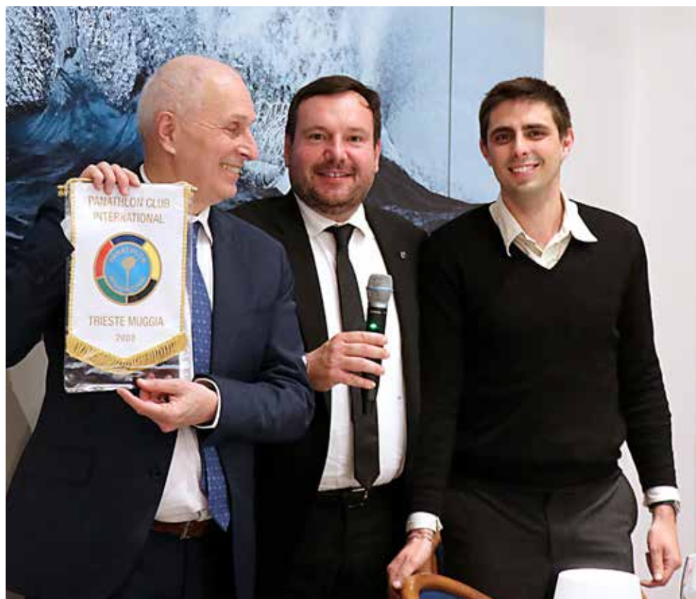
📷 In alto, la foto di gruppo della serata alla "Triestina della Vela"