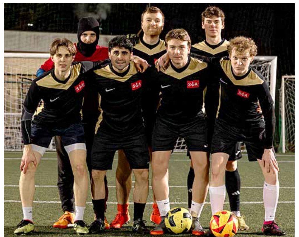
📷 La squadra del Tripmare, impegnata in Serie B

Nel torneo di basket, lo Spazzidea aggancia in testa i Detroit Cistons grazie alla vittoria per 60-39 ai danni dell'Old School e alla sconfitta di Spolaore e compagni per mano della Muiesana, che centra il primo successo per 69-47.