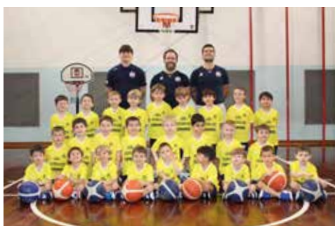
📷 I Baby Arcobaleno