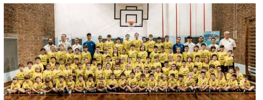
📷 Il numerosissimo gruppo Arcobaleno 2024/2025