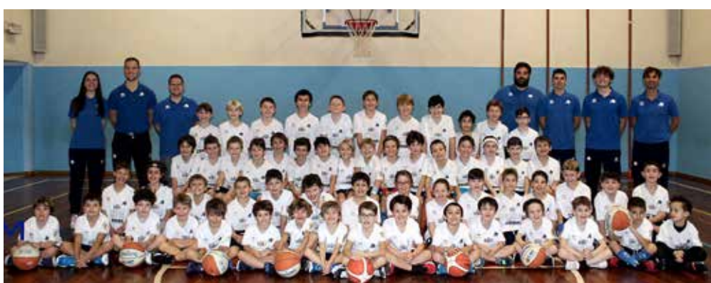
📷 Il gruppo Azzurra 2024/2025 al completo