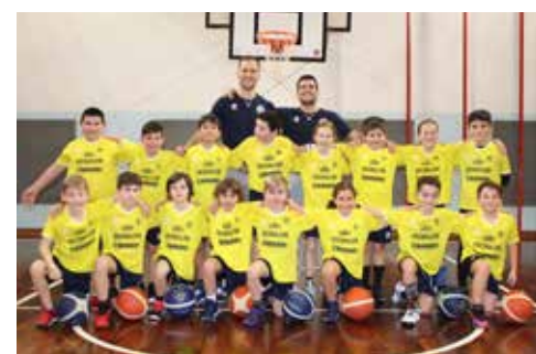
📷 Un gruppo di Aquilotti Arcobaleno