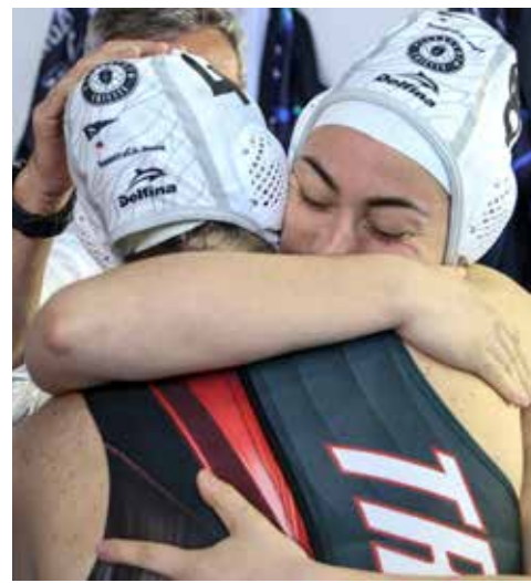
Le orchette ci hanno provato ma è stata Padova a vincere la coppa