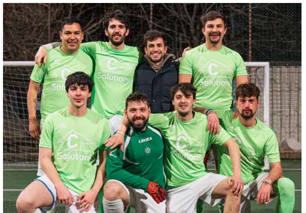
📷 La squadra del C Solutions

T ermodrim sempre davanti grazie al 3-0 sul Bar G. Rispondono Buca (5-3 al Nistri) e Barnobi (4-3 al C Solutions), tre punti anche per Moto Charlie e Idro Impianti che superano Banda Laso (6-2) e Terzo Tempo (6-3). In B, l'Allianz rimane in testa dopo il 4-3 allo Studio A+A, Pegasus e Beat tengono il passo e battono Smile (3-1) e Ortofrutta Alessandro (4-3); 5-4 del Brezzilegni alla New Team. In C, continua la marcia del Petes (3-2 ai South Boys), a segno anche Bass (7-4 all'Istria) e Dobroleg (3-1 allo Sportcar).