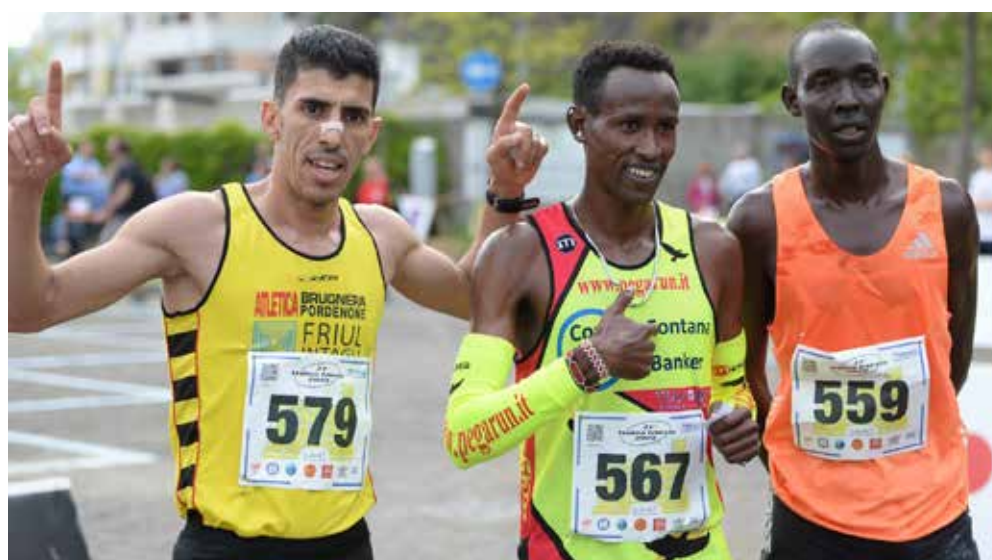
📷 Il podio maschile della 10K del 2023

sorrisi contagiosi e il folto pubblico di genitori, amici e famigliari che si divertiranno assieme a loro. Sabato, invece, sarà la giornata dedicata agli eventi collaterali che spazieranno dai momenti di discussione e riflessione a quelli più spensierati a base di musica. Domenica, invece, gli appuntamenti clou a iniziare dalla Family Color Run, l'esempio lampante di cosa sia il mondo di Trieste Atletica: sui 5 km disegnati sul lungomare, con partenza alle 11, ci sarà spazio per tutti... ma proprio tutti perché - e questo è il motto del sodalizio alabardato, quello con più tesserati in regione