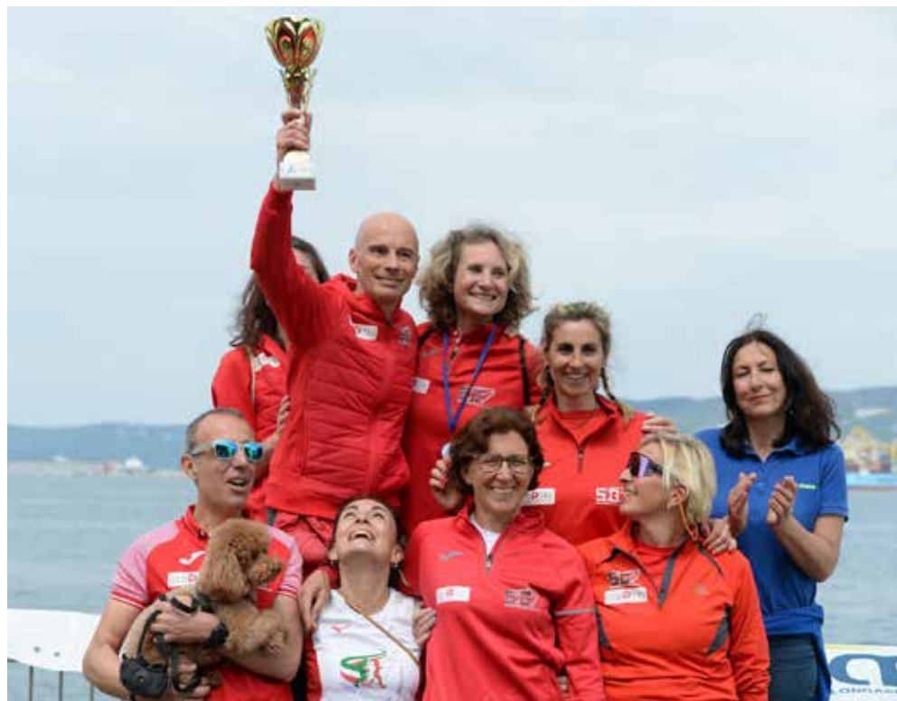
📷 Una foto della Mujalonga Sul Mar 2023

TANTO COLORE Tornando alle corse, si partirà già al venerdì mattina con il ghiotto antipasto della MiniMuja, che vedrà oltre 500 fra bambine e bambini scatenarsi nelle vie del centro rivierasco fra