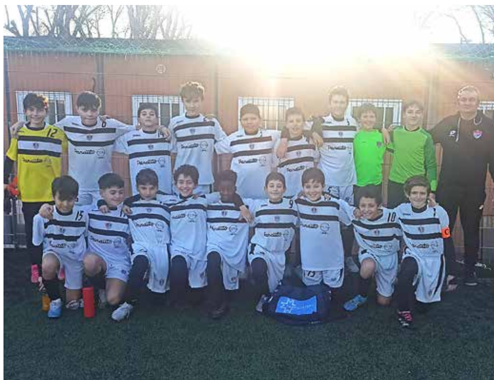
I ragazzi della Roianese B