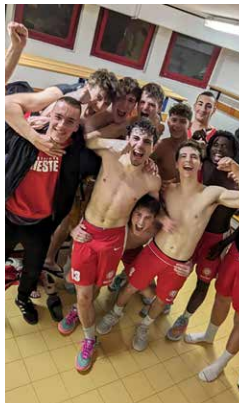
📷 La gioia del baskeTrieste, qualificato alle semifinali playoff di serie C

Prosegue, in DR1, l'ultima fase del torneo: nella Poule Promozione girone Gold