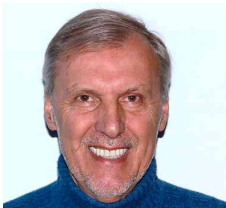
📷 Walter Rusich, storico dirigente della pallavolo triestina, lancia l'ennesimo grido di dolore